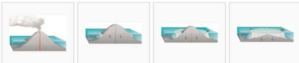
Slika 7. Teorija nastanka koraljnih grebena: a) vulkan pri gašenju, b) pregradni greben, c) obrubni greben, d) atol

Charles Darwin je još 1842. opisao način stvaranja koraljnih grebena. Njegova teorija počinje gašenjem vulkanskih otoka i slijeganjem otoka prema oceanu, nakon čega nastaju rubni grebeni. Daljnjim slijeganjem, rubni greben se preobrazi u barijerni greben te se pretvara u veći greben s većim i dubljim lagunama. Na kraju, kad otok bude ispod mora, barijerni greben se preobrazi u atol koji zatvara središnju lagunu (Slika 7.).