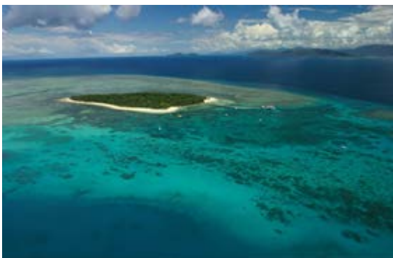
Slika 4. Veliki barijerni greben u Australiji

b) barijerni koraljni grebeni – koraljni grebeni usporedni s obalom, ali od nje odvojeni povećom lagunom. Sadrže iste pojaseve kao i obrubni grebeni, ali s nekim dodacima. Najveći na svijetu su Veliki pregradni greben blizu obale Queenslanda u Australiji (Slika 4.) i pregradni greben Belize, u Karibima, a manji se mogu vidjeti i oko vulkanskih otoka koji tonu.