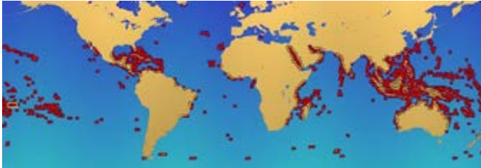
Slika 6. Rasprostranjenost koraljnih grebena u svijetu

U Jadranskom moru također postoje zajednice koralja koje najčešće nastaju na dubinama do 30m, a posebno su bogate u podmorju zaštićenih područja Nacionalnog parka Mljet i Parka prirode Telašćica.