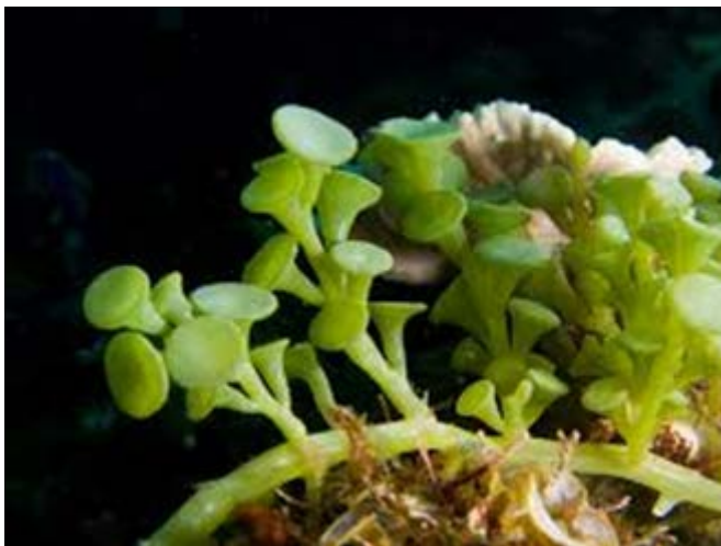
Slika 9. Invazivna zelena alga Caulerparacemosa

Jedan od razloga ugroženosti su i invazivne vrste, među kojima je najpoznatija invazivna zelena alga Caulerparacemosa (Slika 9.).