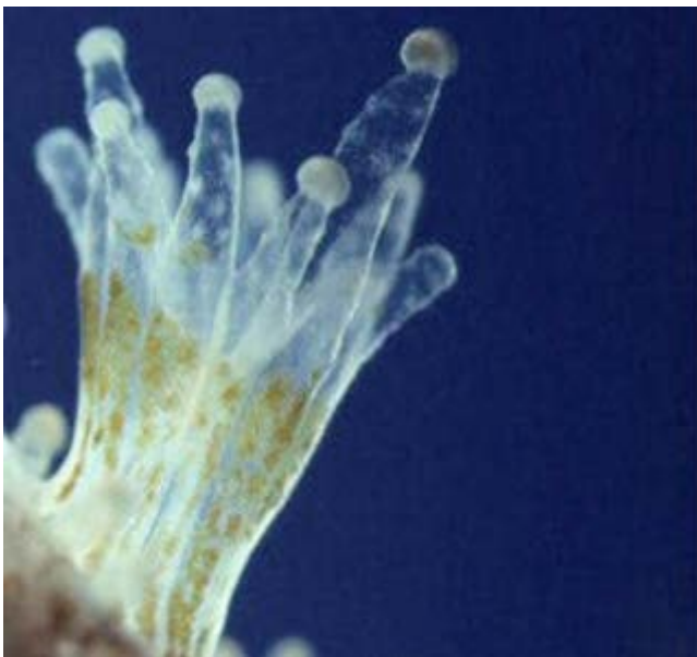
Slika 2. Zooxanthellae u polipu koralja

Prilikom svog rasta, koraljni polip luči vapnenac. Tako se polip izgrađuje oko kostura mrtvih koralja koji preostane nakon što polip uginu. Većina koralja koji izgrađuju grebene živi u kolonijama od milijun sitnih koraljnih polipa koji tijekom rasta stvaraju zajedničke kosture. Za izgradnju skeleta polipi koriste kalcij iz morske vode. Kada uginu, ti skeleti postaju tvorevina koju mi prepoznamo kao koraljni greben.