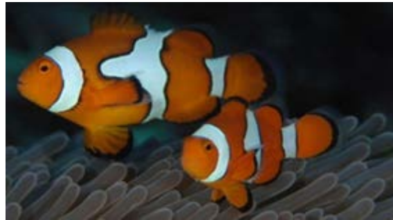
Slika 8. Amphiprion percula , riba klaun

lovkama svojim plivanjem. Vlasulja također predstavlja odlično mjesto gniježđenja za ove vrste riba jer svojim lovkama štiti jajašca od predatora.