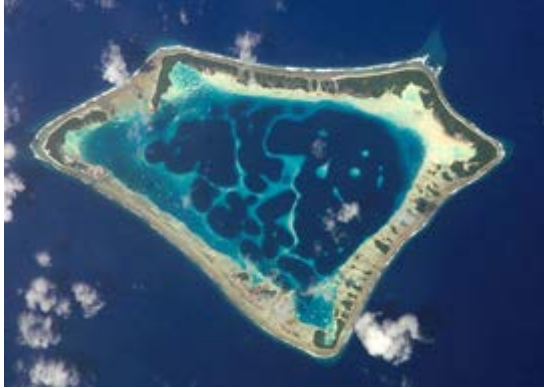
Slika 5. Atafu atol u južnom Pacifiku