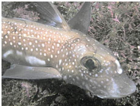
Slika 10. Himere ( Chimaeriformes )

Red Chimaeriformes su ribe s velikom glavom i tankim, dugačkim repom koji liči na bič. (Slika 10.) Tijelo im je valjkasto, bočno malo spljošteno. Imaju velike oči. Gornja vilica je čvrsto povezana s lubanjom i u njoj imaju dva para debelih "zubnih" pločica, a u donjoj vilici samo jedan par. Koža nema ljustice. Imaju dug rep i na leđima dvije peraje. Prva je kraća, i na početku ima dugačku otrovnu bodlju. Druga je duža i spušta se niz tijelo kao obrub. Prsne peraje su im velike i vrlo su važne za kretanje.