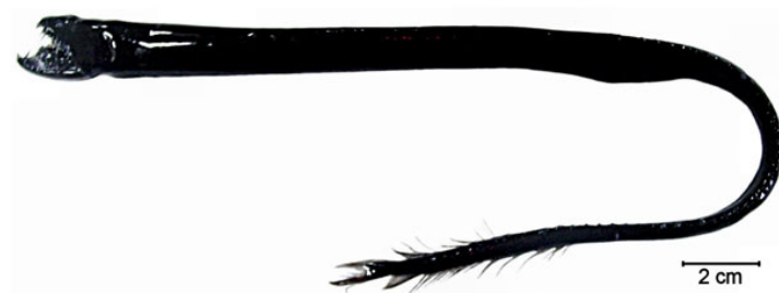
Slika 4. Crni zmijozub ( Idiacanthus antrostomus )

Pripada porodici Stomiidae. Ima crno, zmijoliko tijelo i velike zube koji se moraju okretati kako bi se usta mogla otvoriti i zatvoriti. (Slika 4.) Ženke su 4 puta dulje od mužjaka. Plijen privlači koristeći svjetleći organ koji je smješten na kraju brčića, koji se pruža iza prednjeg dijela donje čeljusti. Ima svjetleće organe duž trbuha. Hrani se noću pomičući se bliže površini i lovi manje ribe. (Borovac, 2001.)