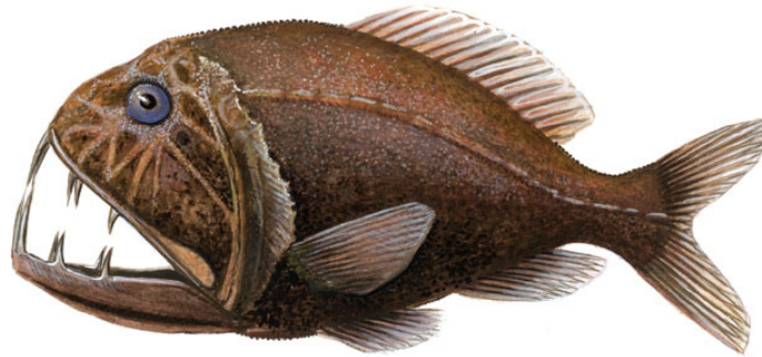
Slika 3. Zmijozub ( Anoplogaster cornuta )

Pripada porodici Stomiidae. Naseljuje područje batipelagijala. Dubokomorski predator s neobičnim prilagodbama za lov plijena, velike gipke čeljusti, oštri zubi. (Slika 3.) Na tijelu ima svjetleće organe, fotofore. Nema ljusaka na tijelu, crno – tamno smeđe je boje. Hrani se noću kad ide bliže površini, a po danu ide dublje u vodu. (Borovac, 2001.)