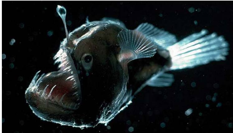
Slika 9. Morski vrag ( Melanocetus johnsonii )

Pripada porodici Lophiiformes. (Slika 8.) Zaobljena su tijela prilično nespretnog za plivanje, ali veoma praktičnog za nepomično stajanje u vodi. Koža im je glatka, tamna i bez ljustica, imaju mamac iznad glave. Nastao je izdvajanjem i produživanjem šiljka iz leđne peraje te završava nepravilnom mesnatom svjetlećom izraslinom koja im pomaže pri hvatanju hrane. (Borovac, 2001.)