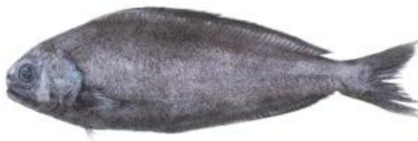
Slika 8. Pastir šiljoglavac ( Centrolophus niger )

Pripada redu Perciformes. ( Slika 8. ) Živi pojedinačno ili u manjim jatima. Tijelo je vretenastog oblika, bočno spljošteno. Boja tijela je crna s leđne strane, siva s trbušne strane tijela. Naraste do 150 centimetara. Iako je dubokomorska vrsta, zalazi i u pliće vode. Mlade jedinke imaju poprečne tamne pruge na bokovima i žive blizu površine. Mrijeste se tijekom jeseni i zime. Hrane se mekušcima, ribama, meduzama. Kozmopolit, u Jadranu je veoma rijedak, najbrojniji je u istočnom Atlantiku i južnom Pacifiku. (Borovac, 2001.)