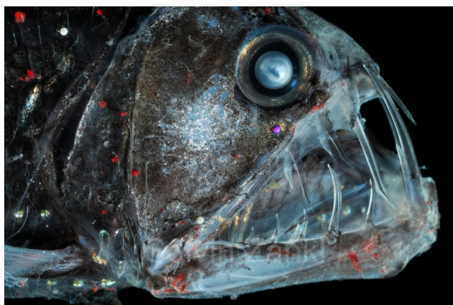
Slika 2 Iglozub ( Chauliodus sloani )

Pripada porodici Stomiidae. Živi na dubinama od 200 – 4700 metara. Iglozub je prepoznatljiv po velikim ustima i izrazito dugim i oštrim zubima koji ne stanu u usta. ( Slika 2. ) Čeljusti su posebno preobražene tako da se mogu jako, gotovo okomito, rastvoriti, a srce i škrge pomiču se prema natrag i dolje da naprave mjesta za prolaz hrane. Tako mogu progutati ribu veliku kao pola njihovog tijela. Tijelo je duguljasto, srebrnkaste boje, a po tijelu ima veliki broj fotofora, koje luče svjetlo. Narastu do 35 centimetara. Obitava u toplijim dijelovima srednjeg Atlantika, u sjevernom dijelu Indijskog oceana, te u istočnom dijelu Pacifika, sjeverno od ekvatora. Može se pronaći i u Mediteranu, te Južnom i Istočnom kineskom moru. (Borovac, 2001.)