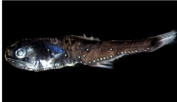
Slika 7. Žaboglav trnasti ( Myctophum asperum )

Pripada redu Myctophiformes. (Slika 7.) Jedna je od najbrojnih dubokomorskih vrsta riba i važna spona u oceanskom hranidbenom lancu. Jedu planktonske račiće, a njih jedu tuljani i veće ribe. Imaju svjetleće organe na glavi i tijelu. Različit raspored ili veći svjetleći organi blizu repa pokazuju je li riba mužjak ili ženka. (Borovac, 2001.)