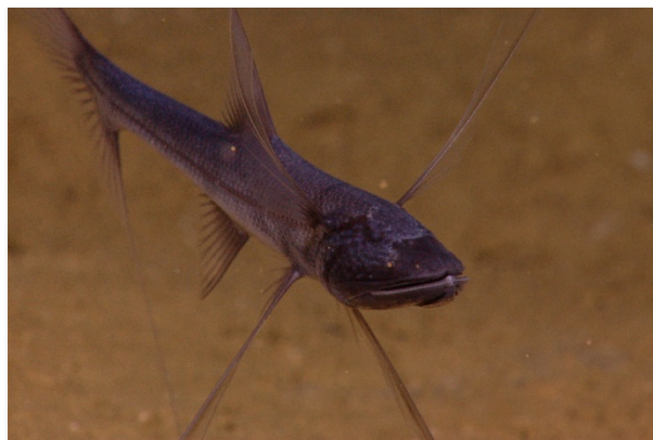
Slika 6. Riba tronožac ( Bathypterois grallator )

Pripada redu Aulopiformes. (Slika 6.) Riba je uzdignuta od dna oceana na tronošcu što ga čine izdužene šipčice trbušnih peraja i repne peraje. Hrani se račićima. Oči su joj vrlo malene, a usta imaju veliki otvor, kraj gornje čeljusti smješten je daleko iza ruba očiju. Prsne peraje imaju razgranatu živčanu mrežu. (Borovac, 2001.)