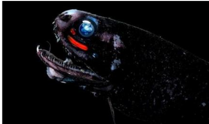
Slika 5. Labavousta riba ( Malacosteus niger )

Pripada porodici Stomiidae. (Slika 5.) Nema membrana koje bi spojile njezine čeljusti i jezik. Glava se može okretati, a čeljusti su pružive, što omogućuje hvatanje plijena većih od njih samih. Noću migrira prema površini zbog hrane. Oko usta smješteni fotofori. (Borovac, 2001.)