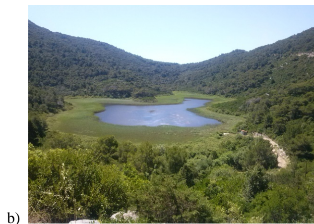
Slika 3. Staništa vretenaca: a) tekuće vode (rijeka Zrinčica, Banija), b) stajaće vode (jezero Blatina, otok Mljet).