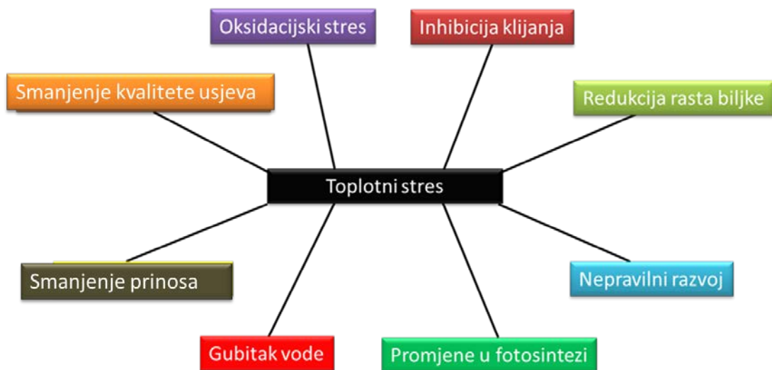
Slika 1. Glavni utjecaji visoke temperature na biljke (preuzeto i prilagođeno iz Hasanuzzaman i sur., 2013a)