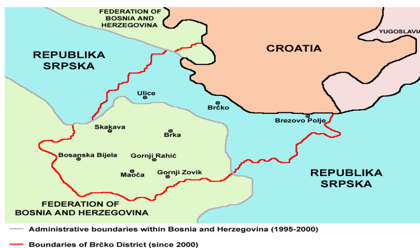
Slika 4. Položaj distrikta u odnosu na entitete i susjedne države

Bosna je oduvijek bila raskrižje kultura i mjesto sukobljavanja susjednih središta moći. Upravo zbog svog položaja uvijek je imala nestabilnu državnu organizaciju, bez obzira u čijem sastavu je bila. Značajka Bosne je položaj uz smjerove velikih prodora: bila je klin turskog prodora u Europu i zemlja prve linije austrougarskog prodora na istok. U Jugoslaviji dobiva drugačiji položaj, postaje jezgra ali samo u prostornom i geostrateškom smislu, ne i u političkom. Gravitacijski Bosna je sa sjevera, zapada i juga upućena na Hrvatsku prema kojoj se široko otvara iz svoje gorske jezgre. Takva veza sa istočne strane, tj. sa Srbijom ne postoji zbog rijeke Drine koja predstavlja prepreku (Klemenčić, 1997).