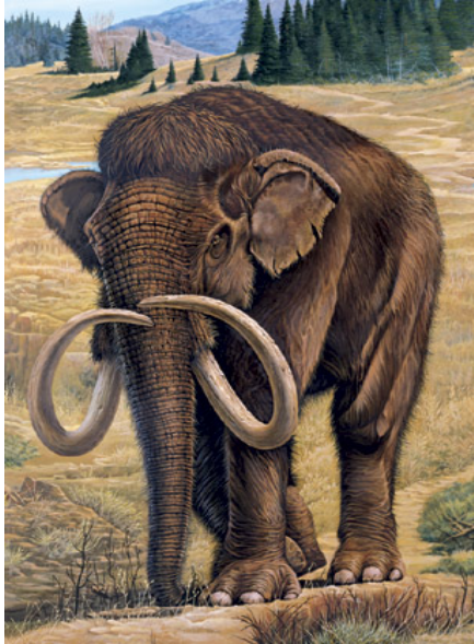
Slika 2. Vunasti mamut

primigenius . U razdobljima donjeg i srednjeg pleistocena istodobno s mamutom živjeli su u Europi i slonovi iz roda Elephas : Elephas falconeri Busk (1867) i Elephas namadicus Falconer et Cautley (1845) tzv. šumski slon (Rukavina, 1996).