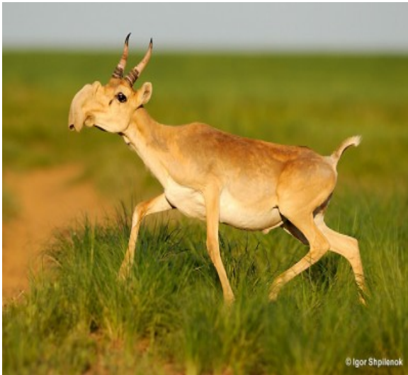
Slika 14. Sajga antilopa

Sajga antilopa (sl. 14) živjela je u ledenom dobu u travnatim stepama periglacialnih područja Europe i Azije. Areal joj se prostirao od Britanskog otočja, kroz centralnu Aziju i Beringov prolaz pa sve do Aljaske. Početkom 18. stoljeća mogla se vidjeti na obalama Crnog mora i u podnožju Karpata ali zbog pretjeranog izlova, danas živi samo u stepskim i brežuljkastim, pjeskovitim područjima oko rijeke Volge. Ova antilopa ima glavu s rogovljem dugačkim do 25 centimetara u obliku nepravilno oblikovanog glazbala - lire a nosni joj je dio glave izbočen poput malog rila (Rukavina, 1996).