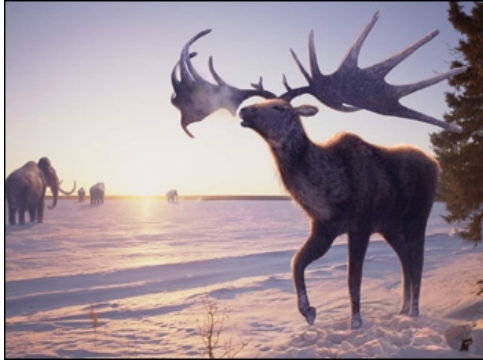
Slika 7. Golemi jelen