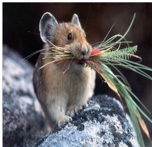
Slika 21. Stepski zviždar