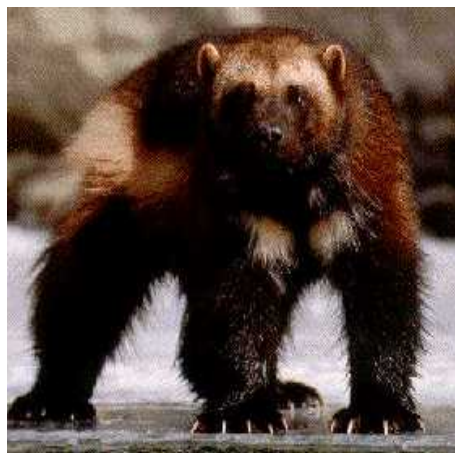
Slika 18. Žderonja

Žderonja (rosomah) je velika kuna (sl. 18) koja je za maksimalnih zahlađenja tijekom ledenog doba bila široko rasprostranjena. Danas obitava na ograničenim prostorima šumovite tundre i tajge u južnim područjima Norveške, Finske, na Grenlandu, u sjevernoj Aziji i sjevernoj Americi. Žderonja je veličine vidre, oko 80 centimetara, tamno smeđeg je krzna i živi osamljeno na samo jednom stalnom teritoriju. Hrani se raznim životinjama, strvinama ali i raznim bobicama (Rukavina, 1996).