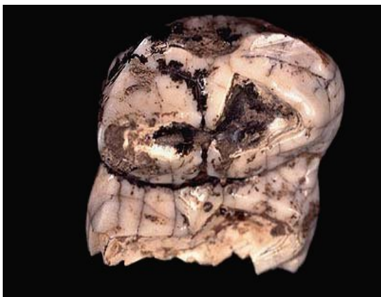
Slika 4. Čunjasti kutnjak mastodonta