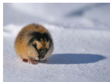
Slika 19. Leming

Leminzi su mali glodavci koji su u hladnim područjima glavna hrana polarnoj lisici i drugim grabežljivcima. Naseljavali su područja tundre u velikom broju. Danas su brojni u arktičkim prostorima Amerike, Europe i Azije.