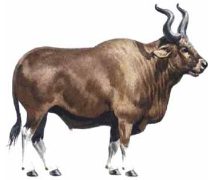
Slika 8. Govedo tur