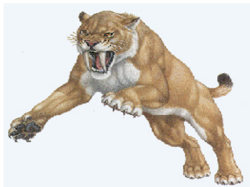
Slika 10. Sabljozubi tigar

Veličinom i robusnom građom tijela više je nalikovao medvjedu, stoga je i lovio veće životinje poput bizona, jelena, konja, američkih deva, pa čak i mlade mamute i mastodonte ( http://www.ucmp.berkeley.edu/mammal/carnivora/sabretooth.html ).