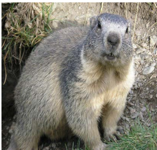
Slika 20. Alpski svizac

Ta životinjica velika je do 15 centimetara i ima sivosmeđe krzno. Živi u skupinama i kopa hodnike ispod zemlje (Rukavina, 1996).