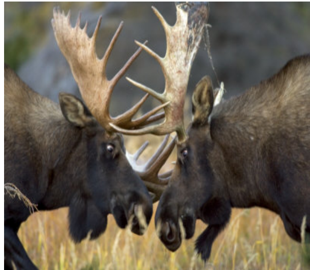
Slika 15. Losovi u borbi