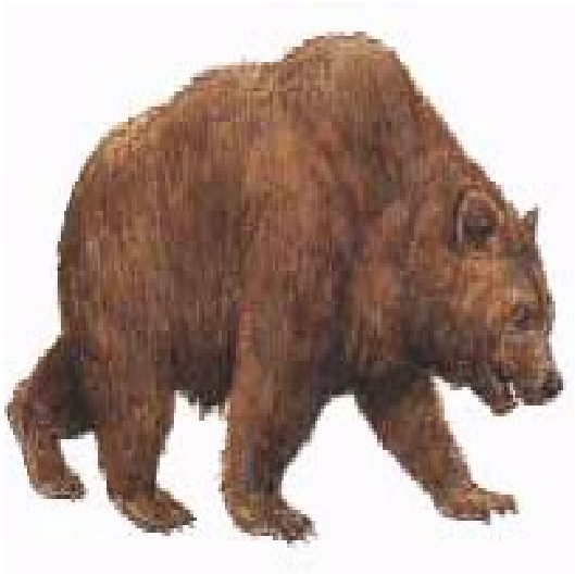
Slika 11. Špiljski medvjed