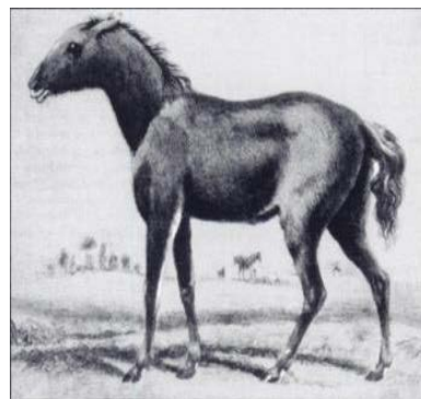
Slika 9. Tarpan

Tarpan ili europski divlji konj (sl. 9) je izumrla podvrsta divljeg konja koja je obitavala na području od južne Francuske i Španjolske pa sve do centralne Rusije i to pretežito kao stanovnik šumovitih područja. U divljini je nestao između 1875. i 1890. godine. Zadnja ulovljena jedinka uginula je 1909. godine u ruskom zoološkom vrtu ( http://www.petermaas.nl/extinct/speciesinfo/tarpan ).