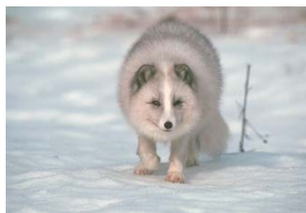
Slika 17. Polarna lisica