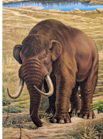
Slika 3. Mastodont