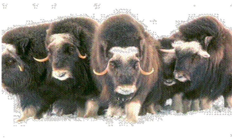
Slika 13. Krdo mošusnih goveda

Mošusno govedo dugačko je oko 2 metra, visoko oko 1 metar, a teži i do 400 kilograma. Tijelo mu je robusne građe s kratkim tijelom i nogama, prekriveno tamnosmeđom, gustom i do jedan metar dugom dlakom. Na glavi se nalaze oštri rogovi savinuti prema dolje i van. Mošusno govedo se hrani travom, mahovinom i polarnom vrbom. Živi u krdima (sl. 13) od 6 do 9 jedinki (Rukavina, 1996).