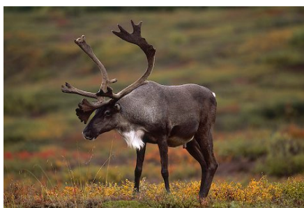
Slika 16. Sob

Polarna lisica je uz polarnog medvjeda jedini grabežljivac od zvijeri koji je tijekom cijele godine stalno prisutan u hladnim, granično kritičnim uvjetima. Danas obitava u arktičkom području Skandinavije; u Norveškoj, Finskoj, na Islandu i sjeveru Rusije. Obitava u tundri i na planinskim područjima iznad šuma, no često slijedi polarne medvjede i na santama arktičkog leda kako bi pojela ostatke njihova ulova. Ima podugačak rep i dugu dlaku sivo smeđe boje koja zimi postaje bijela (sl. 17). Uške su joj vrlo male zbog prilagodbe na ekstremnu klimu. Hrani se miševima, leminzima, kukcima, strvinama i raznim bobicama (Rukavina, 1996).