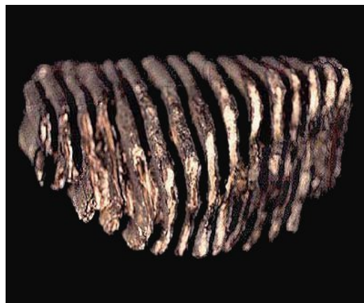
Slika 5. Visokokruni kutnjak mamuta

Većina populacije mamuta i mastodonta izumrla je krajem posljednjeg ledenog doba. Definitivno objašnjenje za njihovo masovno izumiranje još nije potvrđeno. Fascinantna je činjenica da je jedna populacija vunastog mamuta na izoliranom Wrangel otoku u sjeveroistočnom Sibiru izumrla tek oko 1700. godine prije Krista ( http://www.bbc.co.uk/nature/wildfacts/factfiles/3004.shtml ).