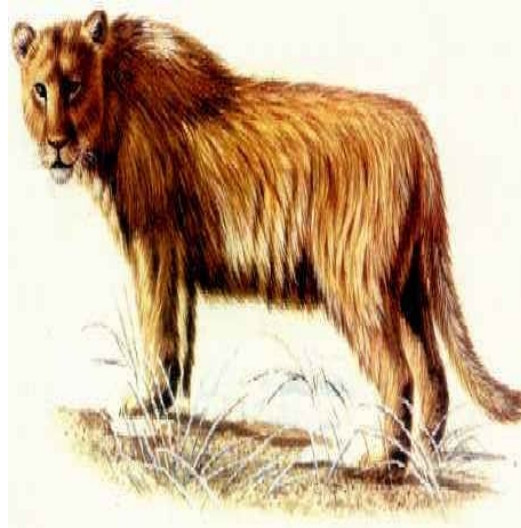
Slika 12. Špiljski lav