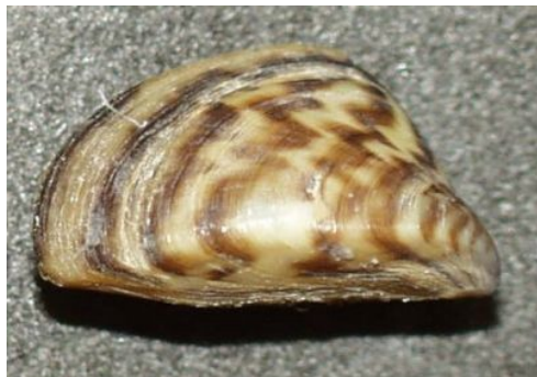
Slika 6. – Vrsta Dreissena polymorpha

Brojem vrsta najzastupljenije porodice su za školjkaše Unionidae, a za puževe Planorbidae, obje s po 7 vrsta. Puževa prednjoškržnjaka ima samo pet vrsta i to su uglavnom vrste prilagođene za život u različitim uvjetima npr. Viviparus viviparus kojeg ima na svim lokalitetima.