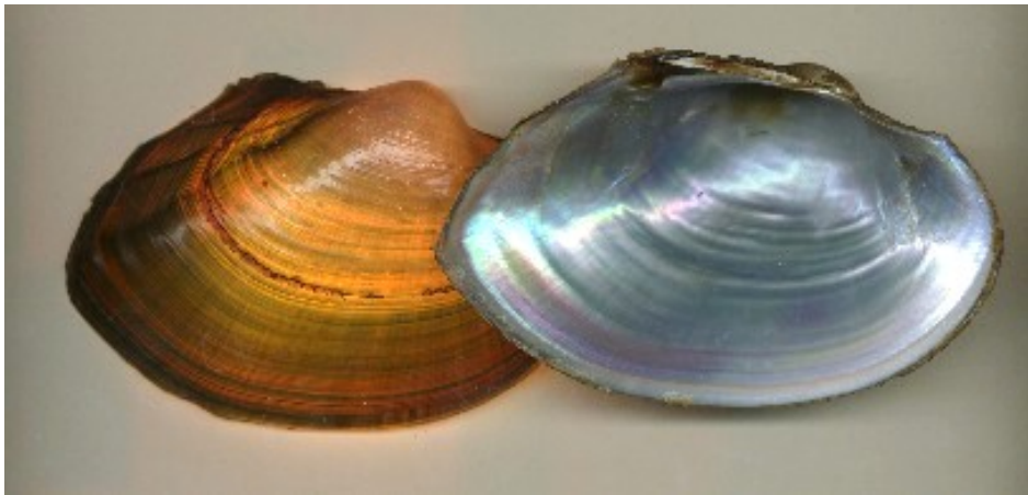
Slika 3. – Vrsta Anodonta woodiana

Viljevački ribnjak je zapravo kanal koji je proširen i produbljen prije 15 godina. Dug je više od pola kilometra, širok 6-12 m, dubina se kreće od 1 do 4 m. Za višeg je vodostaja ribnjak spojen s Dravom kanalom dugim 1 km pa razina vode u njemu ovisi o razini vode u Dravi. Zbog debelog sloja mulja na dnu voda je u njemu uvijek mutna. Budući da se ribnjak koristi za sportski ribolov, redovno se poribljava, što ostavlja mogućnost unosa, za ovo područje alohtonih vrsta. Ovo je ljeto unesena jedna vrsta vodene paprati koja se vrlo brzo proširila preko cijele površine ribnjaka, stvarajući na njoj debeli sloj zbog kojeg je došlo i do pomora ribe. Od mekušaca je s ribom vjerojatno unesena vrsta istočnoazijska bezupka, Anodonta woodiana (Slika 3) koja je ovdje postala vrlo brojna te najvjerojatnije potpuno istisnula lokalne vrste, budući da ih već neko vrijeme ne nalazim u ribnjaku.