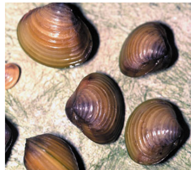
Slika 7. – Vrsta Corbicula fluminea http://www.neozoen- bodensee.de/images/4.jpg