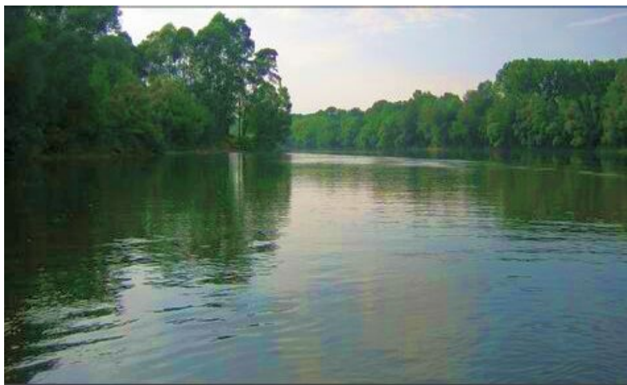
Slika 2. – Drava kraj Viljeva http://www.viljevo.hr

U dijelu koji prolazi kraj Viljeva, Drava ima obilježja donjeg riječnog toka: relativno spor protok vode, brojni sprudovi i rukavci te duboko i široko korito, mjestimično šire od 300 m (Slika 2). Vodostaj u pravilu raste u proljeće i jesen, dok je u siječnju i kolovozu minimalan, no posljednjih nekoliko godina u kolovozu ostaje i do 2 m iznad minimalnog vodostaja. Za istraživanje na Dravi odabrao sam lokalitet Kamen jer tu na relativno malom prostoru ima strmih glinovitih obala, položenih pješčanih obala i dijelova obale prekrivenih kamenom, pa se ovdje mogla očekivati najveća raznolikost mekušaca.