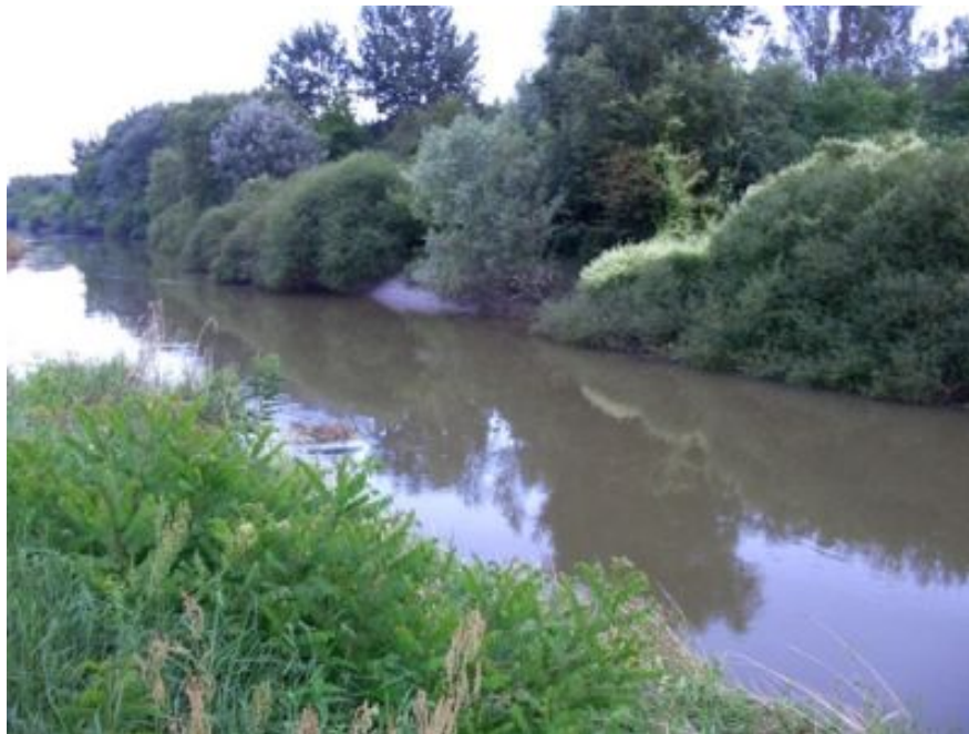
Slika 4. – Karašica kraj mjesta Kapelna http://www.viljevo.hr