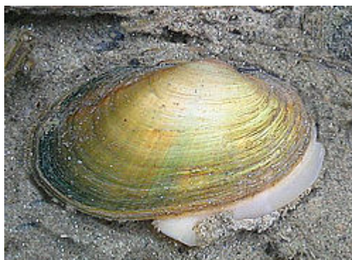
Slika 5. – Vrsta Unio crassus http://schleswig-holstein.nabu.de/imperia/md/images/schleswig-holstein/wasserrahmenrichtlinie/unio-crassus.jpg