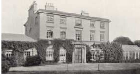
Slika 2. Darwinova kuća u Shrewsburyu