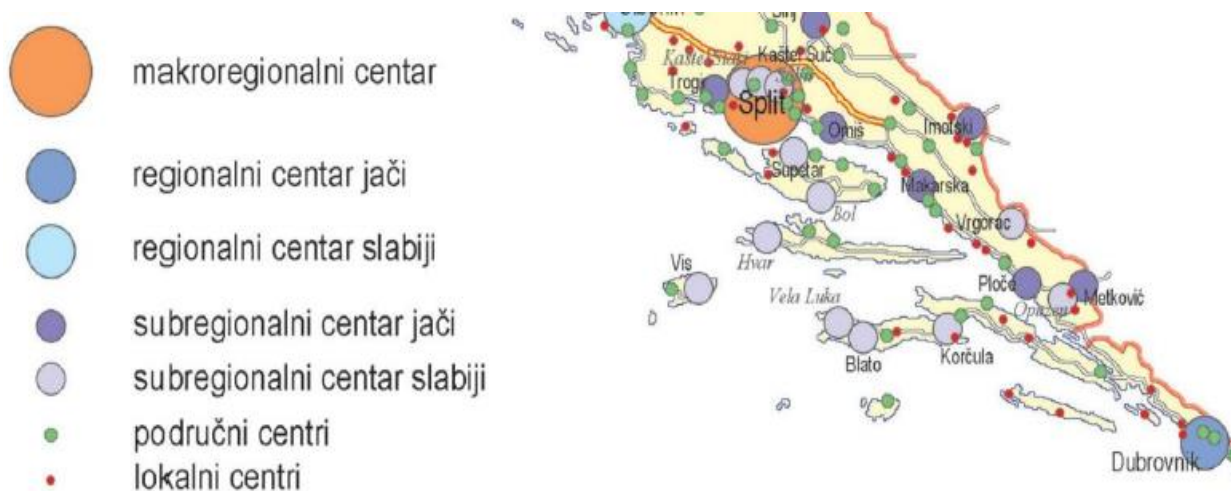
Slika 1. Veza stupnja centraliteta (subregionalni centar jači, okružen naseljima niže kategorije poput područnih i lokalnih centara) i prometne povezanosti

Imotska krajina je geografsko područje smješteno na prostoru Dalmatinske zagore. Nalazi se na sjevernoj strani planine Biokovo, između Bosne i Hercegovine i Dalmacije. Na sjeveroistoku je omeđena granicom s BiH, na jugu Makarskim primorjem, a sa sjeverozapada sinjsko-omiškim prostorom. Obuhvaća područja upravnih jedinica Ciste Velike, Ciste Provo, Lovreća, Prološca, Lokvičića, Runovića, Zmijavaca, Podbablja te središnjeg i ishodišnog dijela, grada Imotskog. Šire područje grada možemo podijeliti u tri prirodne cjeline: krško područje uz obod polja, Imotsko polje i planinski masiv Biokovo. Sam grad se nalazi na nadmorskoj visini od 398 metara što je bitan čimbenik u razvoju i funkcioniranju prometa. Jednosmjerne uske ulice, strmi teren, klima te manje prostora za šire prometnice i veće parkirne prostore samo su neke od odrednica u koje se uklapaju grad i njegov prometni sustav. Unatoč tim određenim nepovoljnim uvjetima za razvoj prometa, grad se nalazi na dobrom geoprometnom položaju. Ako postoji interes i mogućnost da se povežu dva prostora, a to je ekonomski isplativo, ti će se prostori povezati. Danas se povezuju prostori prometnicama čija je izgradnja, često zbog prirodno-geografskih faktora, još u nedavnoj prošlosti bila nezamisliva. To povezivanje ovisi o gospodarskoj razvijenosti prostora. Što je neki prostor razvijeniji to je prometni sistem razvijeniji unatoč nepovoljnoj prirodnoj osnovi. (Maradin, 2008.)