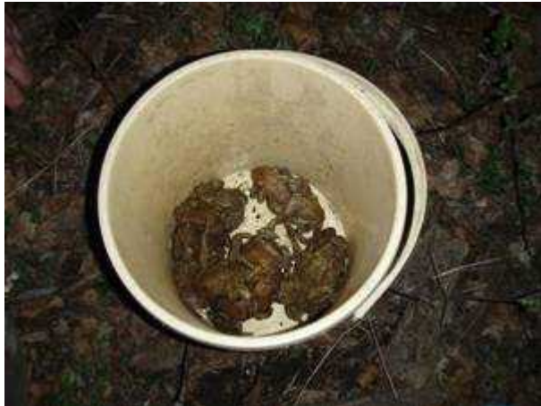
Sl. 17. Skupljanje žaba u kante te njihovo prebrojavanje nakon toga

Ženke nemaju tih problema. One prihvate mužjaka te ga tako za vrijeme migracije nose do bare i ne staju putem. Pošto ženka ide pravocrtno prema bari, izmjereno vrijeme koje joj je potrebno da prijeđe 5.4 metara široku cestu iznosi 3:50 minuta. (Samardžić, 2003.)