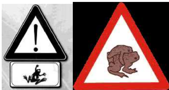
Sl. 12. Znakovi upozorenja za vozače: na mjestima prelaska žaba preko prometnice prilikom odlaska na mrijest

Prometni znakovi upozorenja se postavljaju uz prometnice. Oni osim što osiguravaju sigurnost vozača, stalni su podsjetnik na obližnju populaciju vodozemaca, te kod manjeg intenziteta prelaska žaba omogućavaju siguran prelazak preko ceste. (Sl. 12.)