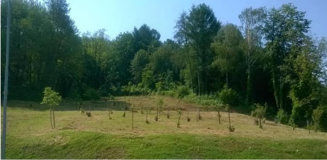
Slika 5. Sanirano klizište u Orahovici