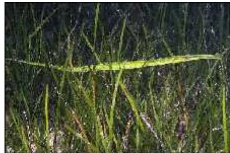
Slika 2. Syngnathus sp.