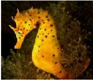
Slika 15. Hippocampus abdominalis ( http://www.daveharasti.com/ )