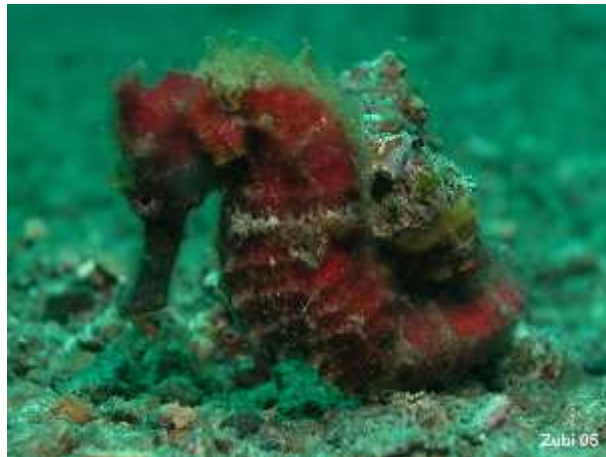
Slika 10. Razne životinje koje žive na tijelu morskog konjica