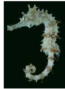
Slika 28. Hippocampus jayakari