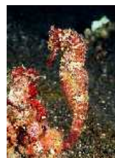
Slika 36. Hippocampus spinosissimus