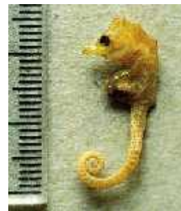
Slika 30. Hippocampus minotaur ( http://www.ifg.biotech.org/ )