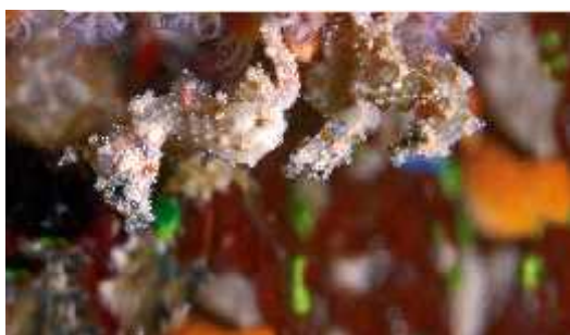
Slika 34. Hippocampus satomiae