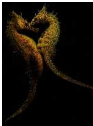
Slika 13. Parenje