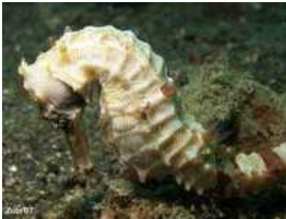
Slika 16. Hippocampus alatus