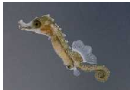
Slika 14. Mladi morski konji

Embrionalni razvoj traje od 10 dana do 6 tjedana ovisno o vrsti morskih konji a i temperaturi vode. Ne zna se da li je spol u morskih konji a uvjetovan genetski ili okolišno, ali njihove populacije uglavnom imaju jednak broj mužjaka i ženki. Nakon što su izašli iz mužjakove vre ice, mladi su neovisni, ali vrlo ranjiv plijen za razliku od njihovih roditelja. Veli ina mladih konji a je izme u 2 i 12 mm te su mnogo manje varijacije me u vrstama u ovom stadiju, nego u odraslom (Sl. 14.). Izgledaju poput malenih kopija svojih roditelja, sa naglaskom na razlike u proporcijama tijela. Ovisno o vrsti, imaju kra u ili dulju gubicu u odnosu na glavu, suženo i izduženo tijelo te rep, ja e izražene greben i e i vijenac na glavi od odraslih (Lourie, S. A. i sur., 2004.). Ve ina vrsta svoje prve dane provodi u stupcu vode jer im je potrebna velika koli ina zooplanktona, naj eš e sitnih ra i a.