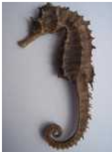
Slika 24. Hippocampus guttulatus