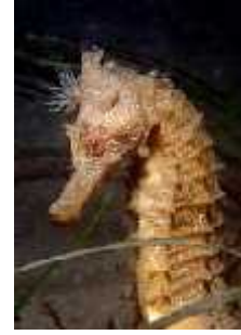
Slika 27. Hippocampus ingens ( http://www.daveharasti.com/ )