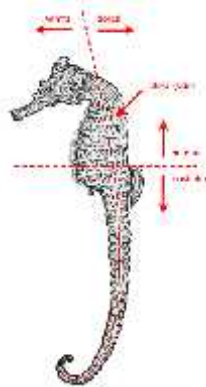
Slika 5. Izgled morskog konjica

Tijelo morskih konjica ima glavu, trup i rep (Sl. 5.). Veličinom se znatno razlikuju, od svega 13,8 mm vrste Hippocampus satomiae do 35 cm vrste Hippocampus abdominalis . Tijelo im je bilo spljošteno, a obavija ga kruti prstenasto lankoviti plašt, odnosno krute plovice ili prstenovi. Vrste se međusobno razlikuju po broju tih krutih prstenova. Tijelo je prekriveno kožom, umjesto ljuskama, ali kao i kod svih riba kožu od infekcija štiti sluzava prevlaka.