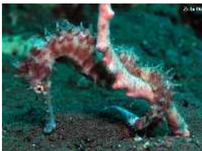
Slika 26. Hippocampus histrix