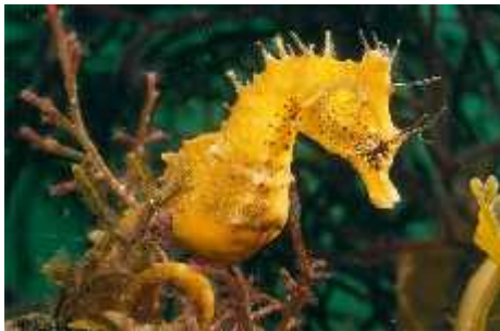
Slika 1. Hippocampus sp.

Do danas je otkriveno i opisano 49 vrsta (vidi poglavlje 7.) morskih konja a ( www.eol.org ), iako se u mnogim izvorima spominje 35, ali to su izdanja koja su izašla prije nego su nove vrste otkrivene.