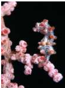
Slika 18. Hippocampus bargibanti