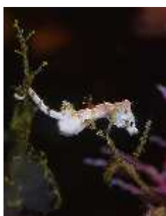
Slika 32. Hippocampus pontohi