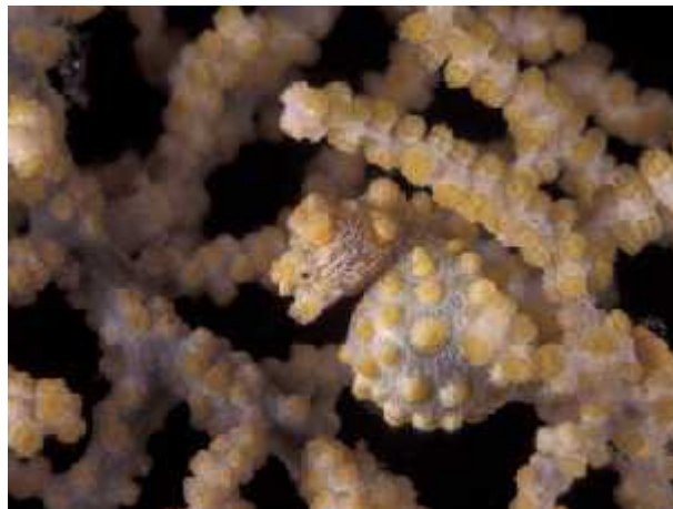
Slika 9. Mimikrija

široko rasprostranjene. Neki morski konji i žive na specifičnim staništima, kao npr. Hippocampus bargibanti koji je pronađen na samo dvije vrste koralja iz reda Gorgonacea . Područja u kojima žive su visoko produktivni ekosustavi koji osim što im osiguravaju dovoljnu količinu hrane, pružaju im i zaštitu. Imaju izrazitu sposobnost mimikrije, odnosno prilagode boju tijela okolišu tako da ih je često vrlo teško uočiti (Sl. 9.). Na tijelu morskih konjica možemo naći i sitne organizme poput mahovnjaka, algi i obrubnjaka koji dodatno pomažu u stapanju sa okolišem (Sl. 10.).