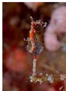
Slika 35. Hippocampus severnsi