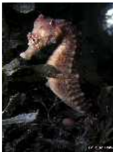
Slika 25. Hippocampus hippocampus