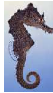
Slika 20. Hippocampus camelopardalis ( http://www.seahorse.org/ )