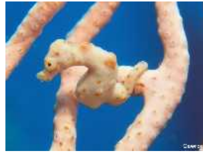
Slika 22. Hippocampus denise