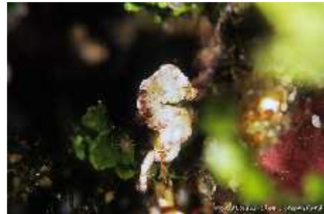
Slika 21. Hippocampus colemani