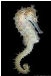
Slika 17. Hippocampus barbouri