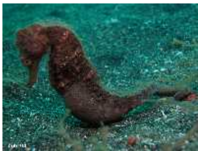
Slika 31. Hippocampus mohnikei