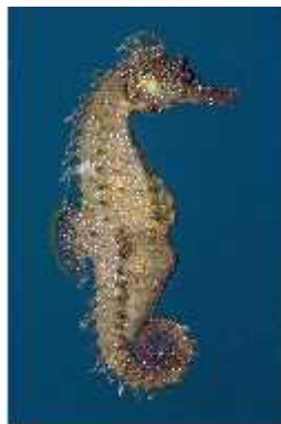
Slika 12. Mužjak Hippocampus guttulatus s trbušnom vrećicom ( http://dalibor-andres.from.hr/ )

Osim svojim posebnim izgledom, ove se životinje istu i često spominju zbog specifičnosti razmnožavanja. Zasadu je jedino kod pripadnika reda Syngnathiformes uočena neobična pojava da su mužjaci ti koji su "trudni" (Sl. 12.), odnosno u njihovim tijelima se oplođuju jajašca i razvijaju mladi morski konjići (Helfman i sur., 1997.). Ženka morskog konjića u posebnog organa u obliku cijevice ispušta od nekoliko desetaka do nekoliko stotina energetski bogatih jajašaca u trbušnu ili leglenu vrećicu mužjaka. Mužjak ih zatim oplođuje svojom spermom i daje polovicu svoje DNA strukture.