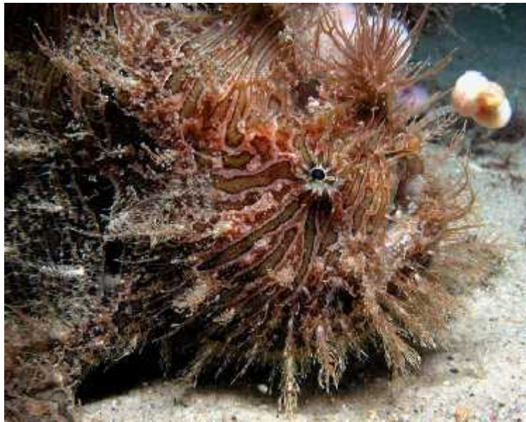
Slika 11. Antennarius striatus , predator morskih konji a

Samo se nekoliko predatora hrani ovim ribama, a to mogu zahvaliti svojoj u inkovitoj kamuflaži i tvrdim koštanim prstenima na tijelu neukusnima za jelo i teško probavljivima. Jedu ih rakovi, velike pelagi ke ribe (rod Thunnus i Coryphaena ) (Sl. 11.), a ubijaju ih i ljudi.