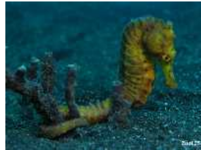
Slika 29. Hippocampus kuda ( http://www.starfish.ch/photos/ )