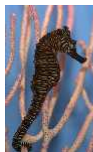
Slika 38. Hippocampus zebra ( http://gallery.seahorse.org/ )