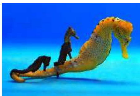
Slika 33. Hippocampus reidi