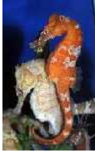
Slika 23. Hippocampus erectus