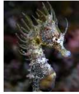
Slika 19. Hippocampus breviceps ( http://www.seahorse.org/ )