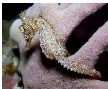
Slika 37. Hippocampus whitei