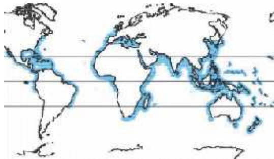
Slika 8. Podru ja rasprostranjenosti morskih konji a

Morski konji i su ribe koje nastanjuju svjetska mora, jedino vrsta Hippocampus capensis živi u estuariju gdje se slatka vodi miješa sa slanom. Ta vrsta može podnijeti promjene saliniteta, ali umire kod ve ih naleta slatke vode. Tako er, neke vrste poput Hippocampus guttulatus zalaze u braki ne (zaslanjene) vode (Jardas, 1996.). Podru ja rasprostranjenosti ovih riba su izme u 50. stupnja sjeverne geografske širine i 50. stupnja južne geografske širine, dakle obuhva a tropska i suptropska mora te mora umjerenog podru ja (Sl. 8.). Najve i broj vrsta na en je u Indopacifi kom podru ju (Indijski ocean, zapadni i središnji Tih ocean te mora koja povezuju regije Indonezije) te zapadnom dijelu Atlantskog oceana. Najviše prona enih vrsta je oko obala Australije, ve i broj vrsta živi u morima jugoisto ne Azije i Japana, za razliku od svega jedne vrste koja je prona ena na zapadnoj obali Sjeverne i Južne Amerike (isto ni Tih ocean).