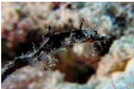
Slika 3. Acentranura dendritica