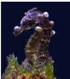
Slika 39. Bakterijska infekcija koja uzrokuje mjehuriće ispunjene plinom ( http://gallery.seahorse.org/ )