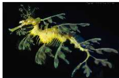
Slika 4. Phycodurus eques