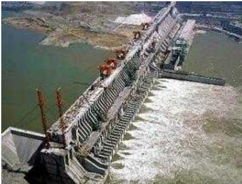
Slika 3. Akumulacijska hidroelektrana "Tri kanjona" u Kini ( http://hr.wikipedia.org/wiki/hidroelektrane )

Kod konvencionalnih hidroelektrana voda iz akumulacijskog jezera protje e kroz postrojenje i nastavlja dalje svojim prirodnim tokom. Akumulacijske hidroelektrane mogu biti pribranske i derivacijske. Pribranske hidroelektrane smještene su ispod same brane, dok su derivacijske smještene puno niže i spojene su cjevovodima s akumulacijom. Akumulacijske hidroelektrane su naj eš e. Njihova dobra strana je mogu nost akumulacije jeftinog izvora energije kad je ima u izobilju i planiranje potrošnje po potrebi. Nedostaci su otežan pogon ili potpuni zastoji ljeti zbog smanjenog protoka. Na slici 3. je prikazana jedna od najve ih akumulacijskih hidroelektrana na svijetu „Tri kanjona“ u Kini.