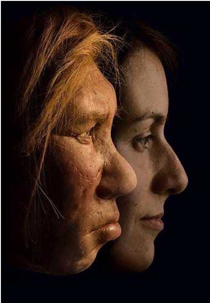
Slika 1. Usporedba neandertalca i modernog ovjeka

hladnijim zimama doveo je do psihi ke i kulturalne adaptacije što je olakšalo njihov opstanak i usmjerilo ih prema modernim vrstama, Homo sapiens ( George D. Brown, 1995)