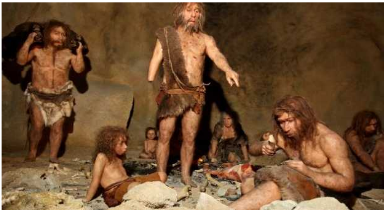
SLIKA 4: Ognjište u špilji, atmosfera života obitelji neandertalaca (Muzej krapinskih neandertalaca)

filogeneti kom položaju, jedni autori smatraju kako neandertalci nisu bili sposobni proizvoditi raspon zvukova potreban za govor modernog ovjeka ili pak sumnjaju u kompleksnost njihova jezika. Neki autori čak predlažu da je evolucijska prednost modernih ljudi nad populacijama neandertalaca dijelom bila u modernom govoru i jeziku te je to dijelom moglo pridonijeti izumiranju neandertalaca (Washburn,1981.). Budu i da anatomskih dokaza za manjak govornih sposobnosti neandertalaca nema, a arheološki se dokazi o razvijenom simbolizmu i naprednijoj tehnologiji i umjetni kom izražaju, koji bi eventualno ukazivali na razlike u kognitivnim sposobnostima ili pak kompleksnosti jezika, javljaju tek mnogo kasnije, unutar razdoblja kasnoga gornjeg paleolitika, ne treba pojavu morfološki modernog ovjeka vezivati uz pojavu kompleksnog jezika. Govorne i jezične sposobnosti razvijaju se tijekom dužeg vremena i predstavljaju dio hominidne prilagodbe u dugom razdoblju evolucijskog razvitka.