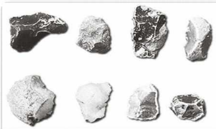
SLIKA 3: Oruđe neandertalaca

Kao vrijeme u kojem žive neandertalci najčešće se navodi raspon od 200.000 do 30.000 godina prije današnjeg doba. Ipak nije moguće odrediti preciznu vremensku granicu, jer se neandertalci razvijaju iz ranijih lokalnih populacija srednjeg pleistocena na tlu Europe, i evolucijski razvoj te i na taj način da se neke morfološke odlike pojavljuju prije od drugih. Zbog toga razni stručnjaci pripisuju neke od ranijih nalaza nekom prijašnjem morfološkom tipu, dok ih drugi prepoznaju kao dio neandertalske populacije. Krapinska kolekcija, je jedan od najranijih nalaza za koje se svi složiti da je dio neandertalske populacije, prije blizu 130.000 godina. Vremenski najmlađe nalaze neandertalaca, predstavljaju fosili nalazišta Zaffaraya u Španjolskoj i pećine Vindije u Hrvatskoj (Smith i sur.,1999), a moguće je i njihovo duže prisustvo na prostoru Kavkaza. Nalazi neandertalaca su na većini nalazišta popraćeni i nalazima kamenog oruđa. Kultura koju najčešće vezemo uz neandertalce jest musterijen, ta kultura po prvi put je prepoznata na tlu Francuske, a karakterizira ju velika zastupljenost raznih strugala, oruđa na odbojcima, te primjena levaolaške metode. Ime je dobila po eponimnom nalazištu Le Moustier u Dordogne. Gabriel de Mortillet je prvi definirao musterijen, te predložio relativno kronološki položaj musterijenskih artefakata.