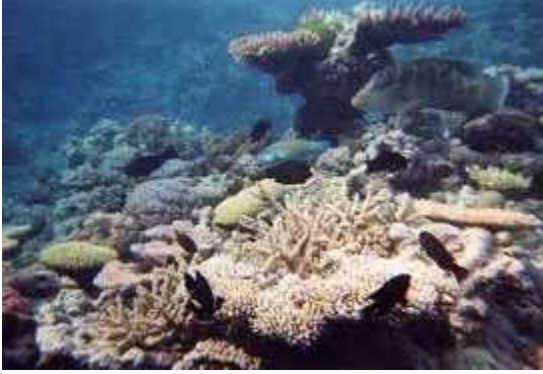
Slika 15. Koralni grebeni zagaženi pesticidima