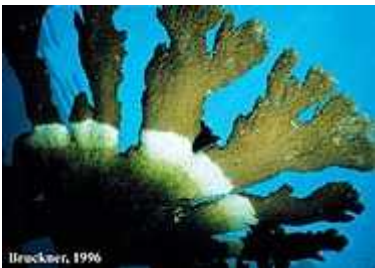
Slika 12. Bolest bijele vrpce