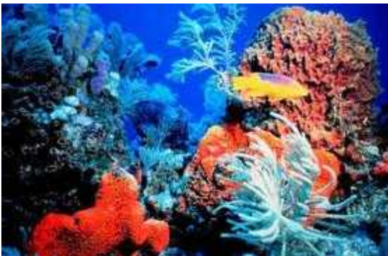
Slika 1. Raznolikost koraljnog grebena

Masivni koralji i inkrustirajuće alge rastu u ovoj zoni snažnih valova, intenzivnog svjetla i bogatog kisikom. Male ribe žive u rupama grebena, dok velike ribe uključujući i morske pse, barakude i tune kruže grebenom u potrazi za hranom.