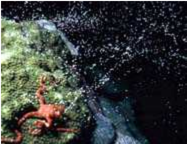
Slika 3. Zvjezdasti koralj Montastraea franksi otpušta muške i ženske gamete

Istraživanja su pokazala da koralji mogu tvoriti hibride. U zapadnoj Australiji i Flower Garden Banks sjeverno od Meksika mriještenje se događa kasno u ljeto ili jesen, te ne mora biti sinkronizirano. U sjevernom Crvenom moru, niti jedna vrsta koralja se ne razmnožava u isto vrijeme.