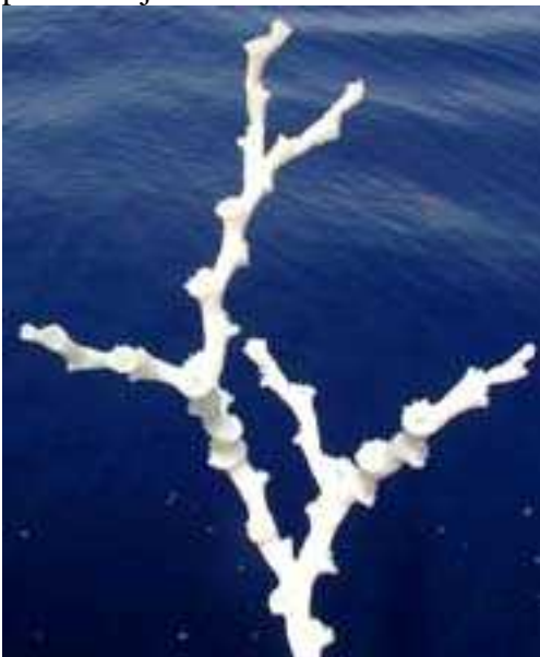
Slika 7. Dio kolonije vrste Lophelia pertusa

Vrhovi brežuljaka prekriveni su vrstom Lophelia pertusa . Svaki brežuljak ima karakteristični element „rep”. Repovi su dugački nekoliko metara, svi su orijentirani prema dolje.