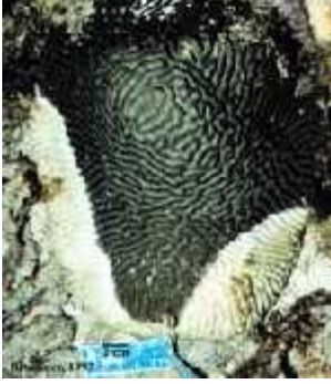
Slika 13. Bijela kuga