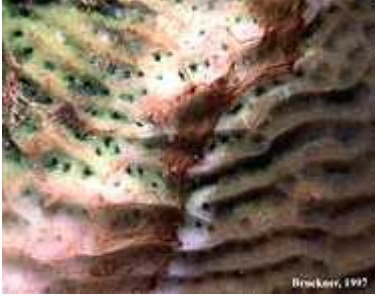
Slika 11. Bolest crvene vrpce