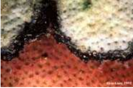
Slika 9. Bolest crne vrpce