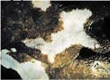
Slika 14. Bijele boginje

Bijele boginje pogađaju koralje u obliku jelenskog roga na Floridi i u Karibima. Prvi puta su nađeni 1996. godine, bolest se otkriva kao bijele okrugle lezije na površini inficiranih koralja. Stopa smrtnosti inficiranih tkiva koralja je velika. Uzročnik bijelih boginja se ne zna, ali se smatra da je neka patogena bakterija.