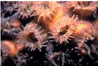
Slika 5. Polipi koralji sa ispruženim lovkama