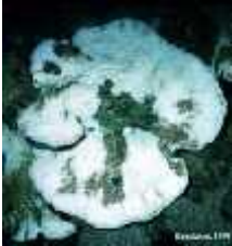
Slika 10. Koraljno izbjeljivanje

Posljedice uinka izbjeljivanja na koralje su smanjen rast i reproduktivna aktivnost, te smanjena sposobnost otpora invaziji kompetitora i bolesti. Na kraju može dovesti do smrti kolonije, ako izbjeljivanje nije prejako, oštećene kolonije mogu ponovo pridobiti svoje simbiotske alge, tj. zooksantele .