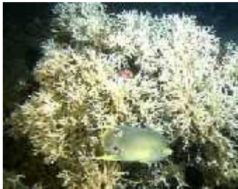
Slika 8. Oculina varicosa

Kao i vrsta Lophelia , Oculina je doma in mnogim ribama i beskralješnjacima. One su zna ajno mjesto za mriještenje mnogih riba kao što su škampi, škarpina, crni brancini.