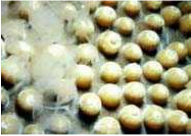
Slika 2. Muški zvjezdasti koralj Montastraea cavernosa ispušta muške gamete