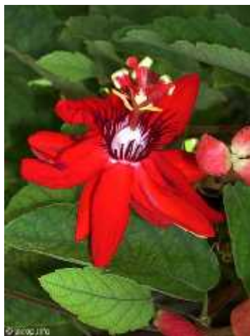
Slika 8. Passiflora coccinea

Leal 2001.). Zbog boje cvjetova ova se vrsta često zamjenjuje vrstom P. vitifolia . Uz još jednu vrstu, jedina je koja ima plodove crvene boje (Horvatović i sur. 2007).