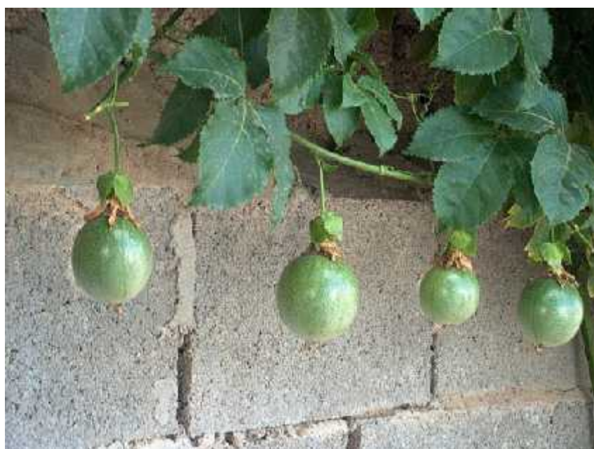
Slika 10. nedozreo plod slatke granadille

Poznata i kao "še erna" granadilla u zemljama španjolskog govornog područja, ova se vrsta koristi i umjesto šeera ili meda u pripremanju slastica. Najviše se uzgaja na plantažama u Australiji, Južnoj Americi te u tropskim planinama Afrike. Pogoduje joj visoka nadmorska visina; 1700 – 2600 m i temperature između 15 - 18°C. Najveći uvoznici ovog aromatičnog voća su Belgija, Nizozemska, Švicarska, Španjolska, SAD i Kanada. Popularnosti ploda doprinijela je činjenica da sadrži vitamine A i C te kalij, fosfor, željezo i kalcij u velikim količinama ( http://en.wikipedia.org/wiki/Passiflora_ligularis ). Cvijet je nježno ljubičaste boje sa ljubičastom koronom, dok su plodovi jarko do blago narančasti (Slika 10.).