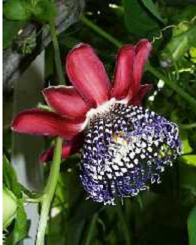
Slika 5. cvijet goleme pasiflore

( http://www.exotischezaden.nl/exotische_zaden/images/Passiflora-quadrangularis.jpg )