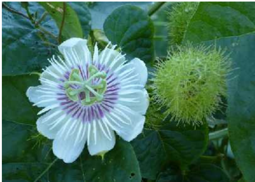
Slika 11. Passiflora foetida , cvijet i ljepljive dlake

korovom. Plod je slatkast, žuto-naranaste boje dok su sjemenke crne boje poredane u sredini ploda. Ptice jedu otpale plodove i time rasprostranjuju biljku ( http://en.wikipedia.org/wiki/Passiflora_foetida ).