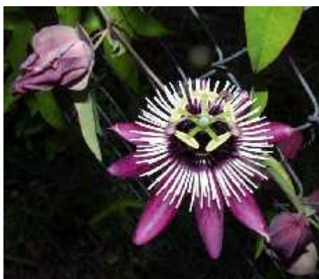
Slika 9. Passiflora x violacea

Passiflora x violacea je ljubiasto-bijele boje te naraste do 3 metra u visinu (Slika 9.). Krošnja joj je široka i do 1,5 metara. Osjetljiva je na niske temperature (do -5^{\circ}\text{C} ) i nametnike (Gomaz 2008). Ova je vrsta jedna od najstarijih i danas najpoznatijih hibrida, križanac vrsta P. caerulea i P. racemosa . Plodovi su vrlo su mali i šuplji, bez soka, a katkad ih uopće nema ( http://coolexotics.com/plant-461-passiflora-x-violacea.html ).