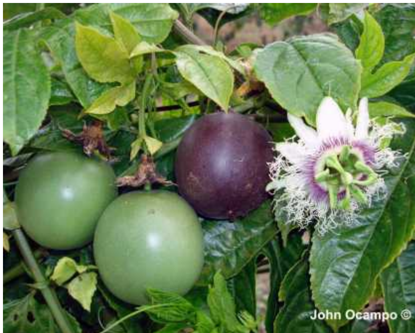
Slika 2. Ljubičasti plodovi vrste Passiflora edulis

Ova vrsta se zbog svojih velikih i jestivih plodova uzgaja na velikim plantažama Indije, Šri Lanke, Novog Zelanda, na Karibima i Haitiju, u Brazilu, Kolumbiji, Ekvadoru, Indoneziji, Peruu, Australiji, Izraelu, južnim dijelovima SAD-a i južnoj Africi. Plodovi se koriste za jelo ili se njegovi sokovi dodaju brojnim voćnim sokovima za pojačanje arome. Postoje dvije vrste plodova koji se intenzivno uzgajaju – žuti i ljubičasti (Slika 2.). U dijelovima središnje i Južne Amerike domoroci motaju osušene listove ove vrste u cigarete ( http://en.wikipedia.org/wiki/Passiflora_edulis ).