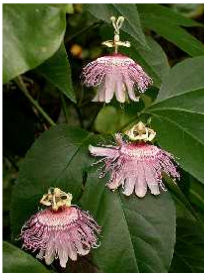
Slika 4. Passiflora incarnata