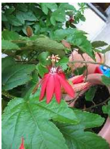
Slika 7. Passiflora vitifolia

Crveni cvjetovi ove vrste, kratkih crveno-žutih korona cvatu od ranog ljeta do jeseni (Slika 7.). Stabljike su joj nježne i prekrivene sme im dlačicama, a listovi trorežnjasti i blistavi. Iako je jedna od najbujnijih i najdulje cvatu ih pasiflora, Passiflora vitifolia ne podnosi niske temperature i mraz. (Gomaz 2007.) Najdraža je hrana raznovrsnim gusjenicama iz roda Heliconius . U borbi protiv gusjenica ovoj vrsti pomažu i simbiotski mravi koji fizički odstranjuju gusjenice sa listova i stabljika (Smiley 1986.).