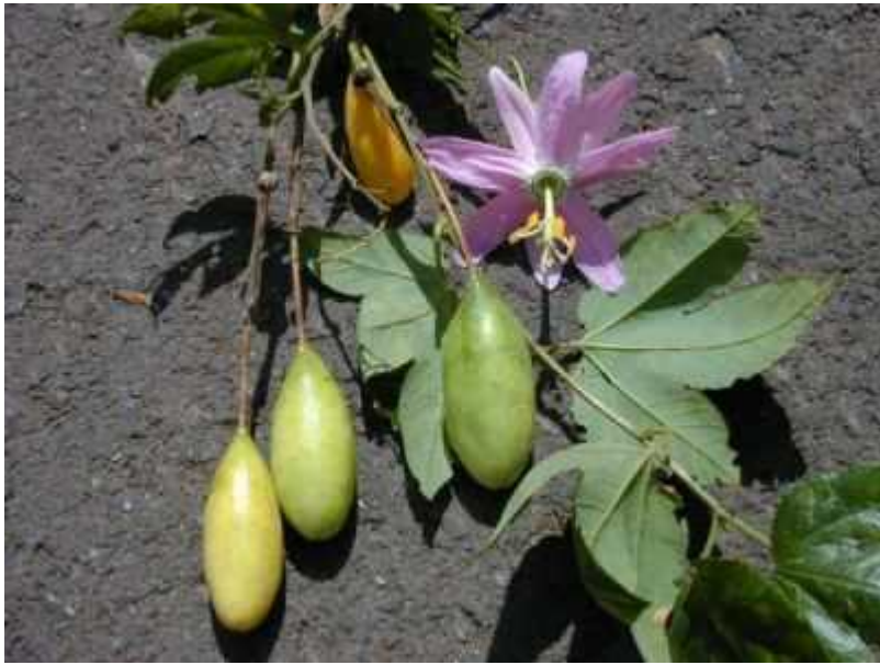
Slika 12. Passiflora tarminiana , plod i cvijet