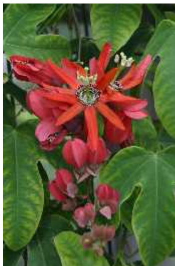
Slika 6. grozdasti cvjetovi vrste Passiflora racemosa

Ova vrsta, zagasito crvene boje cvjetova, osjetljiva je na niske temperature i podložna napadu nametnika kao što je crveni pauk te virusnim bolestima (Slika 6.). Njeni listovi su trorežnjasti, valoviti i kožasti. Grozdasta pasiflora može narasti do 4,5 metara te je za nju potreban stabilan i trajan potporanj (Horvatovi i sur. 2008.). U odre enim uvjetima ova se vrsta može uzgajati i kao sobna biljka, ali joj je potrebna velika vlažnost zraka i redovito podrezivanje. Dobro uspijeva na dreniranom tlu s podjednakim udjelom pijeska, šljunka, treseta i ilova e. Passiflora racemosa se uzgaja radi cvjetova jer su plodovi mali i nejestivi ( http://www.floridata.com/ref/p/pass_rac.cfm ).