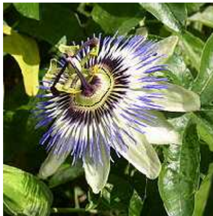
Slika 3. Passiflora caerulea

1975.). Cvjetovi ove vrste su bijeli, ponekad ruži asto prelivekih sa plavom koronom (Slika 3.). Njeni listovi sadrže spoj zvan cijanogenetski glikozid koji je vrlo otrovan te se zbog toga ne koriste za pravljenje ljekovitih pripravaka. Za ljekovite pripravke umjesto listova koriste se vrlo mirisni cvjetovi. Modra pasiflora je esto korištena za stvaranje novih kultivara, i križana uglavnom sa vrstom P. alata Curtis. Njeni plodovi su mali, i jako kiseli pa se naj eš e ne koriste u prehrani. Ova vrsta potje e iz Argentine i Brazila gdje ju nazivaju pasionaria ili mburucuyá ( http://en.wikipedia.org/wiki/Passiflora_caerulea ).