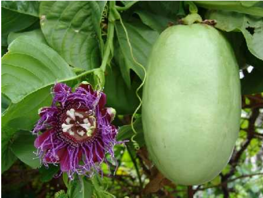
Slika 13. usporedba cvijeta i ploda ( P. edulis Sims)

( http://caribfruits.cirad.fr/var/caribfruits/storage/images/production_fruitiere_integree/conduite_de_son_verger/les_cultures/maracuja/4005-18-fre-FR/maracuja.jpg )