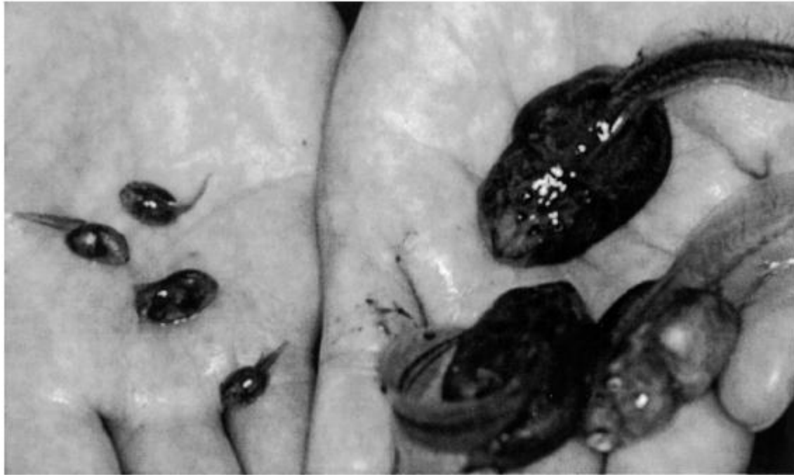
Slika 1 S. multiplicata omnivori (lijevo) i karnivori (desno) iste starosti i lokve

Promjene ponašanja odnose se na drukčije ponašanje prilikom odabira partnera ili čuvanja teritorija. Kod žaba roda Spea vidjeli smo kako se ženjkama mijenjaju kriteriji za mužjake, a kod daždevnjaka otkrivena je povezanost povećanja agresivnosti (u simpatriji) sa značajnim morfološkim promjenama. Čim se eliminirala mogućnost kompeticije oko hrane kao uzrok CDA, sam eksperiment bio je vrlo elegantan. Uspoređivala se kranijalna morfologija južno apalčkih daždevnjaka ( Plethodon teyahalee ) i jordanovih daždevnjaka ( P. jordani ) u simpatriji i alopatriji (sl. 2). Statističkim testovima napravljeni su grafički prikazi gdje se vidi kako skoro nema morfoloških razlika u alopatriji, dok u simpatriji obje vrste pokazuju značajne promjene, ali je kod P. teyahalee dodatno izdužena i ojačana čeljust. To je i logično, pošto je ta vrsta po prirodi agresivnija, a griženje je glavni način obrane ovih guštera.