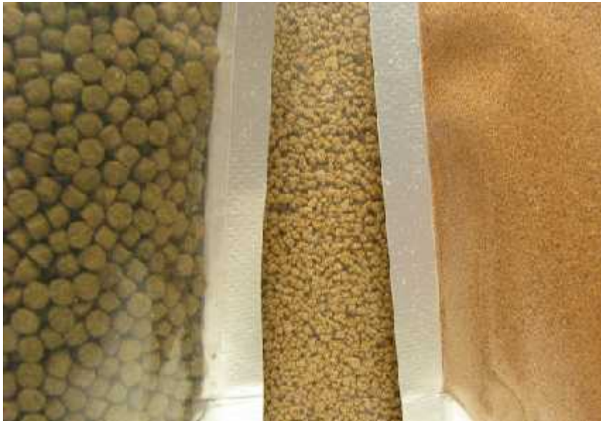
Slika 4. Granulirana hrana koja se koristi u kaveznom uzgoju

Vrlo je bitno da unos organskih tvari ne prelazi mogu nosti prihvatnog kapaciteta ekosustava. U suprotnom, nataložena organska tvar može uzrokovati razvoj heterotrofnih bakterija koje e smanjiti prodiranje kisika u sediment, što u kona nici može dovesti do stvaranja anaerobnih uvjeta i produkcije opasnog H 2 S i CH 3 . Organsko optere enje može se smanjiti boljom formulacijom i tehnologijom proizvodnje hrane – tzv. Ekstrudirana hrana ( visokoenergetska i lako probavljiva).