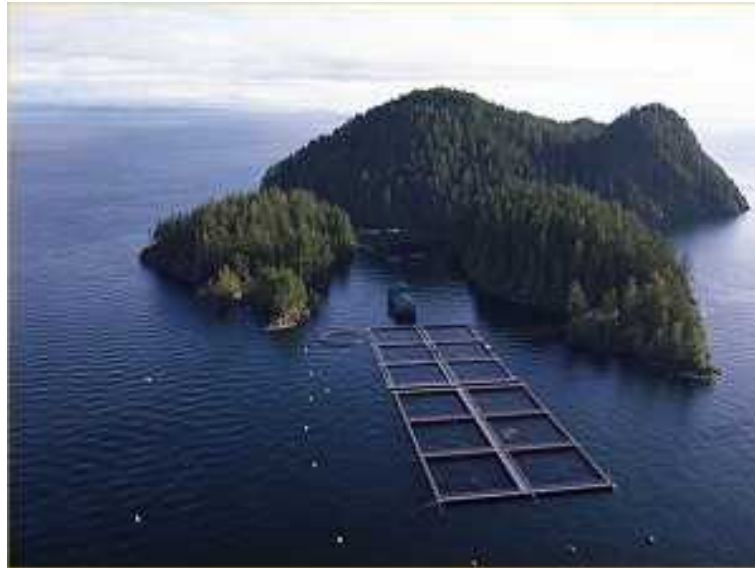
Slika 1. Prikaz kaveza za uzgoj ribe uz obalu

Marikultura se unutar akvakulture može definirati kao gospodarska djelatnost kontrolirane reprodukcije, uzgajanja riba i drugih morskih organizama ( NN 5/1997 ).