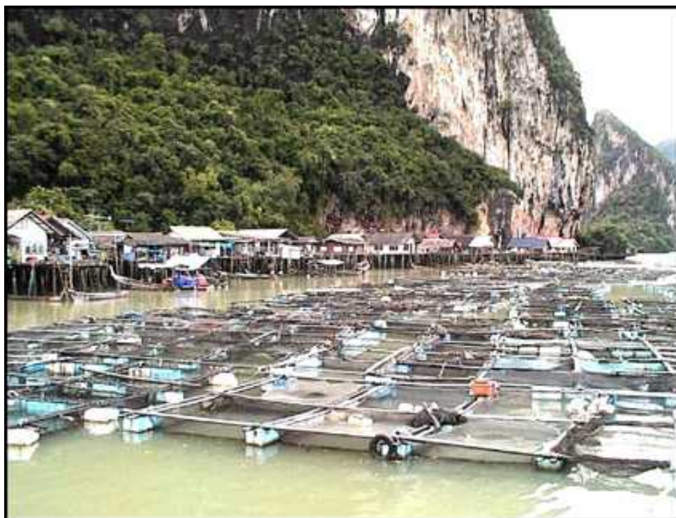
Slika 3. Neadekvatan smještaj kaveza