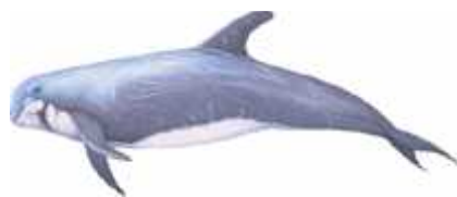
Slika 9. Glavati dupin ( Grampus griseus ) ( www.cwtstrandings.org )

Glavati dupin ( Grampus griseus , engl. Risso's dolphin) kreće se u skupinama od 10-15 životinja, koje se mogu spajati i s drugim jatima, no u Jadransko more zaluta često samo pojedinačna jedinka ili manja skupina. Inače se često kreće uz neke druge vrste kitova, a uoči je čak i križanje s dobrim dupinima. Lako ga je prepoznati po velikim (dug je do 3,8 metara), zatim po neobičnoj tupastoj glavi bez kljuna, naboru na sredini melona, visokoj leđnoj i srpolikim prsnim perajama, te jednoličnoj sivoj boji s bijelim ožiljcima, koji se s godinama nakupljaju, pa su tako jedinke starije od 30 godina sasvim bijele (Gomer i sur. 2006).