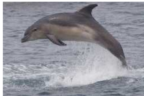
Slika 8. Dobri dupin