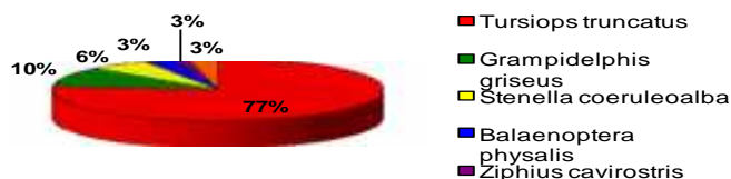
Grafikon 1. Vrste na ene u Jadranskom moru 2001./ 2002. godine

Osim procjenjivanja veličine i rasprostranjenosti populacije dobrog dupina u zadnjih dvadesetak godina istraživačkim brodicama, istraživanje se provelo i u dva navrata iz 4 mala aviona, kada je bio bilježen njihov položaj i broj. Velika populacija dobrog dupina, kao jedinog stalnog stanovnika Jadrana, procijenjena je na 250 jedinki rasprostranjenih po cijelom Jadranu. Prema istraživanjima u posljednjih desetak godina, ova se populacija s obzirom na prisutni broj životinja smatra stalnom (Gomer i sur. 1998).