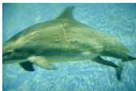
Slika 4. Rađanje dupina

Najvažnija majčinska zadaća je pronalaženje hrane. Mladunci ovise o majkama oko 3-6 godina, te u tom razdoblju učine samostalno brinuti o sebi ( www.bio.davidson.edu ). Isprva učine isključivo oponašanjem majki. Dupini se razvijaju sa sposobnošću škljocanja i slikih zvukova u službi komunikacije, pa onaj dio eholokacije namijenjen za lakši pronalazak hrane i lakšu egzistenciju te snalaženje u prostoru trebaju tek naučiti. Za to su im potrebni mjeseci. Loviti učine kroz igru. Često se događa da mladunci odlutaju od majke i do 800 metara, što za njih može biti kobno, no i to je važan dio učenja. Smrtnost mladih dupina vrlo je velika.