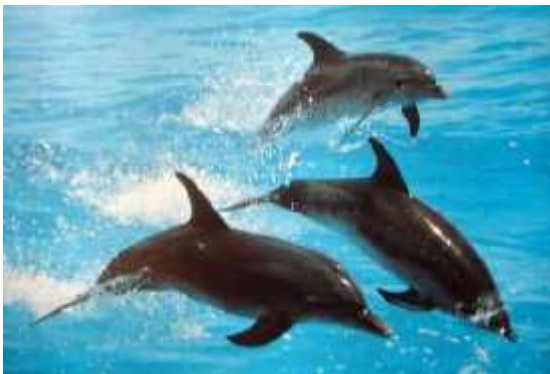
Slika 5. Skupina dupina u igri

ekstremno glasni. Neki Odontoceti mogu proizvesti kliktaje i do 163 dB koji se mogu čuti kilometrima daleko. Dupini su veoma inteligentni i društveni, pa se ponašaju na razne načine. Prilagođavaju se različitim uvjetima u vodi, pa tako npr. mogu vrlo vješto plivati i u 10 cm dubine. Eholokacija im je glavni oslonac noću, ali noću mogu identificirati tijela na udaljenosti od samo stotinjak metara i ne mogu dobiti informacije o području iza njih jer je veoma usmjerena. Sonar može izdati njihov položaj i grabežljivcima, pa se zato više uzdaju u sluh. Najbolja obrana je držanje na okupu i osluškivanje, dok se sami trude biti što tiši. Dupini su, također, međusobno veoma usklađeni što se na primjer može vidjeti u skladnom kretanju grupe jedinki (sl. 5 i 6), a osim zvižduka i ciktaja, komuniciraju i dodirima ( www.sarasotadolphin.org ). Među njima su i sukobi i svađanja. Dobri dupini zapravo pokazuju najveću dozu agresivnosti u ponašanju u usporedbi s ostalim kitovima.