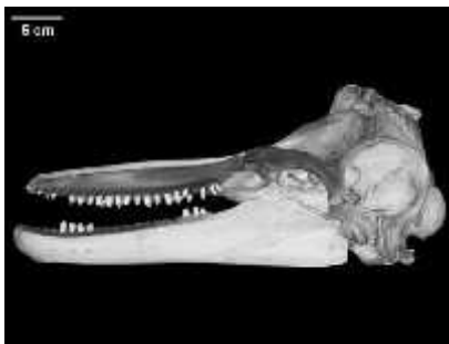
Slika 7. Kostur lubanje dobrog dupina

Dobri dupin ( Tursiops truncatus (Montague 1894.)) živi u europskim morima i to uz rije na uš a gdje se hrani ribama i brzo pliva, te pari od prolje a do ljeta i nosi mlado 10-12 mjeseci da bi se kotilo u lipnju ili srpnju. Mlado siše mlijeko 16 mjeseci, a samostalno je tek nakon godine i šest mjeseci i spolno zrelo sa 6 godina. Gornja im je eljust kra a od donje, a u svakoj imaju 18-27 pari zuba (sl. 7). Boja hidrodinami ki oblikovanog tijela može varirati od tamno plave do sivo-sme e na le ima, preko svijetlo sive na bokovima i bijele na truhu, do ruži aste nijanse koju može poprimiti pri visokoj temperaturi tokom ljeta (sl. 8). Odrasle jedinke dosežu dužinu od 2 do 4 metra (u Jadraniu najviše oko 3 metra) i težinu 100 do 500 kilograma. Njihova populacija u hrvatskom dijelu Jadranskog mora procjenjuje se na 220-250 jedinki (Gomer i i sur. 2002, Gomer i i sur. 2004). Ova vrsta živi u gotovo svim morima svijeta, no ne postoji potpuna procjena broja jedinki u svijetu. Za populacije u Sredozemnom moru smatra se da broje manje od 10 000 jedinki, a sve to zbog prelova ribe i uništavanja staništa ( uras 2006, Galov 2007).