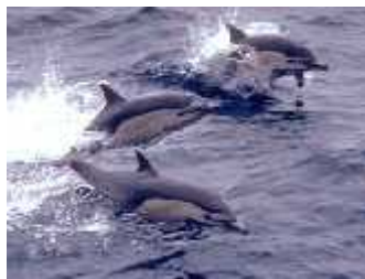
Slika 10. Manja skupina običnih dupina