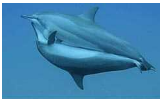
Slika 3. Parenje jednog para dupina

Parenje kitova se kod većine odvija tako da mužjak usklađenim pokretima pliva na leđima, a ženka iznad njega (vidi Slika 3.). Kao kod svih sisavaca, oplodnja je unutarnja i zametak se razvija dijeljenjem zigote. Preko posteljice se zametak prehranjuje i vrši se izmjena plinova. Ženke imaju jedan par sisa smještenih sa svake strane spolnog otvora koje uštrcavaju mlijeko u usnu šupljinu mladog. To je neobično važno jer mladunad nema mekih mišićavih usana kojima bi se mogli vrsto uhvatiti za sisu, pa ju mogu uhvatiti ustima samo na kratko vrijeme. Ženka okoti (vidi Slika 4.) obično jedno mladunče nakon oko godine dana skotnosti (varira među vrstama). Nakon okota ženka se ne tjera tijekom nekoliko prvih mladunčevih godina, te odbijati svaki pokušaj mužjakova snubljenja.