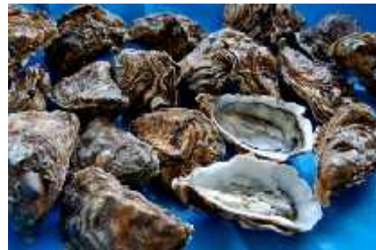
Slika 10. Cassostrea gigas