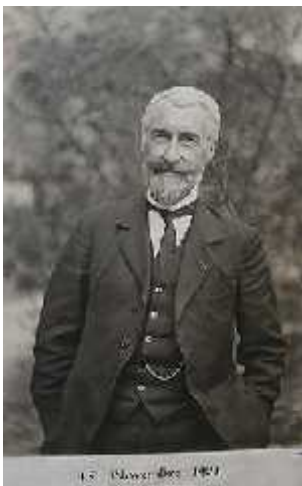
Slika 1. Lucien Cuénot

Još davne 1905. godine Lucien Cuénot (Slika 1.), francuski biolog, primijetio je neuobičajene rezultate u genetici miša: kada su dva žuta miša križana, potomci nikada ne pokazuju normalni omjer fenotipova 3:1. Umjesto toga, Cuénot je uvijek primjećivao omjer 2:1, odnosno uvijek je nakon križanja dva žuta miša u potomstvu dobivao dva žuta i jednog sivog miša (Slika 2.). On je tada odredio da je žuta boja krzna dominantna fenotipska osobina i korištenjem testova križanja pokazao da su svi žuti miševi heterozigoti. No nikada nije uspio dobiti homozigotnog žutog miša.