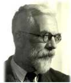
Slika 16. Ronald Aylmer Fisher

Kasnije je engleski biolog Ronald Aylmer Fisher (Slika 16.) istražio vjerojatnost akumulacije letalnih gena na Y kromosomu u velikim populacijama vinske mušice ( Drosophila spp. ) i pokazao da je ta vjerojatnost vrlo mala. Time je odbacio Mullerovu hipotezu. Kasnije (1968.) su Oswaldo Frota Pessoa, brazilski biolog, i Lydia Rosenberg Aratangy proučavali ravnotežnu uestalost letalnih gena na Y kromosomu i uvidjeli da je ona vrlo poveana pri parenju blisko srodnih jedinki kao posljedica uzastopnog sparivanja. No nisu pokazali da na Y kromosomu može stvarno doći do fiksacije letalnih gena (Nei, 1970).