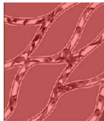
Slika 8. Srpasti eritrociti

Geni koji uzrokuju smrt pod određenim uvjetima zovu se uvjetno letalni geni. Favizam je spolno vezano nasljedno svojstvo uzrokovano takvim genima, a koje rezultira nedostatkom enzima glukoza-6-fosfat dehidrogenaze. Najčešće se pojavljuje među ljudima Mediterana, Afrike, Južne Azije i potomaka sefardskih Židova. Bolest je nazvana favizam zbog toga što se srpasta anemija, stanje u kojem crvene krvne stanice propadaju i blokiraju krvne žile (Slika 8.), razvija nakon što osoba, nositelj ovog gena, jede bob ( Vicia faba L.). Blokiranje krvnih žila uslijed stvaranja ugrušaka može uzrokovati prestanak rada bubrega i rezultirati smrću. Interesantno je da su osobe nositelji alela za favizam rezistentne na malariju zato što je parazitima koji ju uzrokuju teže razmnožavati se u stanicama sa smanjenom količinom glukoza-6-fosfat dehidrogenaze. Uvjetno letalni geni mogu također pokazati letalnost u inak u određenim promijenjenim uvjetima. Primjerice, mutirani protein može biti genetički promijenjen da bude potpuno funkcionalan pri 30°C i potpuno nefunkcionalan pri 37°C.