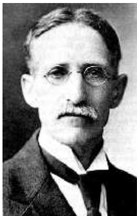
Slika 5. William Ernest Castle

Ubrzo nakon tih otkrića, 1910. godine, američki genetičari William Ernest Castle (Slika 5.) i Clarence Cook Little (Slika 6.) potvrdili su Cuénotove neuobičajene segregacijske omjere. Štoviše, dokazali su da su ne-Mendelovi omjeri Cuénotovih križanja rezultat uinka letalnog gena kojeg je ovaj istraživač u tim križanjima otkrio. Castle i Little uspjeli su to dokazati pokazavši da ¼ potomaka iz križanja heterozigota umire tijekom embrionalnog razvoja. Zbog toga Cuénot nikada nije mogao dobiti homozigotne žute miševе. Nadalje, utvrdivši embrionalnu letalnost, ili smrt kao novu fenotipsku klasu, klasični Mendelov omjer genotipova 1:2:1 se tada promijenio. Ovim primjerima je pokazano da letalni geni uzrokuju smrt organizma koji ih nosi ( http://www.nature.com/scitable/topicpage/mendelian-ratios-and-lethal-genes-557 ).