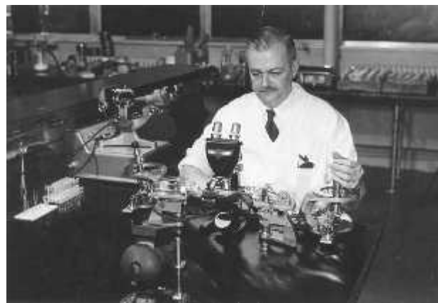
Slika 6. Clarence Cook Little