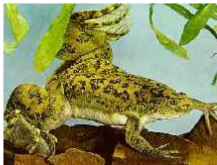
Slika 14. Xenopus laevis D.

Križani su divlji tipovi roditelja, te je nadalje križano i njihovo potomstvo. U 25% križanja recesivni letalni aleli bi se razotkrili kao morfološki mutanti u o ekivanom Mendelovom omjeru. Broj recesivnih letalnih alela u obje vrste ( R = 1.87 za L. goodei i R = 1.43 za D. rerio ) je potpuno jednak onom u Xenopus laevis D. (Slika 14.), koji iznosi 1,875, te je otprilike sredina vrijednosti za vinske mušice ( R = 0,5-3 ). Ta sli nost vinske mušice i kralježnjaka je iznena uju a, pošto je genom vinske mušice puno manji i ima manje gena nego kralježnjaci (Halligan i Keightley, 2003).