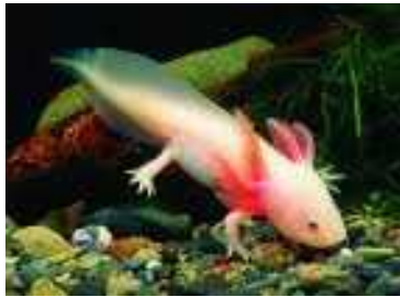
Slika 9. Ambystoma mexicanum

velik broj potomaka, te tako omogu avaju testiranje o ekivanih Mendelovih omjera, pa se i potomstvo koje se ne uspije razviti lako može izbrojati. Teoretska vrijednost R=1,6 odre ena je za vrstu Ambystoma mexicanum (Slika 9.), iako nije bilo mogu e potvrditi tu vrijednost iz originalnih dokumenata. Visoka vrijednost R je utvr ena i za Cassostrea gigas (Slika 10.), iako je bilo predloženo da je odmak od Mendelovih omjera mogu i zbog nekih drugih faktora osim letalnih alela prisutnih u genomu te vrste (Halligan i Keightley, 2003).