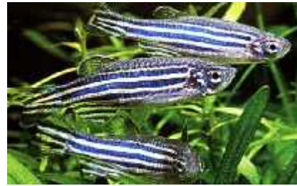
Slika 13. Danio rerio H.