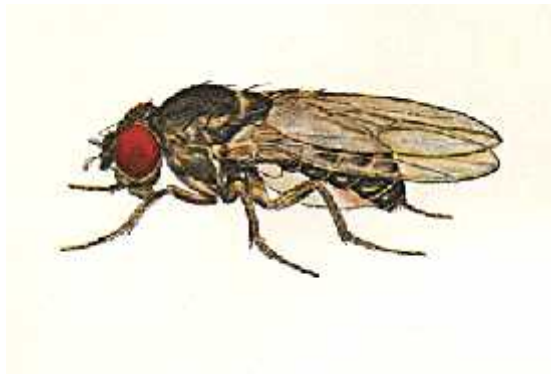
Slika 7. Drosophila pseudoobscura M.

Ruski biolog Nikolay Petrovich Dubinin (1900.-1975.) kasnije je otkrio da prirodne populacije vinske mušice ( Drosophila spp. ) sadrže ogroman broj autosomalnih letalnih heterozigotnih alela. To su potvrdili i Dobzhansky, Queal, Berg, Olenov, Muretov, Mazing, Gershenson i mnogi drugi istraživači. Američki zoolog Theodosius Dobzhansky istraživao je vijabilnost letalnih alela u heterozigota vrste Drosophila pseudoobscura M. (Slika 7.) i uočio mogućnost slabog dominantnog efekta letalnih alela. Potvrdio je da heterozigoti preživljavaju unatoč prisutnosti tih alela u genotipu, no nije u potpunosti isključio mogućnost da je razlika u koncentraciji letalnih alela u populacijama iste vrste koje obitavaju različite dijelove svijeta zapravo posljedica selekcije heterozigota za te alele (Dubinin, 1945).