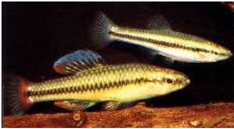
Slika 12. Lucania goodei G.

Recentno istraživanje dovelo je do neo ekivano malog broja letalnih alela u populacijama dviju vrsta riba ( Lucania goodei G. i Danio rerio H., Slika 12. i Slika 13.). Pretpostavlja se da potomstvo nastalo križanjima izme u srodnih jedinki ima o ekivano manje vijabilnog potomstva nego ono nastalo križanjem nesrodnih jedinki, ako srodne jedinke dijele recesivne letalne alele (Halligan i Keightley, 2003).