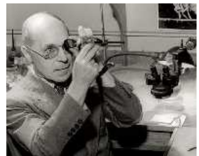
Slika 15. Hermann Joseph Muller

Ameri ki geneti ar Hermann Joseph Muller (1890.–1967., Slika 15.) prvi je na vinskoj mušici ( Drosophila spp. ) pokušao objasniti inaktivaciju Y kromosoma uzrokovanu letalnim alelima. Tvrdio je da su genski lokusi na Y kromosomu uvijek heterozigotni, pa bilo koja letalna mutacija koja se javlja na tim lokusima može biti prigušena divljim tipom alela na homolognom lokusu X kromosoma. Letalne mutacije na X kromosomu su eliminirane u homogametskom spolu. Tako er je mislio da akumulacija letalnih gena može nastati samo na Y kromosomu (Nei, 1970).