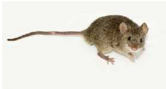
Slika 11. Mus musculus L.

Letalni aleli identificirani u različitim populacijama kućnog miša (Slika 11.) se mogu podijeliti u dvije osnovne grupe između kojih nisu otkrivene nikakve razlike na temelju genetičkih ili embrionalnih kriterija.