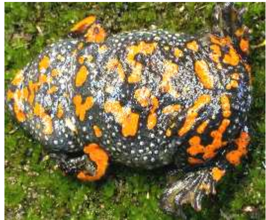
Slika 1.) Bombina orientalis – crveni muka (dorsalna i ventralna strana)