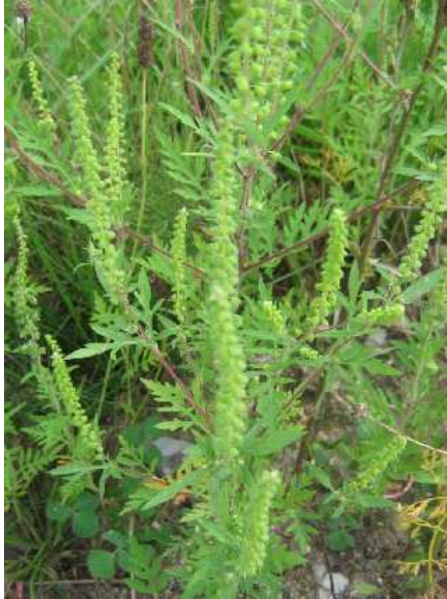
Slika 5. Ambrosia artemisiifolia L. – cvat