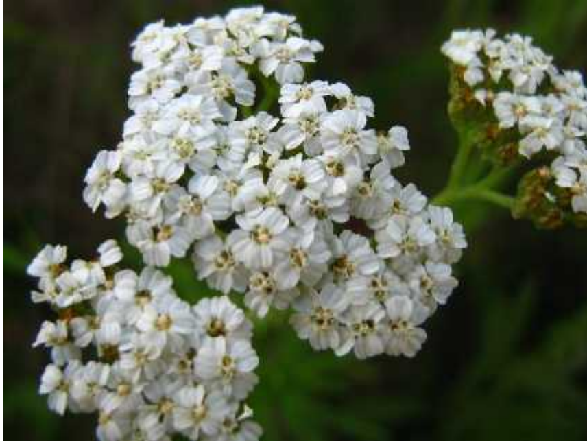
Slika 3. Achillea millefolium L. – cvat gronja