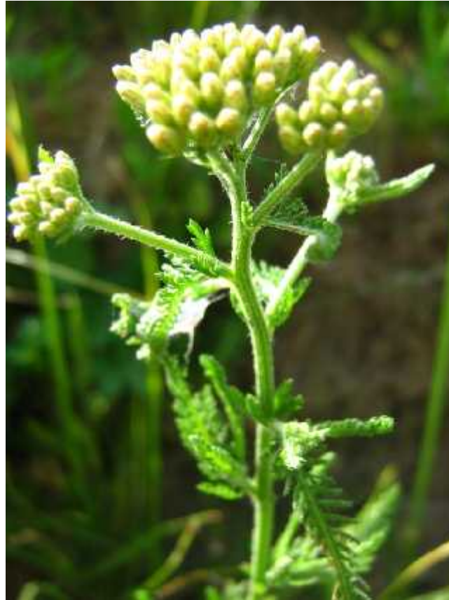
Slika 2. Achillea millefolium L. – habitus

(protuupalno), koleretično (za stvaranje žuči) i antimikrobno djelovanje. Kao lijek za unutarnju primjenu koristi se kod pomanjkanja tekućine i dispeptičnih (probavnih) tegoba. Za vanjsku primjenu koristi se kod upala kože i sluznice te kao lijek za rane. Kod nekih ljudi može izazvati alergijske reakcije (stolisnikov dermatitis) (Schaffner, 2004).