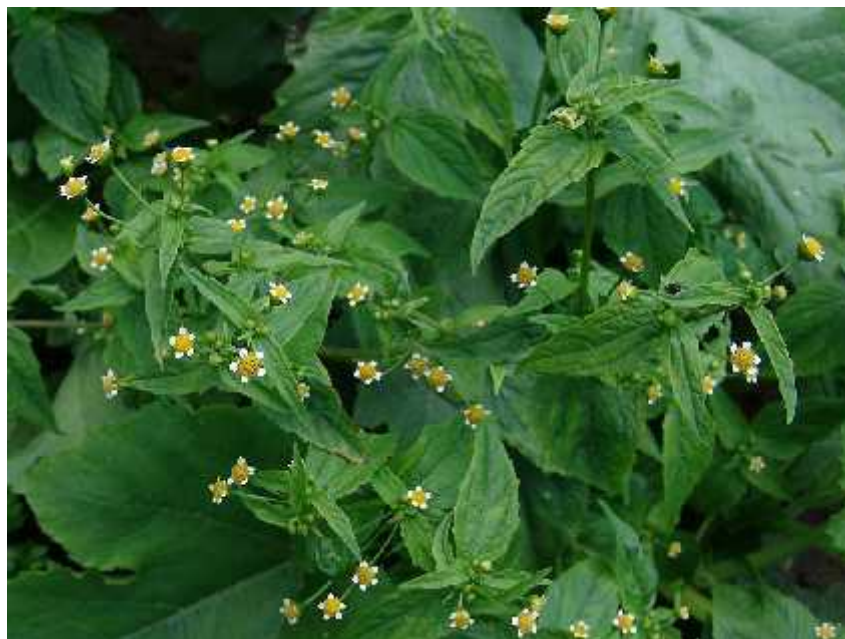
Slika 9. Galinsoga parviflora Cav. – habitus