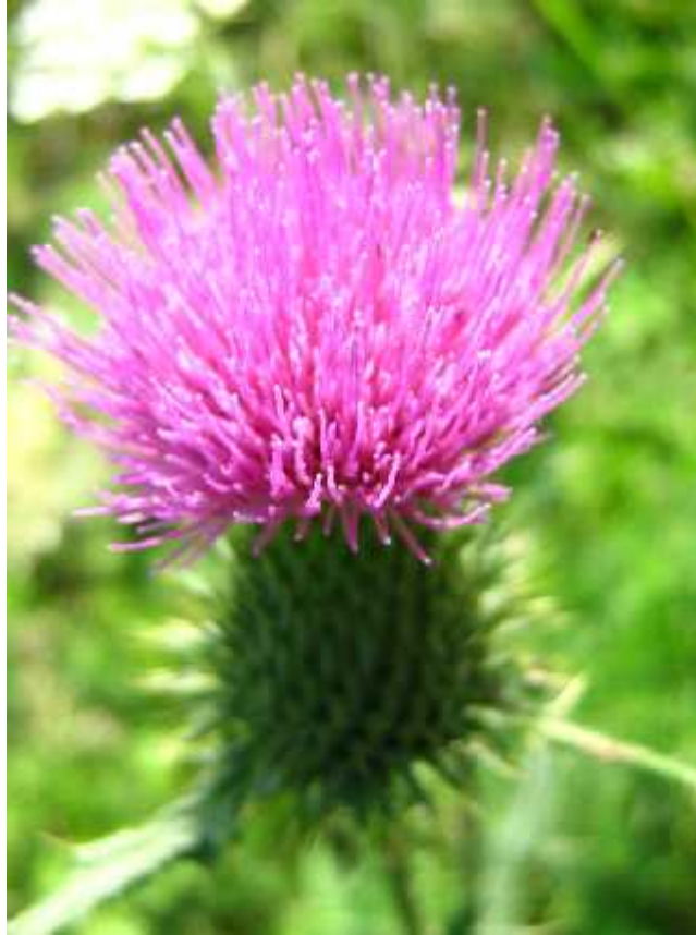
Slika 7. Cirsium arvense (L.) Scop. – glavi asti cvat