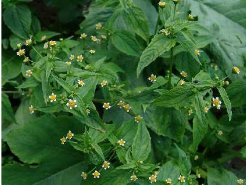
Slika 9. Galinsoga parviflora Cav. – habitus