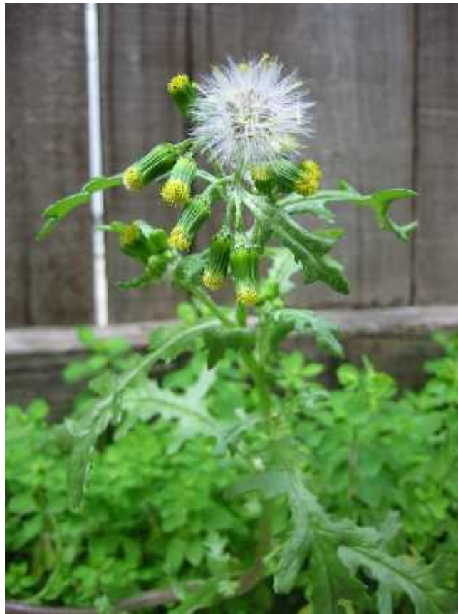
Slika 11. Senecio vulgaris L. – habitus

Jedna od zanimljivosti ove vrste je velika otpornost na ionizirajuće zračenje. Naime, od svih istraživanih vaskularnih biljaka staračica može preživjeti djelovanje ionizirajućeg zračenja koje je veće od 2,58 C/kg u jednom danu (Hulina 1998).