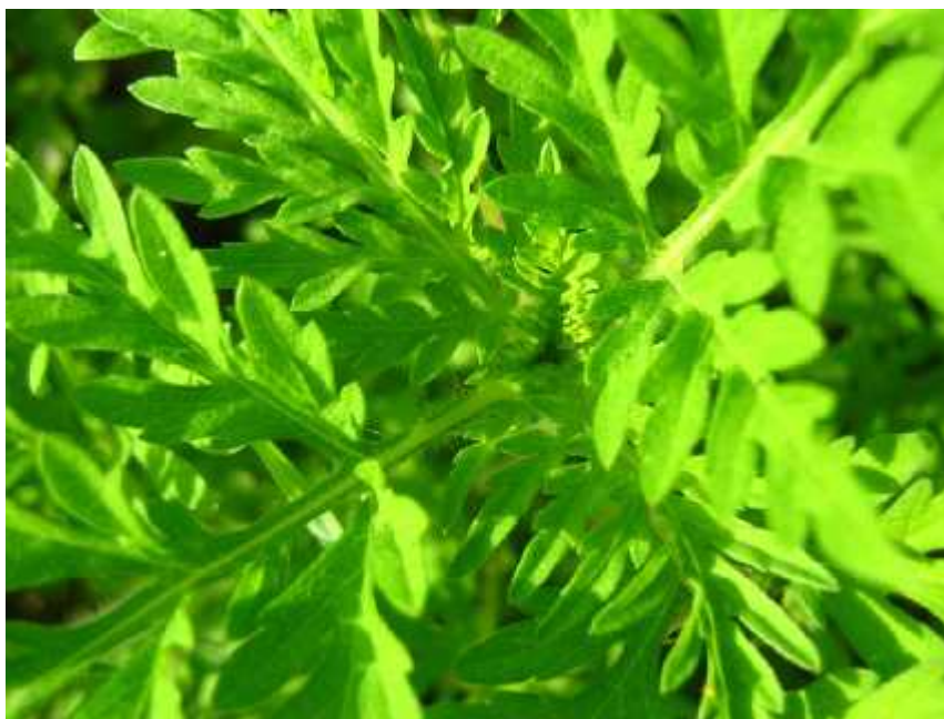
Slika 4. Ambrosia artemisiifolia L. – mlada biljka

Ambrozija se u Posavini na mnogim mjestima pojavila tek nakon Drugog svjetskog rata, te je u tom kraju dobila ime „partizanka“. Osim ve navedenih jakih alergijskih reakcija koje izaziva kod ljudi, ova biljka tako er ima i neka ljekovita svojstva. Infuzom (uvarkom) liš a lije e se oboljenja vlasišta, dok se topli oblozi koriste za inficirane rane i upale o iju. Zanimljivo je da su limundžik koristili i sjevernoameri ki Indijanci tako što su obloge od izgnje enog liš a stavljali na inficirana mjesta ili nakon uboda insekta ( ernicki, 2006).