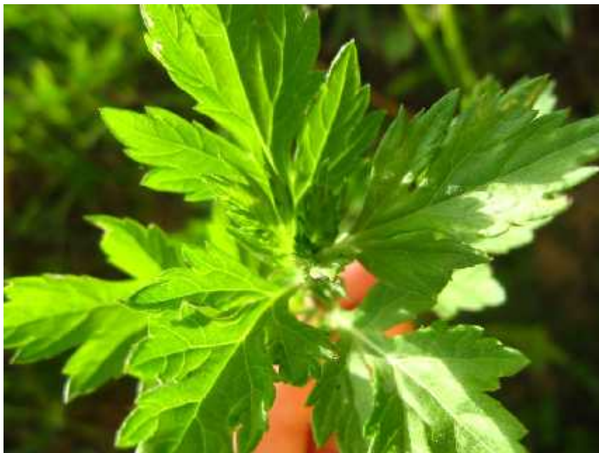
Slika 6. Artemisia vulgaris L. – mlada biljka

U umjerenj zoni kozmopolitski je rasprostranjen, te je raširen do subalpskog pojasa, osobito na suhim i humoznim tlima. Jak je kompetitor, a zbog neugodnog mirisa stoka ga izbjegava jesti (Šari , 1978). U Sjevernoj Americi je prisutan kao udomaćena vrsta, te se tamo ponaša kao invazivan korov (Nikoli i Kova i , 2008).