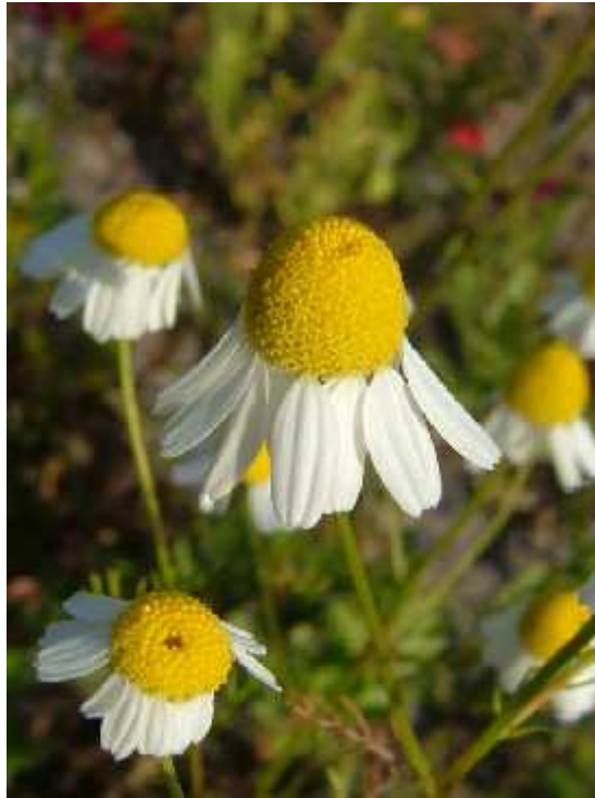
Slika 10. Chamomilla recutita (L.) Rauschert – cvat