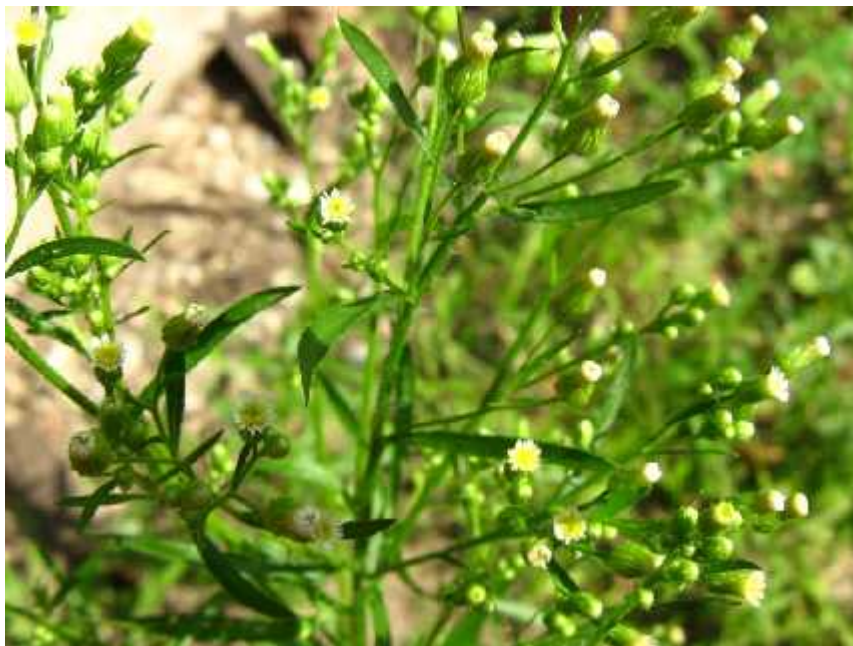
Slika 8. Conyza canadensis (L.) Cronquist – cvat

Sinonim ove vrste je Erigeron canadensis L., te joj je srodna vrsta Erigeron annuus (L.) Pers. (jednoljetna krasolika), no vrste nisu slične, osim što su obje korovne invazivne biljke (Nikolić i Kovačević, 2008).