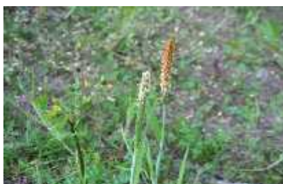
Slika 8. Alopecurus aequalis S. ( Vrbek, Buzjak, 2006.)

Alopecurus aequalis Sobol. (sl.8)- crvenožuti repak- VU – osjetljiva svojta ( Poaceae ) je jednogodišnja ili višegodišnja biljka, visine 20–40 cm, ponekad s kratkim podzemnim vriježama. U donjem dijelu stabljika je gusto razgranjena, polegla ili se koljeni asto uzdiže te zakorijenjuje na donjim rukavcima. Rukavci su goli, a najdonji postaju sme i i raspadaju se. Ogrljak je koži ast i dug 2–5 mm. Listovi su plavozeleni, 2–8 (12) cm dugi, 2–5 mm široki, plosnato rašireni i hrapavi. Cvat je metlica duga 2–7 cm, a široka 3–5 mm, valjkasta oblika i gusta. Klasi i duguljasto-ovalni, s jednim cvijetom, dugi (1,5) 2–2,5 mm i otpadaju cijeli. Pljevice su me usobno jednake s dugim trepetljikama na hrptu, a obuvenac na le noj strani ima osat dugu 1-1,8 (2) mm. Košuljice nema. Raste u pionirskim zajednicama obala slatkih voda, uz rubove bara i jaraka, na vlažnim, povremno plavljenim dušikom bogatim bazi nim do slabo kiselim muljevitim glinenastim tlima. Biljka je uglavnom široko rasprostranjena (od brdskog do subalpinskog pojasa, esto i niže). Cvate od lipnja do rujna /listopada. Uzroci ugroženosti su uništavanje staništa na kojima raste.