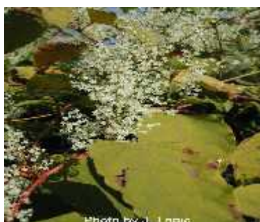
Slika 16. Amorpha fruticosa

Amorpha fruticosa (sl.16)– ivitnjača, amorfa – porijeklom je iz Sjeverne Amerike. Stvara velike količine plodova koje raznosi voda, pa se opasno proširila nizinskim poplavnim područjem gdje predstavlja ozbiljnu smetnju šumskim gospodarstvima jer naglo osvaja površine, onemogućava pošumljavanje i širenje autohtone šumske vegetacije. U parku je zabilježena samo na istom dijelu trećeg jezera. Ujeno je samo nekoliko primjeraka ove biljke, ali s obzirom na njene velike invazivne sposobnosti kao i idealnih uvjeta za njeno širenje preporuča se uklanjanje svih primjeraka.