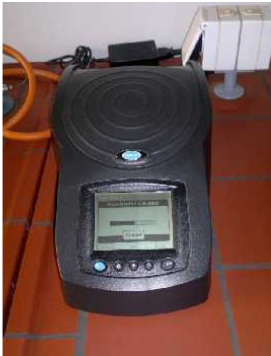
Slika 5. WTW 330 pH metar

Po etna vrijednost pH je izmjerena sa WTW 330 pH metrom - Slika 5.