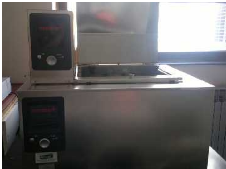
Slika 4. Memmert WNB vodena kupelj s mješalicom

Prije samog imobiliziranja bakterija, A. junii je uzgojen na hranjivom agaru (Biolife, Italija). Bakterije smo zatim suspendirali u 0,05M sterilne otopine natrijeva klorida i inokulirali po 1 mL u Erlenmeyerove tikvice u kojima je bilo pripremljeno 100 mL sintetske vode. Uz svaku suspenziju A. junii u svaku od tikvica smo dodali po 1g odabranog materijala. Tikvice smo zatim za epili plasti nom folijom i inkubirali u vodenoj kupelji Memmert WNB (Slika 4) na 30°C kroz 24 sata uz konstantno mješanje od 70 rpm. Za dovod sterilnog zraka koristili smo akvarijske pumpe na koje smo pri vrstili serološke pipete (1L zraka/min). Tako er, kako bismo ustanovili postotak uklanjanja P od strane same terra rosse, isti postupak je napravljen bez dodavanja bakterija.