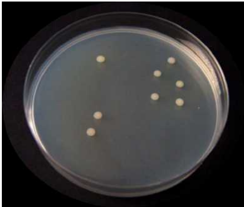
Slika 2. Acinetobacter junii na hranjivom agaru nakon 24 h inkubacije

Liofilizirana kultura fosfat-akumuliraju e bakterije A. junii soj DSM 1532 je dobivena je iz Deutsche Sammlung von Microorganismem und Zellkulturen GmbH banke mikroorganizama. Soj se odražavao na hranjivog agaru (Biolife, Italija) i precjepljivan je mjese no te uvan na 4°C (Slika 2.). Sastav hranjivog agara: 15,0 g agara, 5,0 g peptona, 3,0 g gove eg ekstrakta, 1L destilirane vode. pH vrijednost medija je namještena na neutralni pH 7,0±0,2 prije sterilizacije autoklaviranjem (121°C/15min).