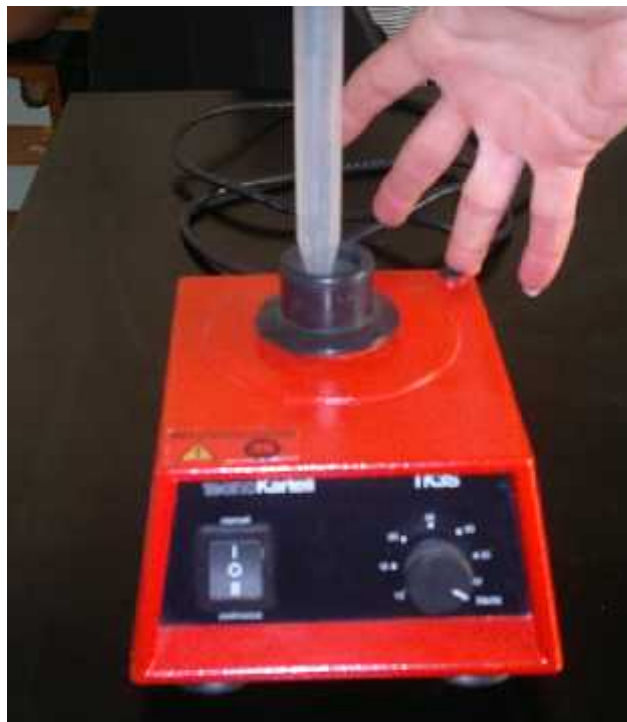
Slika 7. Kartell TK3S homogenizator (odvajanje imobiliziranih bakterijskih stanica)

Materijal iz epruveti za određivanje broja imobiliziranih bakterija smo prebacili u petrijeve plo e (materijal prikupljen ispiranjem posude) i stavili u sušionik na 105°C/24 h. Nakon 24 sata smo izdvojili materijal, izvagali ga na analiti koj vagi i prera unali u broj bakterija po gramu materijala.