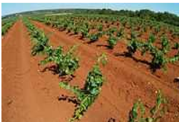
Slika 1. Terra rossa ( http://vinopedia.hr/wiki/index.php?title=crvenica )

Terra rossa je tip glinenog tla nastao trošenjem vapnenca. Kada se vapnenac troši, glina u stijenama ostaje zarobljena kao i netopljivi kameni materijal. U aerobnim uvjetima, kada je tlo iznad vodonosnog sloja, željezni oksid se formira u glini dajući joj karakterističnu crvenu do crvenonaranastu boju (Slika 1). Ima dobre drenažne karakteristike kao i većina glinenih tla. To ju čini pogodnom za uzgoj vinove loze te voća.