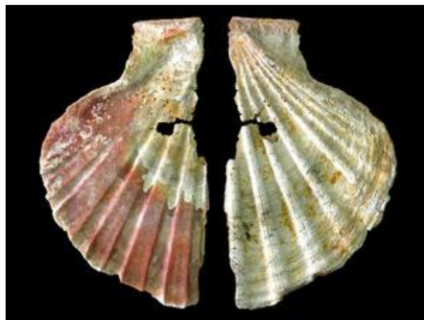
Slika 4 Školjka bojana pigmentima i korištena kao ukras u musterijenskoj kulturi