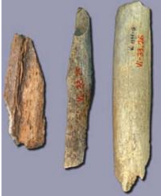
Slika 6 Tri neandertalske kosti pronađene u spilji Vindija koje su korištene pri izolaciji DNA