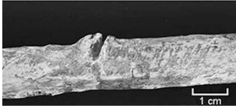
Slika 5 Prikaz frakture rebrene kosti Shanidar 3 neandertalca