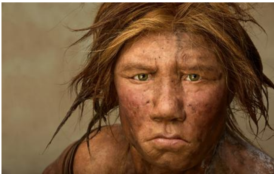
Slika 2 Prikaz puti i kose neandertalke