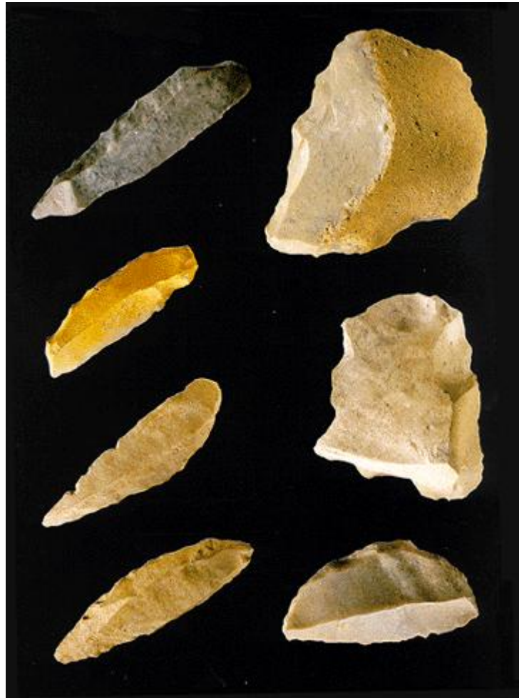
Slika 3 Neandertalski kameni alat

pretpostavlja da su usvojili neke tehnike iz kromanjonske kulture (kultura Homo sapiens vrste).