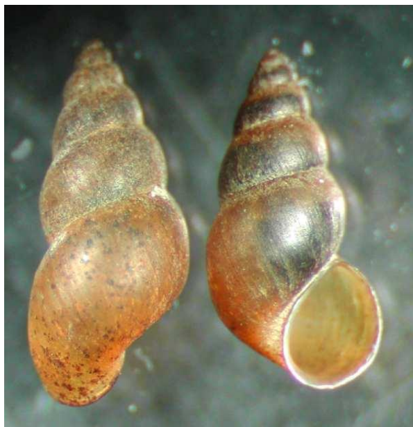
Slika 1. Vrsta Potamopyrgus antipodarum

Otvor na kućici jajolikog je oblika. Otvor zatvara operkulum. To je rožnata tvorevina koja je ponekad građena od kalcijeva karbonata i konhiolina, zatvara ušće kućice kada se glava i stopalo uvuku. Veličina invazivnih puževa uglavnom iznosi 4-6 mm dok u Novom Zelandu gdje su autohtona vrsta mogu narasti do 12 mm (Zaranko et al., 1997; Levri et al., 2007). Pod mikroskopom slabog povećanja tkivo embrija je blijedožučkaste boje za razliku od tamnijeg tkiva roditelja.