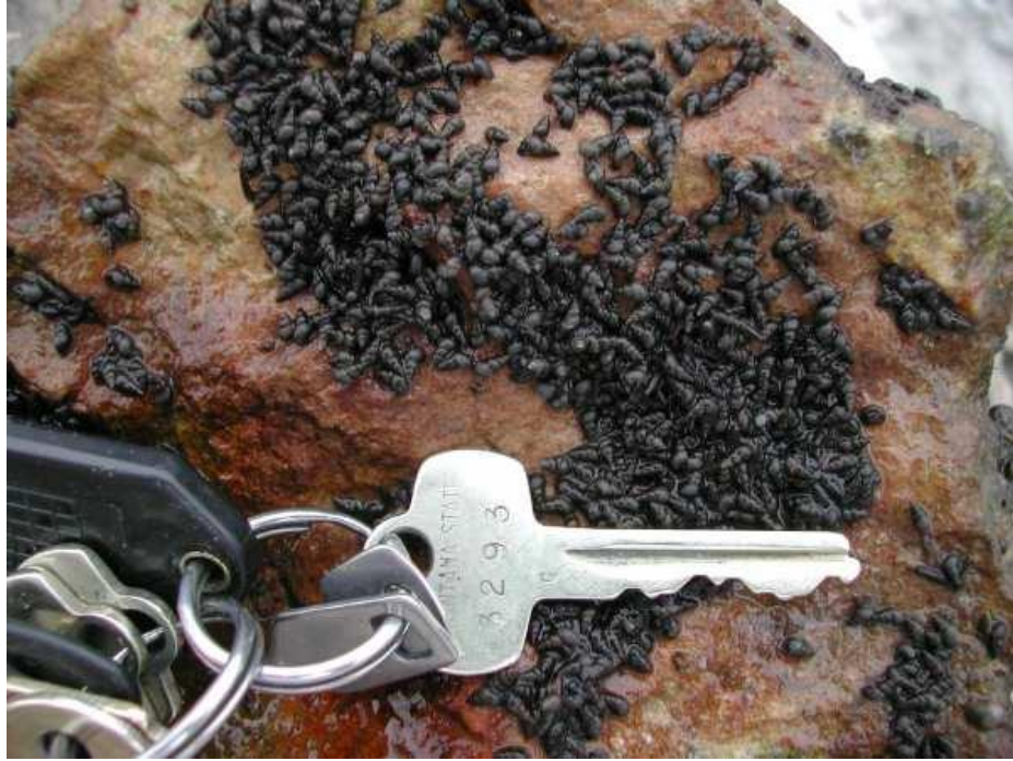
Slika 5. Gusta populacija Potamopyrgus antipodarum