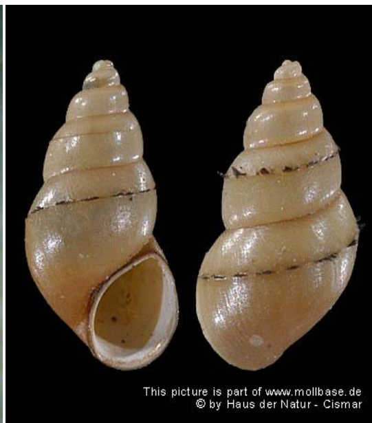
Slika 2. Kućica s bodljama ( http://www.mollbase.de/list/index.php?aktion=zeige_taxon&id=75 )

( http://www.issg.org/database/image.asp?ii=534&ic=e )