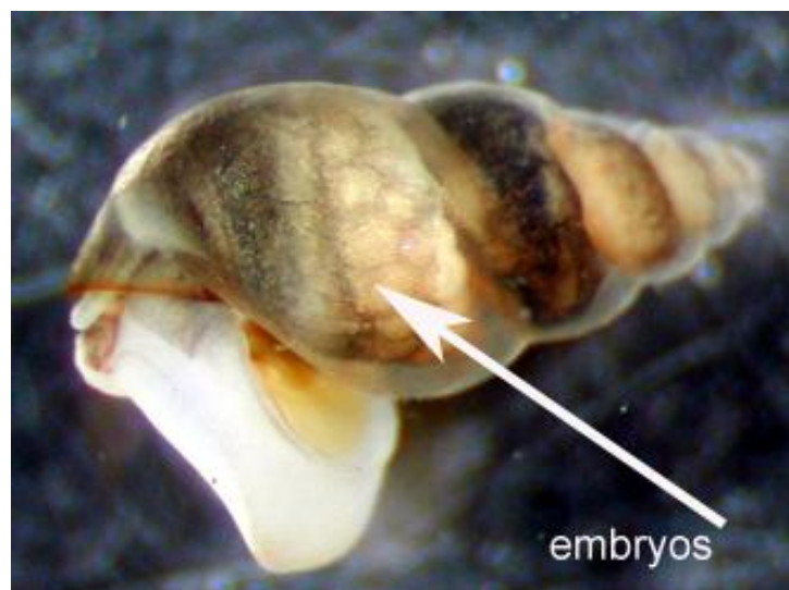
Slika 3. Embriji u ženki

Životni vijek mu je oko dvije godine. U Novom Zelandu, koji mu je izvorno stanište, reproducira se spolno i nespolno, spolni oblici su diploidni (sadrže dva seta kromosoma, 2n ) i postoji manje od 5 % mužjaka sposobnih za razmnožavanje. Za razliku od toga, u staništu koje im nije izvorno prevladavaju ženke koje se nespolno razmnožavaju partenogenezom. To je oblik razmnožavanja u kojem se jaje razvije u mladu životinju bez oplodnje. Nastaju mladi koji su genetički istovjetni roditeljima. Kod životinja odvojenih spolova mladi koji nastaju ovim oblikom razmnožavanja uvijek su ženke ( http://rivrlab.msi.ucsb.edu ). Populacije nastale partenogenezom isključivo su triploidne (sadrže tri seta kromosoma, 3n ), (Alonso & Castro-Diaz, 2008). Ženke koje se razmnožavaju partenogenezom mogu proizvesti dva puta više potomaka nego ženke koje se razmnožavaju spolno. Ženke koje se razmnožavaju spolno daju potomke obaju spolova.