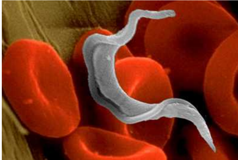
Slika 2. Trypanosoma cruzi

zbog dostave sadržaja autofagosoma reservosomima/lizosomima (Alvarez i sur., 2008). Ovi podaci pokazuju da se proteini akumulirani u reservosomu koriste od strane epimastigotnih oblika kao izvor energije tijekom diferencijacije i da bi autofagija mogla biti presudna za njihov nestanak tijekom kralježnja kih stadija.