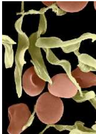
Slika 3. Trypanosoma brucei

Neuropeptidi su nedavno naeni u sisavcima nakon infekcije s T. brucei (Slika 3). Ovi peptidi ciljaju parazitski glikosom i induciraju autofagiju u stani, što vodi do smrti kod oblika koji su u krvi, ali ne i kod procikličkih oblika. Neuropeptid-posredovanoj stani, što vodi do smrti kod T. brucei , prethodi neuspjeh energetskog metabolizma i prema tome se može povezati sa stresom. (Delgado i sur., 2009).