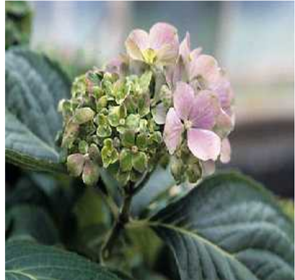
Slika 3. Virescencija-ozelenjavanje dijelova cvijeta.