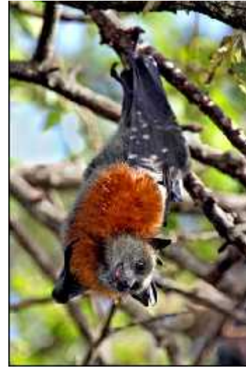
Slika 6. Piteous poliocephalus