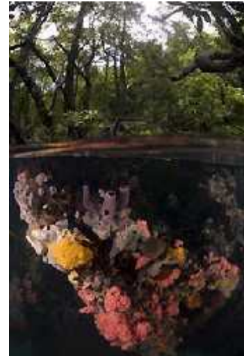
Slika 3. Spužve