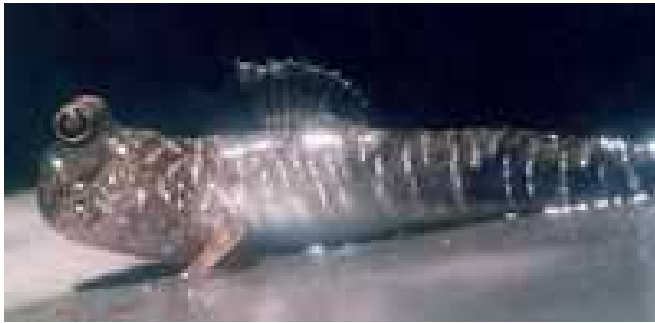
Slika 4. Periophthalmus gracilis

Šume mangrova svojim bogatim i raznolikim sustavom korijena te visokim krošnjama mnogim organizmima pružaju utočište, stanište te mjesto za lov i hranjenje. Sustav mangrova se temelji na detritusnom tipu hranidbene mreže. Otpalo lišće i razgrađuju detritivori i time se produktivnost povećava.