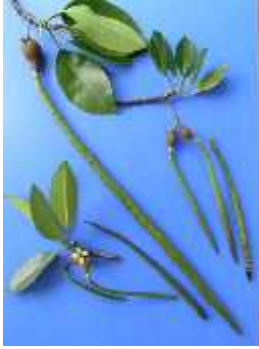
Slika 7. Rhizophora mucronata