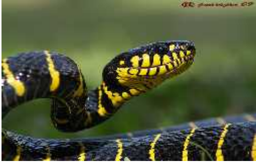
Slika 5. Boiga dendrophila