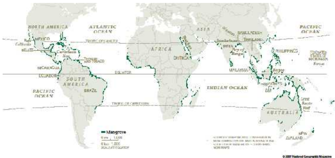
Slika 1. Karta rasprostranjenosti mangrova ( http://www.friendsofmangrove.org.my )

Šume mangrova razvijaju se u tropskim i subtropskim područjima unutar 30 stupnjeva geografske širine s obje strane ekvatora. Prisutne su uz obale Azije, Australije, Afrike i Amerike no najveća bioraznolikost je u jugoistočnoj Aziji odakle se i smatra da su potekle (Sl. 1.). Pomoću propagule mogle su se morskim strujama rasprostraniti na ostale kontinente. Propagula je struktura, tj. sjanac za rasprostranjivanje mangrova. Sjemenke se razvijaju u sjanacima na roditeljskoj biljci te su ovisni o njoj određeno vrijeme.