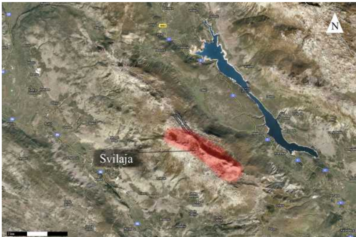
Slika 1. - Lokacija planine svilaje

Svilaja je 30-ak kilometara duga planina smještena u dalmatinskoj zagori, između Knina, Drniša i Sinja, sjeverno od Splita (Slika 1.).