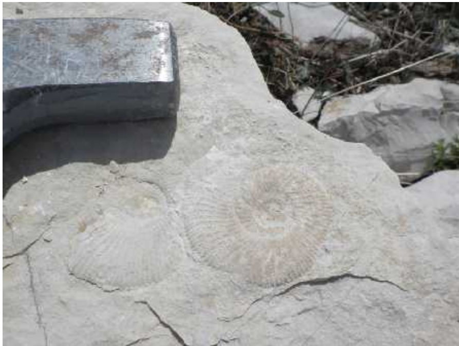
Slika 3. - Amoniti roda Virgatosphinctes iz lemeš naslaga. Geološki čekić kao mjerilo.