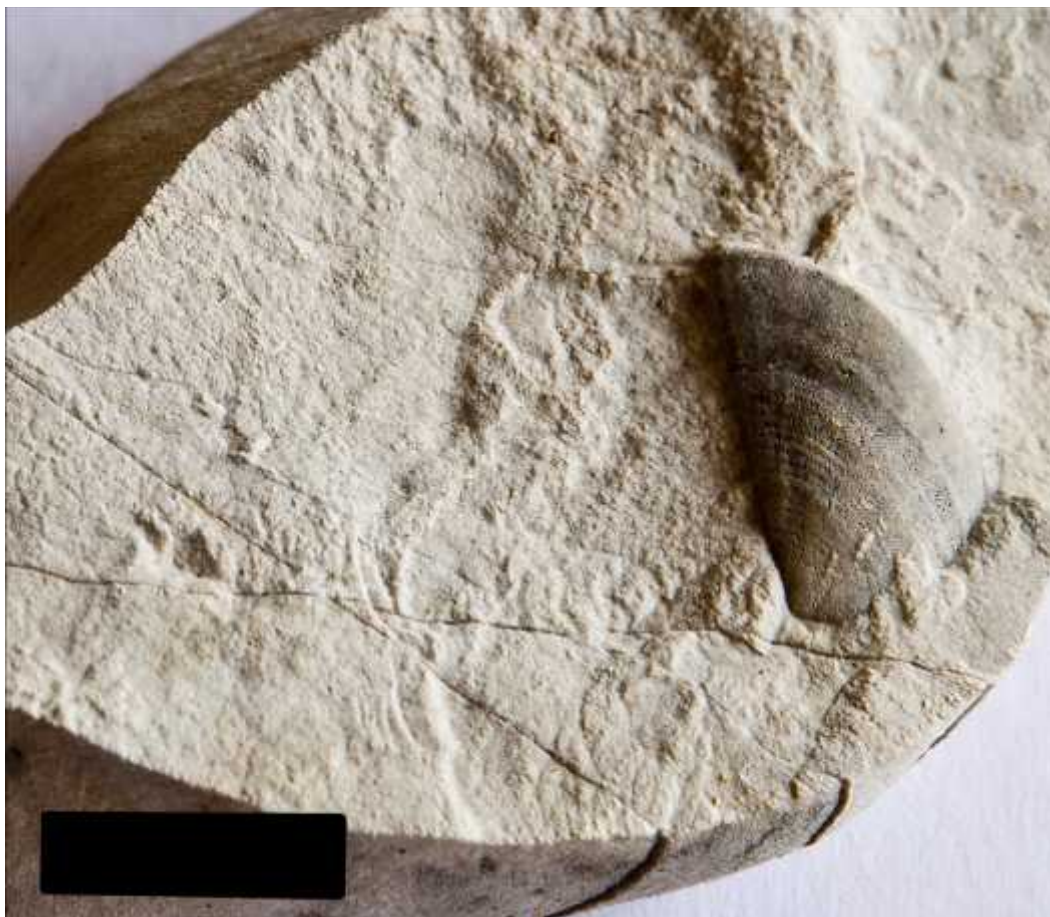
Slika 8. - Djelomi ni aptychus amonita s vidljivim brazdama. Mjerilo predstavlja 1 cm.