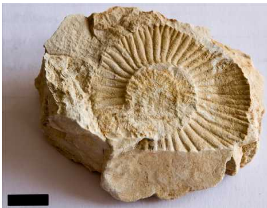
Slika 5. - Perisphinctes , drugi primjerak. Mjerilo na slici označava 1 cm.

I ovaj se primjerak sastoji od planspiralne, evolutne kućice. Razmak između susjednih primarnih rebara je širi nego kod primjerka Perisphinctes (1), te je stoga posebno opisan. Tri četvrtine zavoja zauzima primarno rebro koje se u zadnjoj četvrtini i razvija na dva sekundarna rebra. Promjer je oko 3,5cm. Zadnji zavoj i ušestručeni nisu sačuvani (Slika 7).