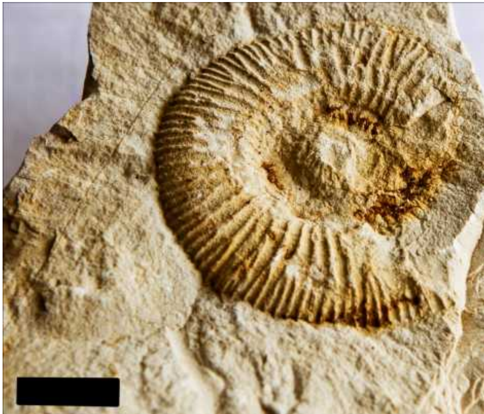
Slika 4. - Prvi primjerak roda Perisphinctes , mjerilo na slici označava 1 cm.

Rod Perisphinctes ima planspiralnu, evolutnu kuću. Rebra su gusta i dobro definirana. Dvije trećine zavoja zauzima primarno rebro koje se u zadnjoj trećini razvija na dva sekundarna rebra. Sekundarna rebra su izrazito definirana u zadnjem zavoju. Zavoji koji se nalaze bliže pupku slabije su sačuvani na ovom primjerku. Promjer je oko 4 cm. Na uzorku nedostaje predio gdje bi se nalazilo ušće.