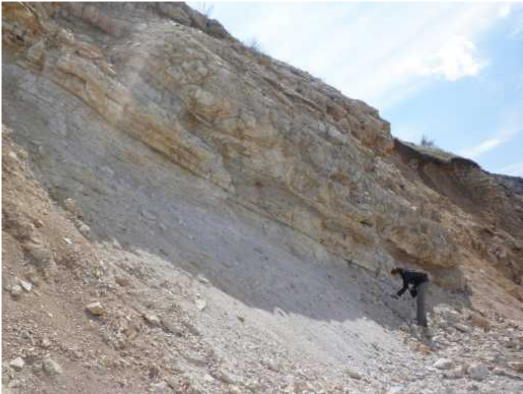
Slika 3. - Dobro vidljiva uslojenost naslaga na istraživanom lokalitetu.