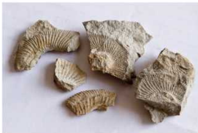
Slika 9. - Preostali fosilni ostaci prona eni na lokalitetu (nisu opisani)