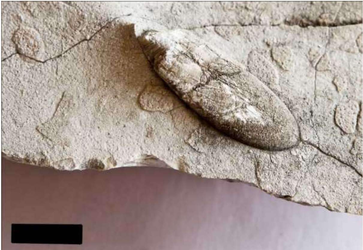
Slika 7. - Belemnit, drugi primjerak. Mjerilo označava 1 cm.