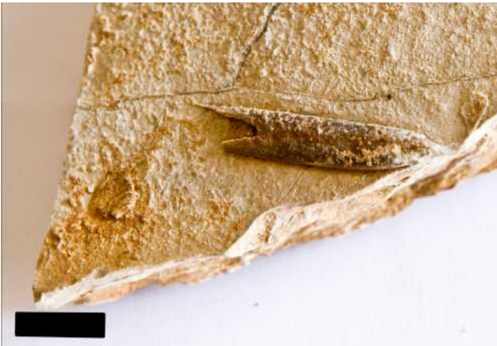
Slika 6. - Belemnit, prvi primjerak. Mjerilo na slici označava 1 cm.

Ovaj fosiliziran primjerak predstavlja rostrum jurskog belemnita. Ostatak ima sitna oštećenja s prednje strane na jednoj od rostralnih lamela. Dužina cijelog rostruma je oko 3 cm, a širina oko 0,75 cm (Slika 8.). Na prednoj strani rostruma se nalazi udubljenje (alveola) u kojoj je bio smješten fragmokon. Epirostrum može poslužiti za raspoznavanje samih vrsta belemnita – u ovom primjerku je specifično šiljast. Zbog fragmentiranosti nalaska nije bilo moguće odrediti točnu pripadnost, no pretpostavlja se da se radi o rodu Goniotoothis .