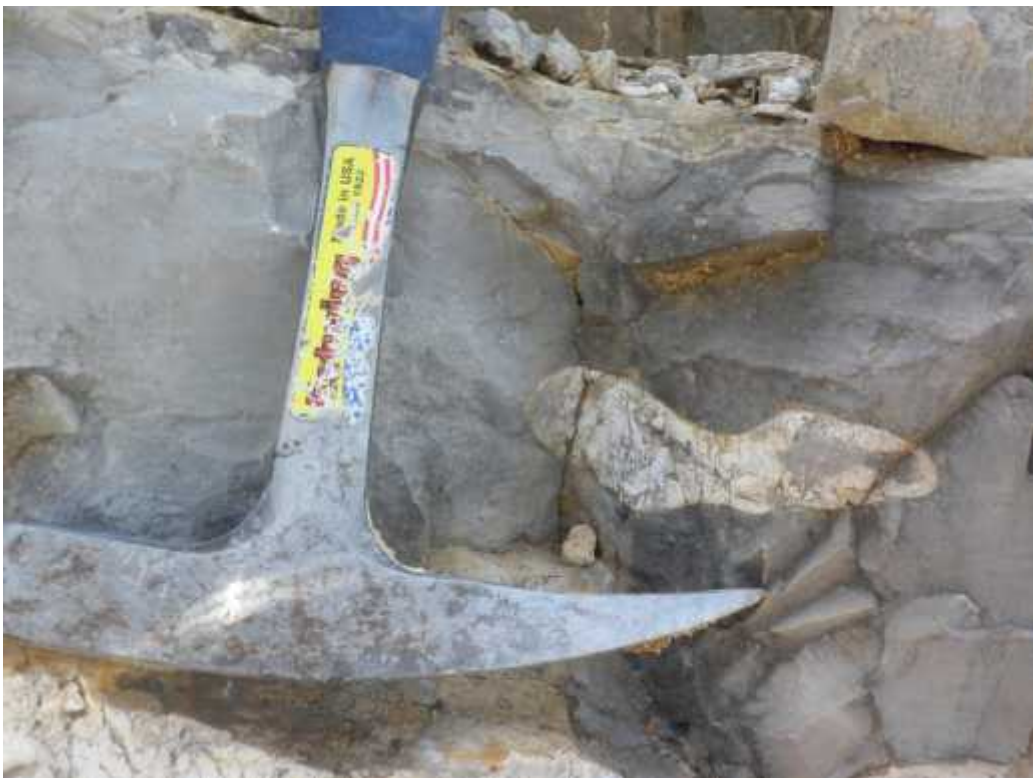
Slika 2. - Rožnjak prona en na planini Svilaji