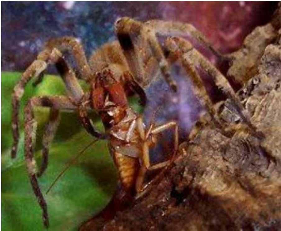
Slika 4. Phoneutria nigriventer .

Navedeni rodovi pauka, koji ukupno broje dvjestotinjak vrsta, svojim ugrizom mogu uzrokovati bol ili, u jako rijetkim slučajevima, ozbiljnije posljedice. Postoje i druge vrste koje prati glas izuzetno opasnih, primjerice australski mišji pauk roda Missulena , ili noćni pauk Dysdera crocata , čiji ugrizi mogu uzrokovati kratkotrajnu bol, ali ni u kojem slučaju nisu opasni po život ljudi. Prijetnja koju pauci predstavljaju uglavnom je preuveličana. Kliničke studije pokazale su da su ugrizi samo u izuzetnim okolnostima smrtonosni, a za otrove nekih pauka proizveden je i protuotrov ili antitijelo, kao npr. za sfigomijelinazu D iz otrova L. reclusa ( http://ednieuw.home.xs4all.nl/Spiders/Nasty-Spiders/Demystification-toxicity-spiders.htm ).