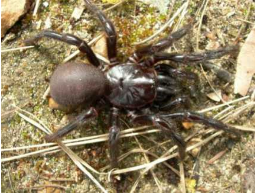
Slika 3. Atrax robustus .

izvan gradova. Iznimka je Atrax robustus (Slika 3.), čije je središte rasprostranjenosti Sydney, Australija, i koji je odgovoran za većinu slučajeva ugriza. Kod ostalih vrsta ovih rodova, opasnost predstavljaju mužjaci koji u potrazi za ženkama znaju ulaziti u gradska naselja i kuće. Uspješno je proizveden protuotrov za njihove toksine i od početka njegove uporabe 1981. nije potvrđeno ni jedan smrtni slučaj kao posljedica ugriza ovih pauka.