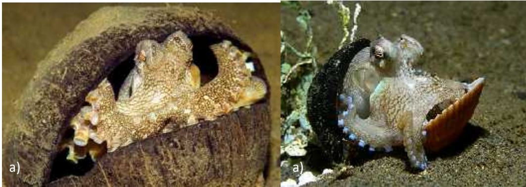
Slika 5. Upotreba alata. Hobotnice upotrebljavaju ljusku kokosovog oraha (a) i ljušturu školjkaša (b) kao štit i sklonište koje nose sa sobom.

važnost REM fazi sna u razvoju inteligencije. No ostaje velika nepoznanica zašto bi se razvilo toliko kognitivnih značajki karakterističnih za socijalne, dugoživu i kralježnjake u ovih samotnijih životinja koje u prosjeku žive svega godinu dana, razmnožavaju se jednom te ugibaju kratko nakon što polože jaja ( http://discovermagazine.com/2003/oct/feateye ).