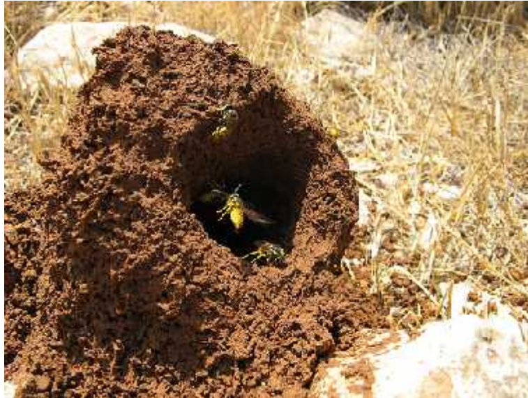
Slika 10. Vespa Germanica gradi gnijezdo na zemlji

izlegla dovoljno radilica koje će preuzeti izgradnju gnijezda ostavljaju i kraljicu da se usredotoči na reprodukciju. Iz tog razloga, veličina gnijezda je općenito dobar pokazatelj koliko otprilike radilica ima u koloniji, a neka stršljenova gnijezda na kraju narastu do veličine loptice za picigin.