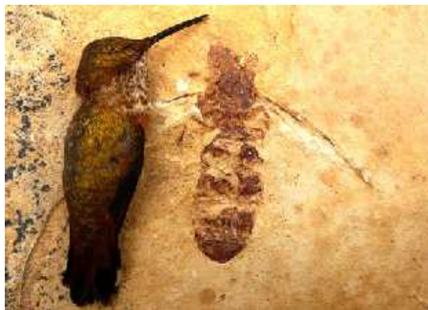
Slika 1. Usporedba fosilnog Titanomyrma giganteum sa veličinom kolibrija a

Raspon veličina je 0,75 do 52 mm, a najveća je bila izumrla vrsta je fosil Titanomyrma giganteum (sl.1). Mravi se razlikuju u boji, najčešće crvene ili crne, ali nekoliko vrsta je zelene boje, a neke tropske vrste imaju metalni sjaj.