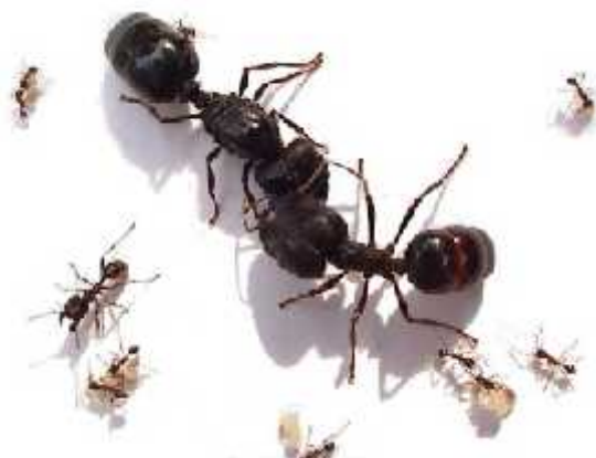
Slika 3. Usporedba veli ine jedinki kod vrste Pheidologeton diversus

U kolonijama postoji nekoliko oblika mrava radnika (naj eš e tri – manji, srednji i najve i) kod kojih postoje fizi ke razlike u veli ini (polimorfija). Ve i mravi, radnici snažnijih eljusti modificiranih za borbu, odlika su „vojnika“ ije se dužnosti ne razlikuju od dužnosti ostalih radnika sve dok nije potrebno štititi zajednicu.U nekoliko vrsta srednji su radnici odsutni, stvaraju i oštru razliku izme u manjih i ve ih mrava radnika. Najmanje i najve e radnike nalazimo kod vrste Pheidologeton diversus (sl.3) gdje je ta razlika gotovo 500 puta. (Moffett,Tobin 1991.)