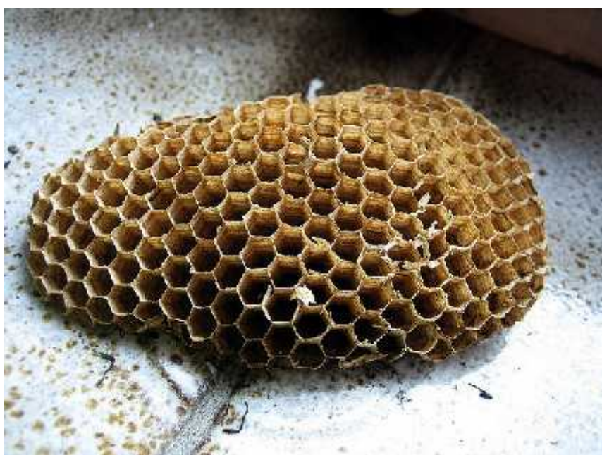
Slika 9. Napuštena gnijezda osa

Sjeme koje je bilo pohranjeno ranije sada se koristi za oplodnju jajašca. Jedna kraljica je sposobna za izgradnju cijele kolonije sama. Kraljica u početku podiže prvih nekoliko setova jaja dok nema dovoljno sterilnih radnica za održavanje potomstva bez njene pomoći.