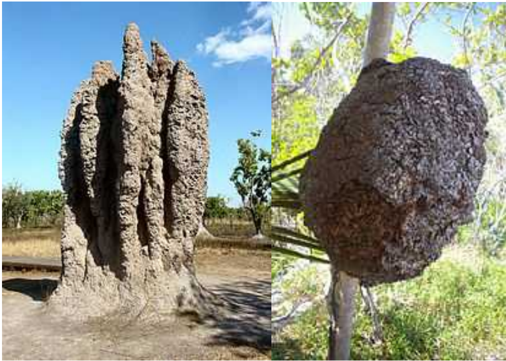
Slika 11. Termitnjak