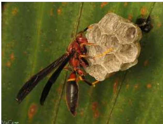
Slika 8. Matica vrste Polistes annularis polaže jaja

Sjeme koje je bilo pohranjeno ranije sada se koristi za oplodnju jajašca. Jedna kraljica je sposobna za izgradnju cijele kolonije sama. Kraljica u početku podiže prvih nekoliko setova jaja dok nema dovoljno sterilnih radnica za održavanje potomstva bez njene pomoći.