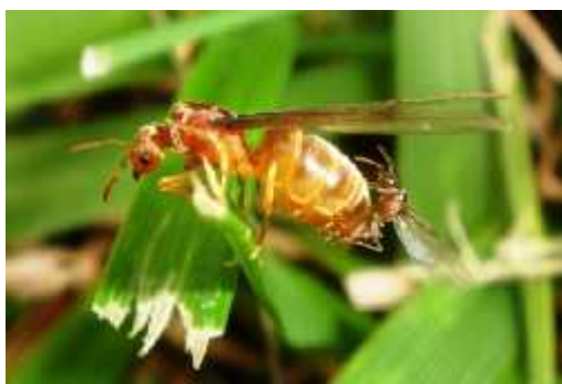
Slika 4. Parenje ( hr.wikipedia.org )

Ljeti reproduktivne jedinke kolonije, krilati mužjaci i ženke, napuštaju koloniju i imaju svadbeni let. On započinje letom mužjaka prije ženki. Mužjaci pronalaze mjesto za parenje (sl. 4), luku feromon koji slijede ženke. Obično se ženke pare sa samo jednim mužjakom, ali kod nekih vrsta se pare i do 10 ili više različitih mužjaka. Nakon parenja ženke tada traže pogodno mjesto za osnivanje kolonije. Gube krila i počinju polagati jaja. Ženke imaju sposobnost pohraniti sjemenske stanice mužjaka u posebnom dijelu svojega spolnog sustava (sjemeno spremište – receptaculum seminis) i one dostaju za oplodivanje jajašaca tijekom cijeloga njihova života. Prvi radnici koji se izlegu su slabiji i manji od kasnijih radnika, ali oni počinju služiti koloniju odmah. Rade na povećanju legla, pronalasku hrane i brige za druga jaja. (Mader,2004.)