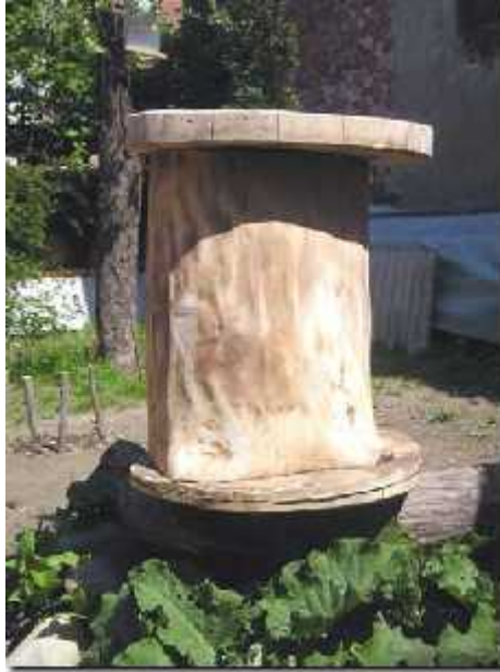
Slika 6. Dubina