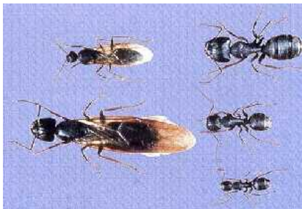
Slika 2. Usporedba oblika izme u radnika i dvije kraljice(desno).