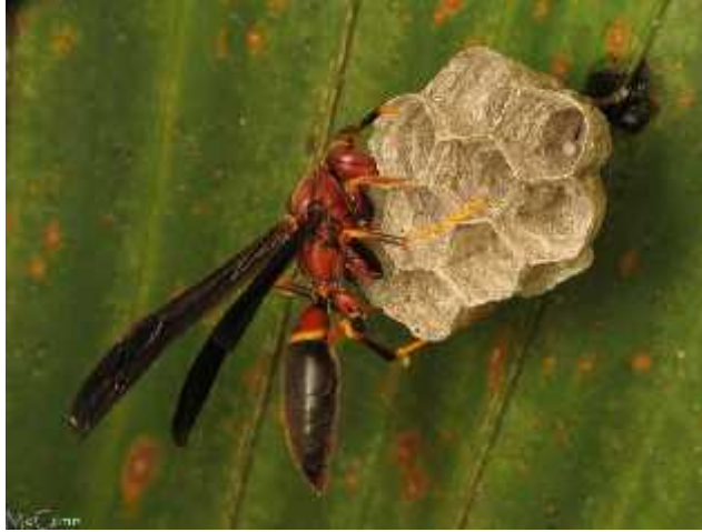
Slika 8. Matica vrste Polistes annularis polaže jaja

Sjeme koje je bilo pohranjeno ranije sada se koristi za oplodnju jajašca. Jedna kraljica je sposobna za izgradnju cijele kolonije sama. Kraljica u početku podiže prvih nekoliko ćelija jaja dok nema dovoljno sterilnih radnica za održavanje potomstva bez njene pomoći.