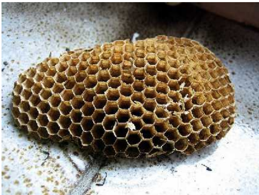
Slika 9. Napuštena gnijezda osa

Sjeme koje je bilo pohranjeno ranije sada se koristi za oplodnju jajašca. Jedna kraljica je sposobna za izgradnju cijele kolonije sama. Kraljica u početku podiže prvih nekoliko ćelija jaja dok nema dovoljno sterilnih radnica za održavanje potomstva bez njene pomoći.