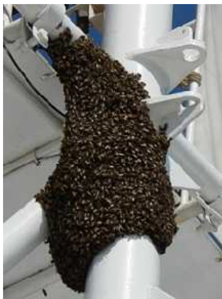
Slika 5. Roj pčela

Uzroci rojenja mogu biti mnogi, primjerice ako je prevelik broj pčela u zajednici, ako se ne može izlučiti vosak i graditi saće, ako ventilacija nije dostatna, ako se stvara višak materijala, ako je matica stara i mnogi drugi.