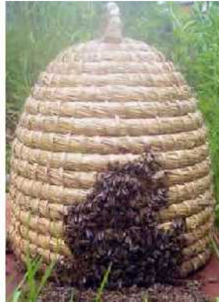
Slika 7. Pletara