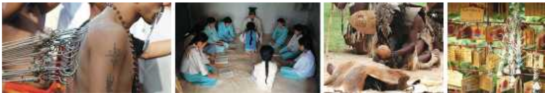
Slika 2. Izražavanje kulture na različite načine (Culotta 2009).

Kultura (Sl. 2.) predstavlja sredstva prenošenja informacije pojedinca pojedincu na način različit od genetskog. Kulturološka evolucija te je neovisno o genetskoj, jer nam time omogućuje brže koloanje društvom (kroz ideje i tehnološke inovacije) i ubrzani razvoj (Lewin i Foley 2004).