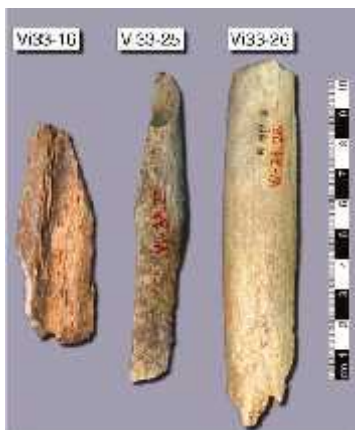
Slika 1. Uzorci kostiju uzeti iz špilje Vindija (preuzeto iz Green i sur., 2010)

Green i sur. (2010) uzeli su 21 uzorak kosti neandertalaca koje su bile od male morfološke vrijednosti. Uzorke su testirali na prisutnost mtDNA umnažanjem pomoću lančane reakcije polimeraze (PCR) te izabrali ukupno 3 uzorka: uzorak 1- kost Vi33.16 uzeta iz stratigrafskog sloja G3, starost 38 000 godina, uzorak 2 - kost Vi33.25 uzeta iz stratigrafskog sloja I, nije datirana i uzorak 3 - kost Vi33.26 uzeta iz sloja G, starost 44 500 godina (Slika 1.), od kojih je determinirano da su uzorci 1 i 2 iz različitih jedinki dok je uzorak 3 u srodstvu sa uzorkom 1. Svi uzorci su ženskog spola.