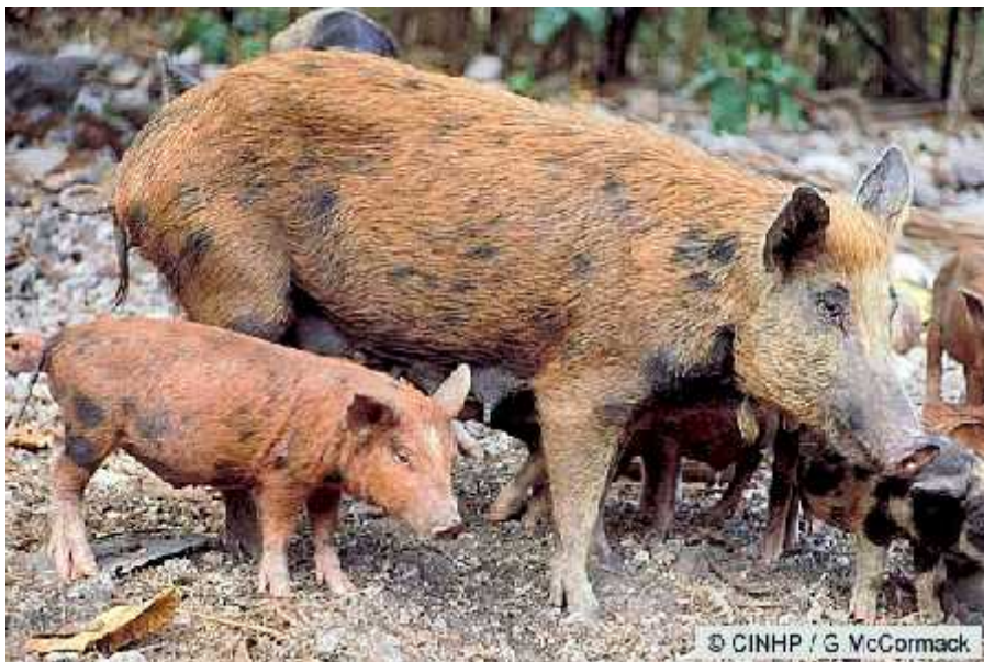
Slika 4. Hibrid divlje i domaće svinje sa prašinama

Osim povećanja brojnosti populacije divljih svinja nakon Domovinskog rata, vidljiva je i promjena genetičke strukture populacije. Naime, zbog rata je na tisuće domaće svinje odlutalo u slobodnu prirodu. Dio tih životinja se pomješao sa divljim svinjama kojima je šuma prirodno stanište, pa su nastali hibridi. I prije rata su hibridi bili prisutni, ali u manjim količinama. Vlasnici su domaće svinje u jesen vodili na „žirovanje“ u obližnje šume, gdje bi se one hranile žirevima, pa bi dolazilo do kontakta divljih i domaće svinje. Vidljive su promjene u fenotipu i periodu okota, budući da se divlje svinje više ne kote samo tijekom veljače i ožujka kao prije, nego cijele godine poput domaće svinje. Uz to, u ovakvim leglima se javlja po 10 do 15 mladih, za razliku od istokrvnih legla gdje ih je maksimalno 5. Hibridi se mogu prepoznati po tome što imaju izduženije, zaobljeno tijelo, mogu biti bijele, crne boje ili šareni, imaju preduge šiljate uši, kranje u glavu ili slabije kljove. Divlja svinja je obično smeđe boje, šareni, crni ili bijeli primjerci su izuzetno rijetki, uža je i viša, ima kranje i tijelo sa izrazito klinastom glavom i kratkim uspravnim ušima tamnijim od ostatka tijela. Domaća svinja ima manju, zaobljenu glavu, manje kosti i mišića, duge, spuštene uši, a kljove mužjaka su izrazito smanjene.