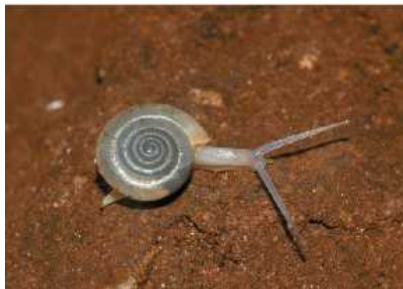
Slika 11. Endemska vrsta Meledella weneri iz špilje Ostaševica na otoku Mljetu (Gottstein i sur., 2002 b)

Kopneni podzemni puževi (Gastropoda) u Hrvatskoj su zastupljeni sa 24 vrste, što je najve i broj podzemnih kopnenih puževa me u svim europskim državama. Me u njima je 12 vrsta odnosno 50 % endemsko za Hrvatsku. Iz porodice Zonitidae, me u kojem su najve i podzemni kopneni puževi na svijetu, za Hrvatsku su endemski rodovi Troglaeopsis i Meledella (slika 11.), svaki sa po jednom vrstom.