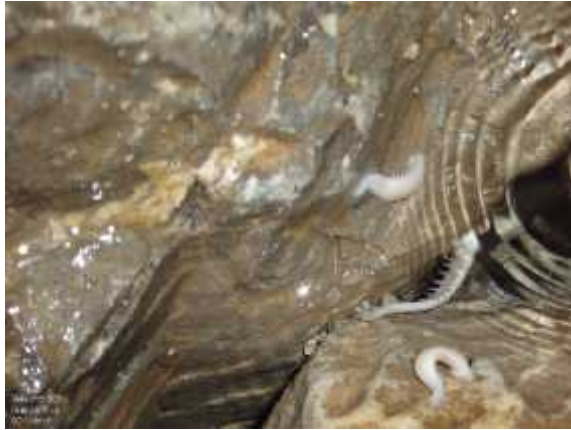
Slika 8. Croatobranthus mestrovi

samo u četiri duboke jame na sjevernom Velebitu: u Lukinoj jami (gdje je pronađena prvi put 1994. god.), Slovačkoj jami, jami Olimp i jamskom sustavu Velebita. Do sada je u samo jednoj špilji, na samom jugu Hrvatske, u okolici Dubrovnika, zabilježena i troglobionska vrsta pijavice – absolonova pijavica ( Dina absoloni ), koja je endem južnodinarske biogeografske regije i kritično ugrožena vrsta (CR).