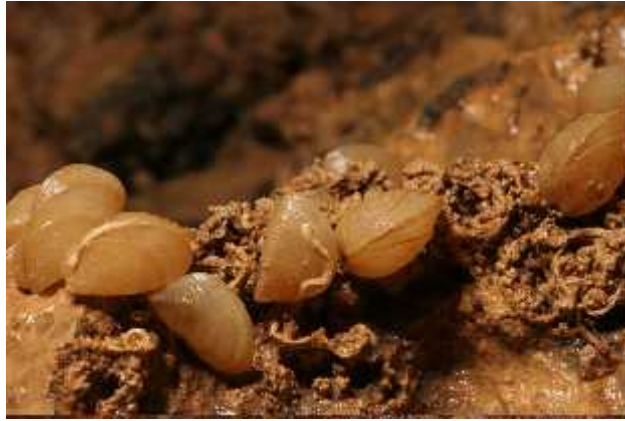
Slika 6. Congeria kusceri ; dinarski špiljski školjkaš

( http://www.hbsd.hr/SkupineZ_skoljkasi.html )