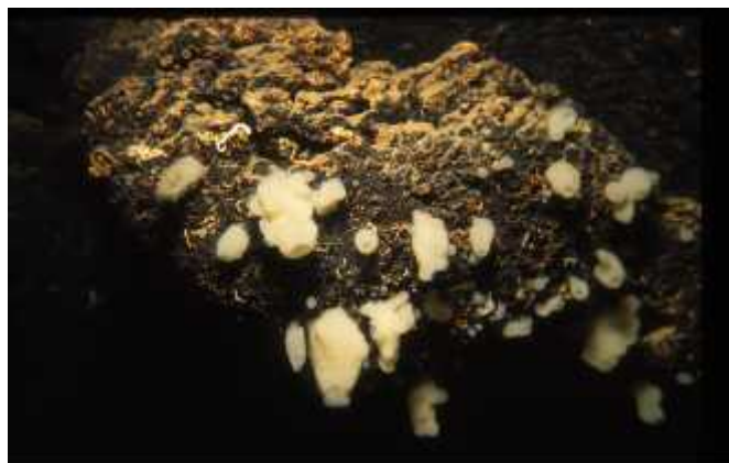
Slika 5. Eunapius subterraneus ; ogulinska špiljska spužvica

Iako morske vrste spužva ine znatni dio morske špiljske faune, slatkovodne podzemne spužve (Porifera) vrlo su rijetki stanovnici špilja u kontinentalnom dijelu Hrvatske. Jedina stigobiontska vrsta spužve, do danas poznata u svijetu, vrsta je ogulinska špiljska spužvica ( Eunapius subterraneus ) (slika 5.), s podvrstama E. subterraneus subterraneus i E. subterraneus mollisparspanis , koje su opisane iz podzemnih voda okolice Ogulina (Gottstein i sur., 2002 a). Pripadnici su sjevernodinarske biogeografske regije, stenoendemi su Hrvatske te šireg područja grada Ogulina i sjeverozapadne Like (Ozimec i sur., 2009). Prema Crvenoj knjizi spada u ugrožene svojte (EN).