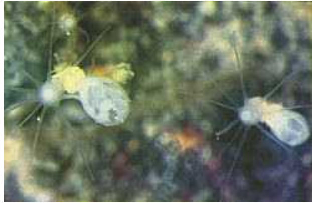
Slika 4. Velkovrhia enigmatica ; zagonetna velkovrhija

se nalazi na području Korduna. Prema Crvenoj knjizi pripada kriti no ugroženim svojstama (CR).