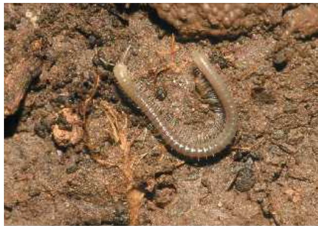
Slika 12. Chersoiulus ciliatus , endemska vrsta otoka Cresa (Gottstein i sur., 2002 b)

zastupljena troglobionskim rodovima Haasia s tri endemske vrste i endemskim podrodovima Likanosoma s dvije vrste: Haasia (Likanosoma) stenopodia i H. likana . Također iz Like je opisan endemski rod Egonpretneria s vrstom E. brachychaeta . S planine Biokovo opisana je endemska porodica Biokoviellidae na osnovi troglobionske vrste Biokoviella mauriesi . Iz porodice Schizopetalidae na području Dalmacije vrlo su iste najveće europske dvojenoge troglofilnog roda Apfelbeckia . Apfelbeckia hessei je najveća europska dvojenoga i endem je Dalmacije. Vrstama najbogatija obitelj Iulidae ima i kavernikolne predstavnike. Životu u speleološkim objektima najprilagođeniji su rodovi Typhloiulus i Chersoiulus (Gottstein i sur., 2002 a) (slika 12.).