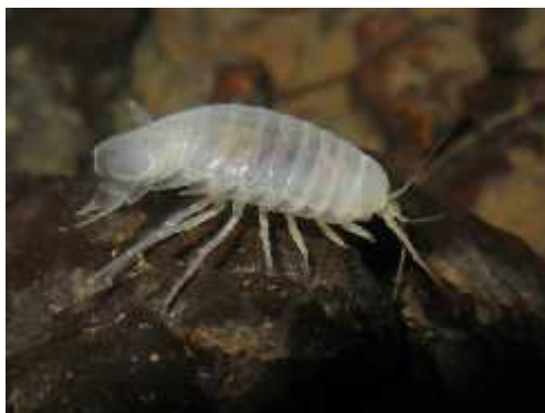
Slika 9. Sphaeromides virei mediodalmatina – najveća podzemna vodena babura u Hrvatskoj

( http://www.hbsd.hr/SkupineZ_rakovi_slatkovodni.html )