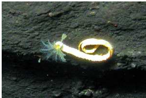
Slika 7. Marifugia cavatica ; dinarski špiljski cjevaš

Jedini do danas poznati podzemni cjevasti mnogo etinaš je dinarski špiljski cjevaš ( Marifugia cavatica ) (slika 7.). Još jedan paleoendem Dinarida, tako er u prošlosti nastanjivao jezera. Iako prema literaturnim podacima ima velik areal, to su uglavnom podaci o zapažanjima cjev ica, a rijetko o živim životinjama. Sustavna istraživanja populacija ne provode se ve desetlje ima pa nije poznato jesu li cjevaši na zabilježenim lokalitetima živi ili su cjev ice samo ostaci uginulih organizama (Ozimec i sur., 2009). Zbog toga ova vrsta spada u kategoriju nedovoljno poznatih svojti (DD).