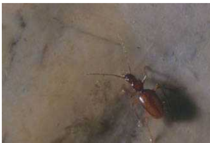
Slika 2. Typhlotrechus bilimeki istrus ; neoendem Hrvatske.

Kao posljedica geografske izolacije populacija u špiljskim staništima, razvojem i evolucijom iz pojedine ishodišne vrste nastaju novi taksonomski oblici koji su neoendemi. Filogenetskom analizom špiljskih svojiti lažištipavaca utvrđeno je da su brojne špiljske vrste rodova Chthonius i Neobisium nastale od ishodišnih epigejskih vrsta, odnosno njihovih zajedničkih srodnika (Ozimec, 2009). Iz Hrvatske je opisano čak osam podvrsta troglobiontskog špiljskog trka Typhlotrechus bilimeki (slika 2.), brojne neoendemske vrste podzemljara roda Speonesiotes , pauka roda Folkia i druge (Gottstein i sur., 2002).