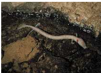
Slika 10. Proteus anguinus ; ovjeka ribica

Jedini stigobiontni kralješnjak u Hrvatskoj je vodozemac (Amphibia) – ovjeka ribica ( Proteus anguinus ) (slika 10.). Ona je endemski stigobiont podzemnih voda dinarskog krša Slovenije, Italije, Bosne i Hercegovine i Hrvatske. Potpuno je prilagođena životu u podzemlju, s tijelom bez pigmenta i bez oči. Ružičasta boja tijela potječe od riboflavina. Ima izvanredno dobro razvijeno osjetilo okusa a osobitost su joj elektroleptori. Vrlo je dugovjeka; može doživjeti čak stotinu godina (Gottstein i sur., 2002 a).