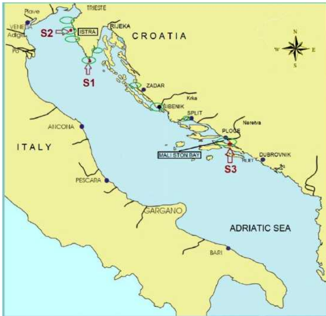
Slika 6. Lokacije uklju ene u kontinuirani monitoring kvalitete vode i školjkaša (obilježene zelenim krugovima) (Ujevi , 2012)