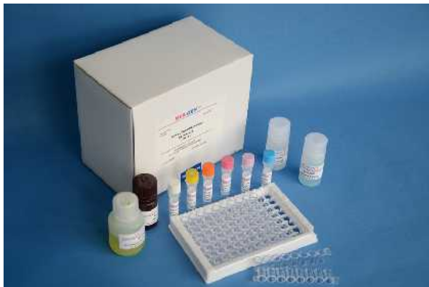
Slika 5. Oprema za ELISA test za detekciju saxitoksina ( www.reagen20.en )

Prva antitijela za saxitoksine su prona ena 1964. godine, no tek su se u posljednje vrijeme razvili ovakvi imunološki testovi. Do sada su prona ena antitijela za sve ostale biotoksine te su komercijalni ELISA testovi razvijeni za sve etiri skupine toksina koji se akumuliraju u školjkašima (Garthwaite, 2000) (Slika 5). ELISA testovi su relativno jeftini i brzi te ih je mogu e koristiti za velik broj uzoraka, što bi sa daljnjim razvojem u budu nosti moglo dovesti do upotrebe ove metode za rutinsku detekciju i odre ivanje koncentracije toksina u školjkašima.