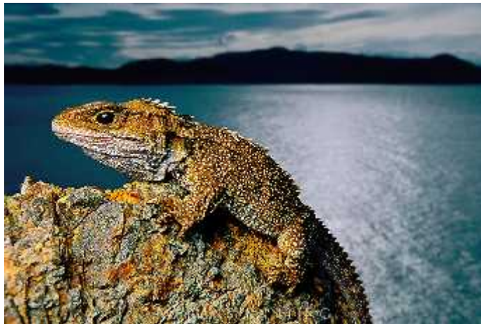
Slika 5. Brothers tuatara ( http://cdn.c.photoshelter.com/img-get/I0000UxzR7h3pPck/s/750/008316-01.jpg )

U zadnjih par godina znanstvenici izdvajaju još jednu vrstu tuatara, latinskog imena Sphenodon punctatus punctatus . Obitava na udaljenim sjevernim otocima, pa se zove i 'Northern tuatara', a sve joj se više pridodaje pažnje u istraživanjima i konzervacijskim akcijama.