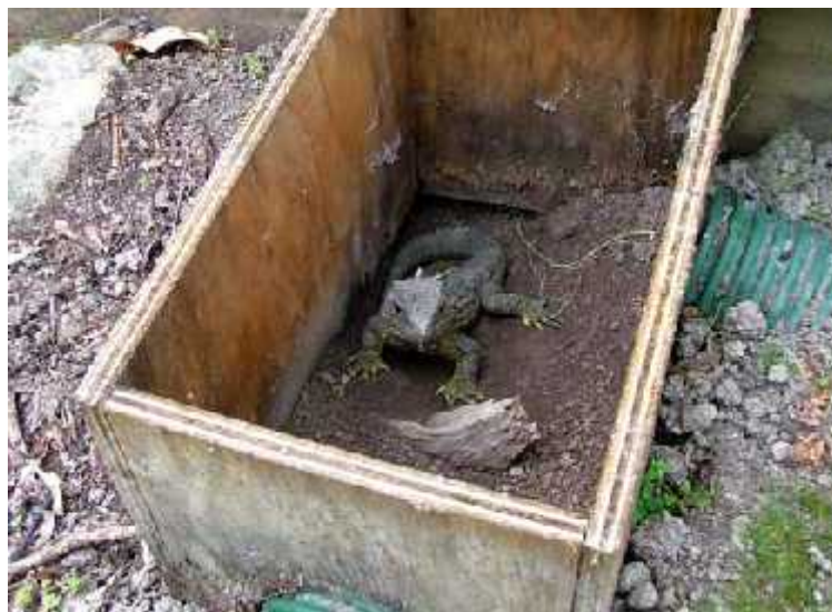
Slika 8. Sklonište sa uklonjenim poklopcem, te cijevima za izlazak/ulazak ( http://www.teara.govt.nz/files/p14992pc.jpg )

Do 1991. godine niti jedna jedinka nije bila uočena u posljednjih 14 godina, ali su populacije kiore štakora zato cvale. Strahovalo se da su sve tuatari izumrle, sve do detaljnih nadzora krajem godine i početkom 1992., kad se pronašlo 8 preživjelih odraslih jedinki. Oni su uhvaćeni i premješteni u obore u kojima su napravljena improvizirana skloništa (Slika 8) koja su ih štvala od najezde štakora. Naposljetku su se preostali gmazovi razmnožili i njihova jaja su inkubirana u zatočeništvu, a mladi su odgajani u okolišima slobodnim od kiora (Keall, 2009).