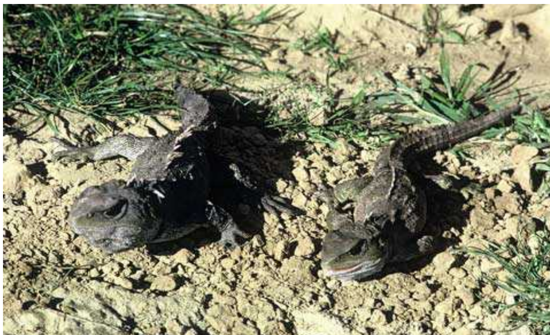
Slika 2. Mužjak i ženka tuatare ( http://www.teara.govt.nz/files/p14976doc.jpg )