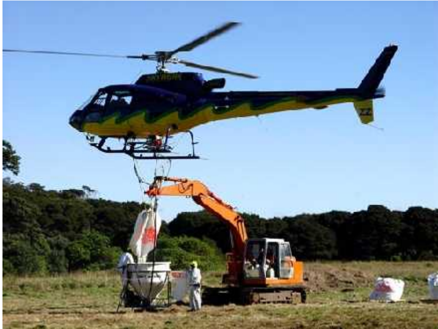
Slika 9. Desant na otok Hauturu, zima, 2004. ( http://www.teara.govt.nz/files/p14990pc.jpg )

DOC je drugi dio akcije proveo 2004. godine, i to je bio drugi najveći i program istrebljenja štakora na Novom Zelandu. U dva zračna izbacivanja na otok u razmaku od 6 tjedana, tri helikoptera su 'posijala' čak 55 tona otrova i zamki za štakore na cijelu površinu velikog otoka u pokušaju da unište polinezijske štakore (Slika 9).