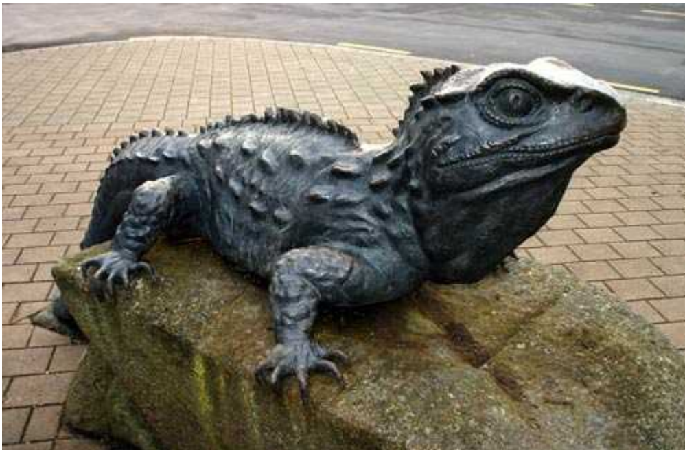
Slika 10. Skulptura tuatara ispred Southland muzeja (Invercargill) ( http://www.teara.govt.nz/files/p14991sm.jpg )

Do 1998. tuataru se moglo vidjeti samo na otocima 'svetištima' koja su bila zatvorena za javnost. Jedina iznimka bio je Southland Museum (Slika 10) gdje je tuatara bila izložena od 1961. godine, a razlog tomu je činjenica da je muzej bio jedno od prvih mjesta gdje se vršilo uspješno razmnožavanje u zatočeništvu. Skrivanje od šire javnosti je bilo bitno u očuvanju ovih gmazova, ali kako im je broj rastao kao posljedica uspješnih akcija, tako je 1998. godine proveden eksperiment i prenosnici su bili predstavljeni 'običnim' ljudima na nekim naseljenim otocima i u Wellingtonu, gdje su bili izloženi u posebnim ekološkim rezervatima (Keall, 2011). Tuatara danas dijele neke otoke s ljudima, a polako ali sigurno ih se vraća na dva najnaseljenija otoka. Do 2007. većina velikih zooloških vrtova prisvojilo je tuatara nakon teških pregovora zbog njihovog stupnja zaštićenosti, tako da su ubrzo postale miljenice javnosti i uvrstile svoj status svojevrsnog zaštitnog znaka Novog Zelanda, zasjenjene samo popularnom neleticom, pticom kiwi.