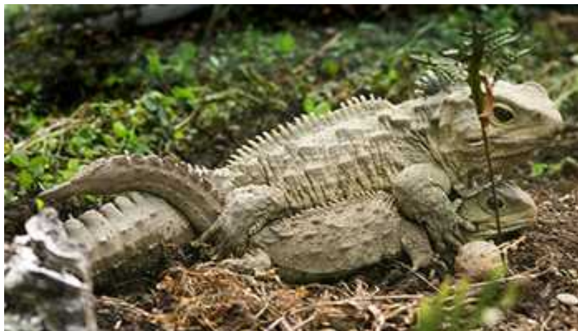
Slika 4. Parenje – rijedak događaj ( http://pinkdogink.com/blog/wp-content/uploads/2009/01/reptile.jpg )

Izvištavajući se da zaključiti da se vrlo malo energije ulaže u razmnožavanje i podizanje mladih. Zato se ona usmjerava na metabolizam, koji je spor, ali koji uzrokuje neobično dugi životni vijek jedinki. Spolna zrelost se dostiže tek sa 15 godina, a krajnja veličina sa 25 do 35 godina. Iako je taj podatak još uvijek misteriozan, tuatara u prosjeku žive 61-71 godinu, a pretpostavlja se da mogu živjeti i više od 100 godina (MacAvoy, 2007.).