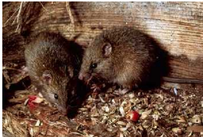
Slika 6. Kiore štakori ( http://www.teara.govt.nz/files/p16116doc.jpg )

Štakori se smatraju najozbiljnijom prijetnjom tuatarama jer se lako transportiraju već spomenutim plovilima, te su najčešće prve alohtone vrste koje neopaženo pristižu na nova staništa. Otoci sa štakorima imaju vrlo malo nokturalnih beskralješnjaka, vodozemaca i gmazova jer, u nedostatku hrane, oni opelješe njihove nastambe odnosno gnijezda, jedu i jaja i tek izlegle mladunce, ali i odrasle jedinke. Odrasli premosnici nemaju prirodnog neprijatelja i štakori ih rijetko napadaju, ali rade štetu za njihov reproduktivni uspjeh, što je za životinju sa usporenim životnim ciklusom i slabom stopom razmnožavanja, prilično pogubno.