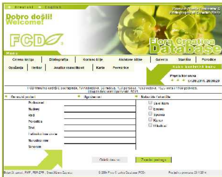
Slika 1. – Internet su elje Flora Croatica baze podataka