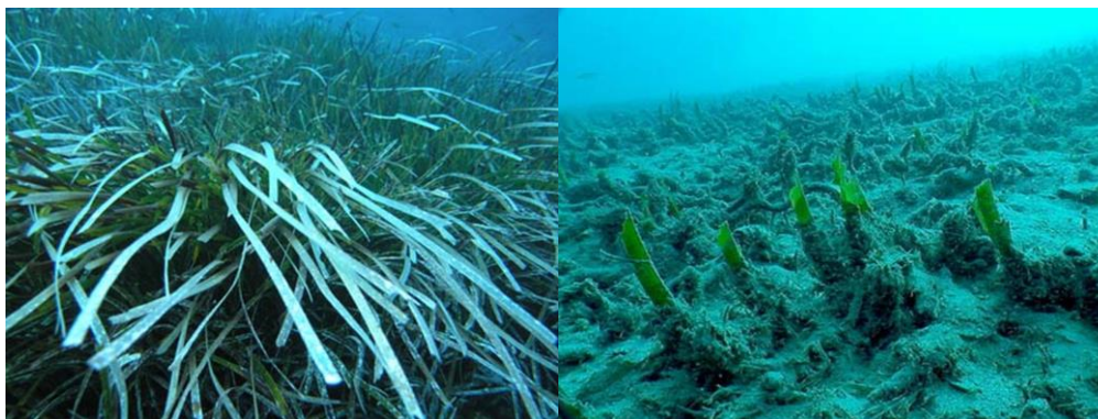
Slika 2. Lijevo: Prirodno stanje Posidonia oceanica ; Desno: Degradirano stanje Posidonia oceanica