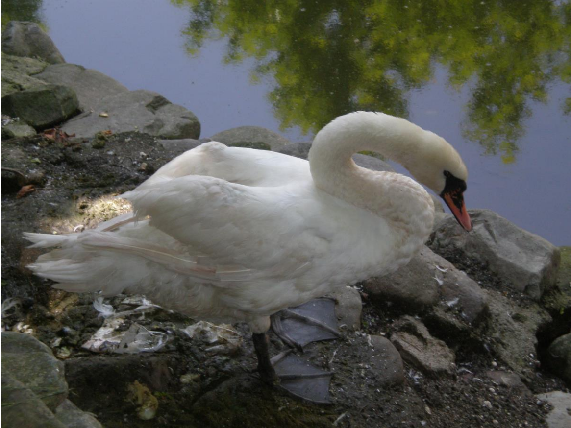
Slika 39. Vrsta Cygnus olor na močvarnom staništu Estil