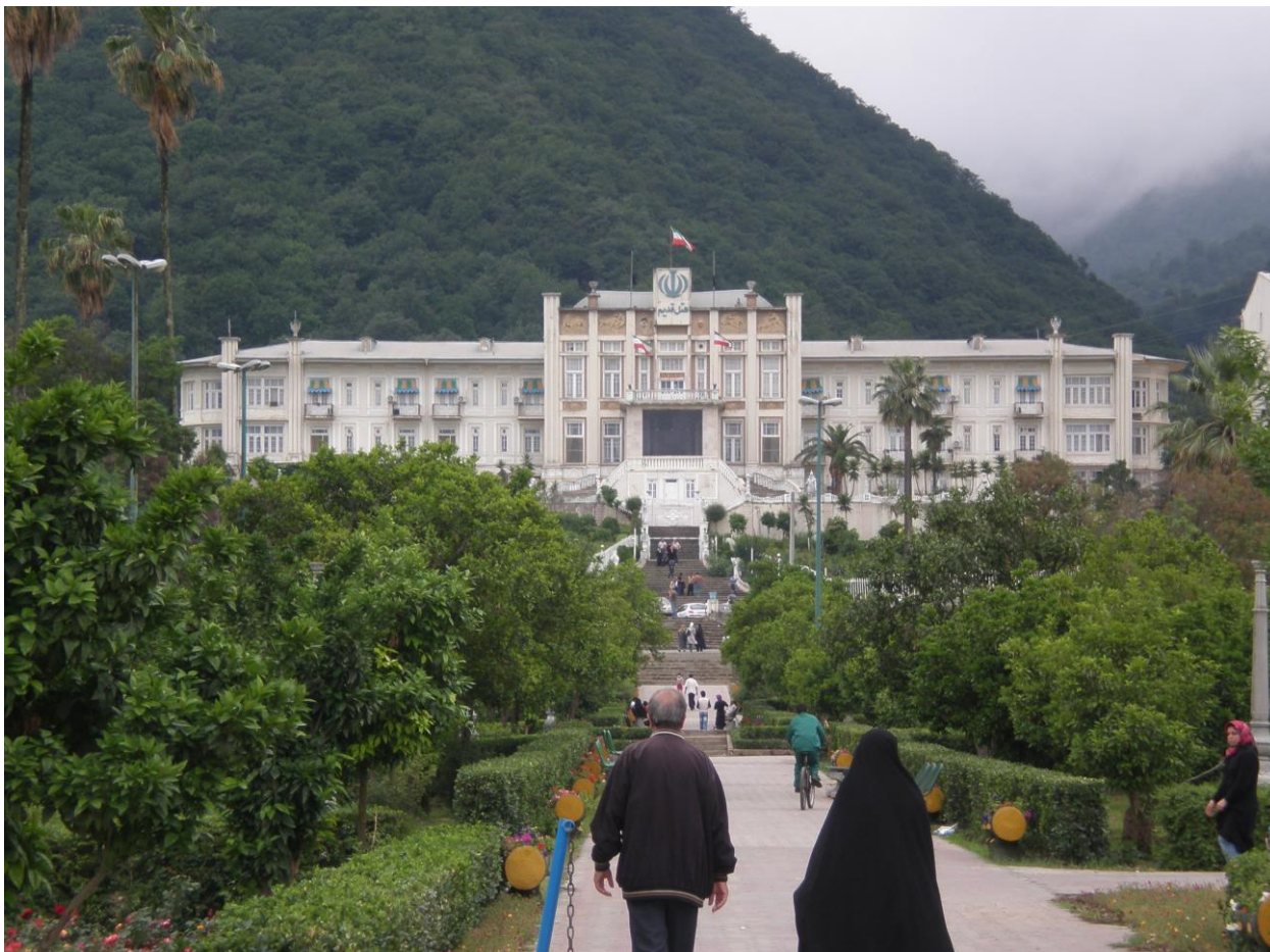
Slika 5. Grand Hotel (bivši Hotel Casino) u Ramsaru u kojem je potpisana Ramsarska konvencija

Grand Hotel (sada nazvan Old Grand Hotel), izgrađen 1934. godine kao ljetovalište Pahlavija, djelo je armenskog arhitekta iranskog podrijetla koji je studirao arhitekturu u Njemačkoj. Iz tog razloga stil hotela je mješavina prije-islamskog perioda i moderne Njemačke. Puno se pažnje posvećuje zaštiti hotela zbog njegove povijesne važnosti kako u Iranu tako i u cijelome svijetu. Glavni problem očuvanja te izuzetno važne građevine je materijal od kojega je izgrađen veći dio hotela - drvo, a vlažnost dijela zemlje gdje se nalazi Ramsar je vrlo velika, upravo zbog blizine Kaspijskog mora.