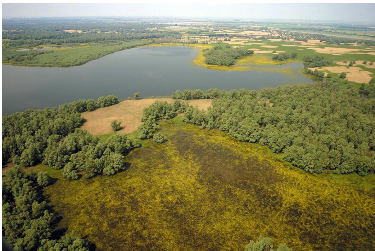
Slika 42. Močvarno stanište Kopački rit

Močvarno stanište Kopački rit smješten je na sjeveroistoku Hrvatske u Osječko-baranjskoj županiji. To je pretežito nizinsko područje između rijeka Drave i Dunava te državne granice s Republikom Mađarskom. Ovaj Park prirode, jedno od najvažnijih fluvijalno-močvarnih nizina Europe iznimne biološke raznolikosti, nastalo je djelovanjem dviju velikih rijeka, Dunava i Drave što za posljedicu ima specifične morfološke i sedimentacijske karakteristike. Izgled ali i opstanak ovog močvarnog staništa uvelike ovisi o intenzitetu poplava pa tako dolazi do mijenjanja oblika staništa ovisno o trenutnoj količini vode. Rijeke i poplavne vode koje plave to područje s jedne strane taložeci nanose stvaraju sprudove, otoke i rukavce dok s druge strane produbljuju teren čime nastaju bare (depresije) i grede (povišena područja), dajući ovom staništu specifičan izgled. Najveće jezero, Kopačko jezero kao i najdublje jezero Sakadaško, povezana su međusobno prirodnih kanalima sa rijekama Dunavom i Dravom.