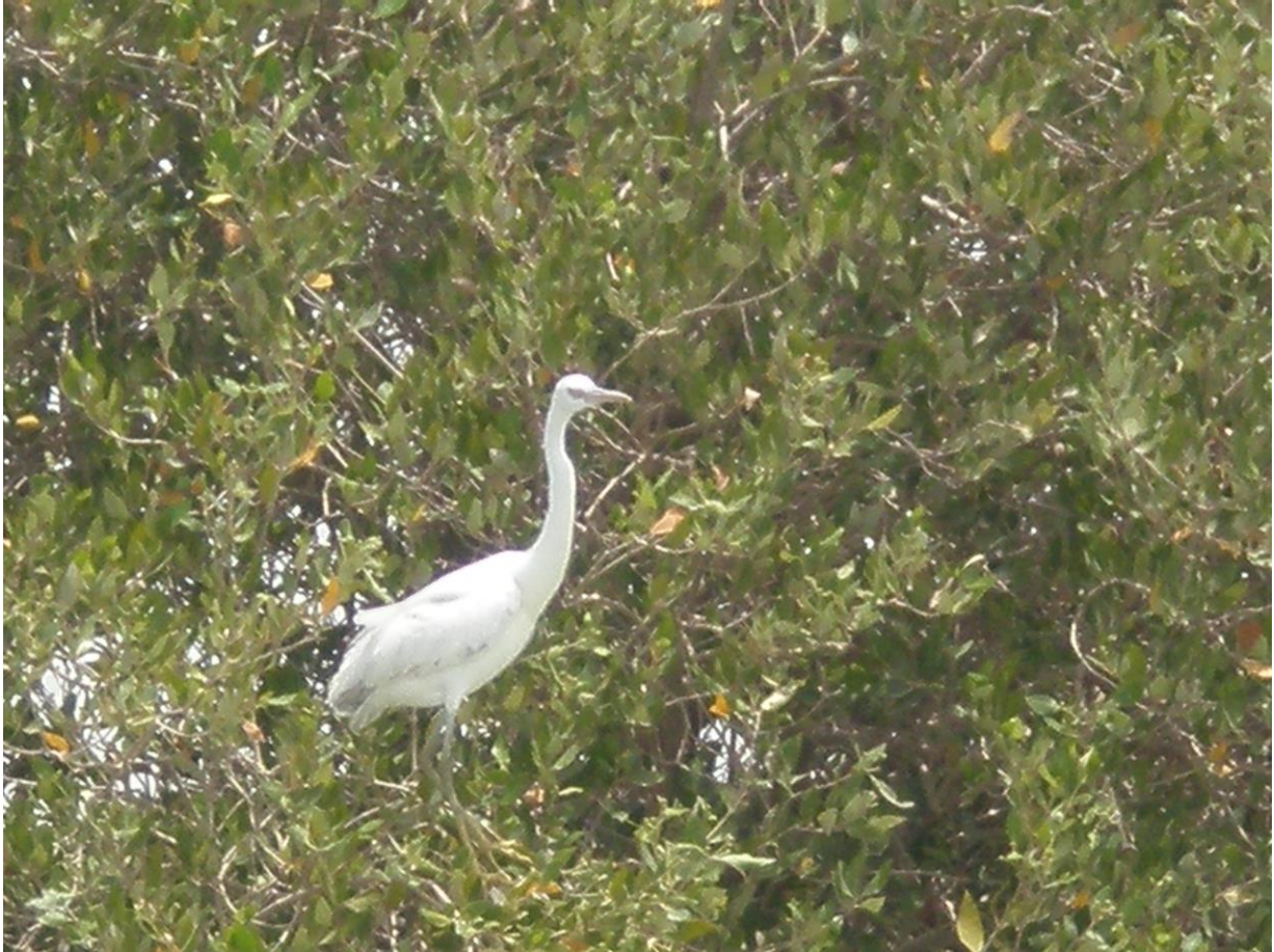
Slika 32. Vrsta Egretta gularis

Smatra se da na ova područja dolaze prezimiti 1,5% vrsta ptica Svijeta kao i 25% iranskih autohtonih vrsta (Ansari 2000).