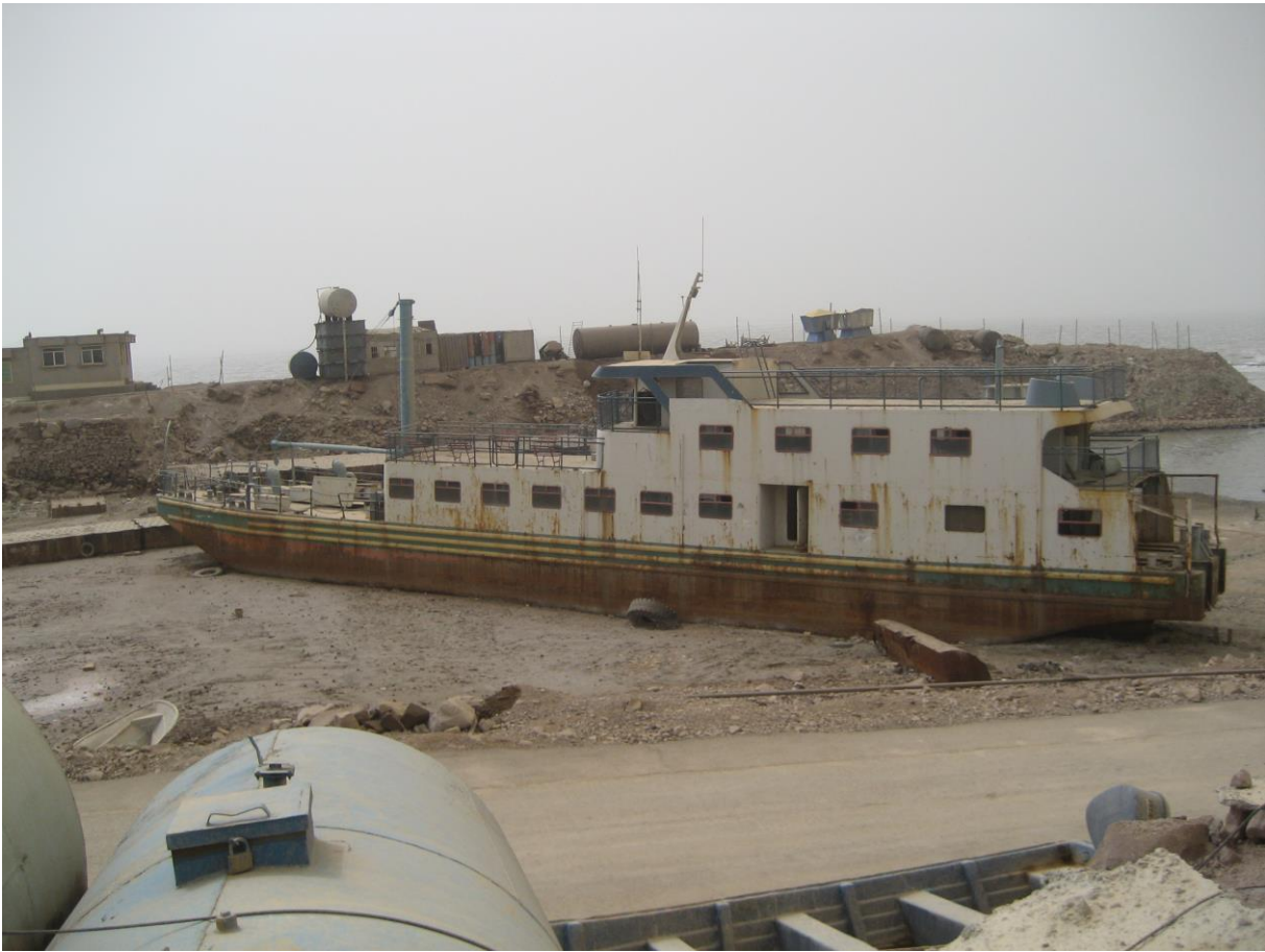
Slika 28. „Nasukani“ brod – smanjenje nivoa jezera