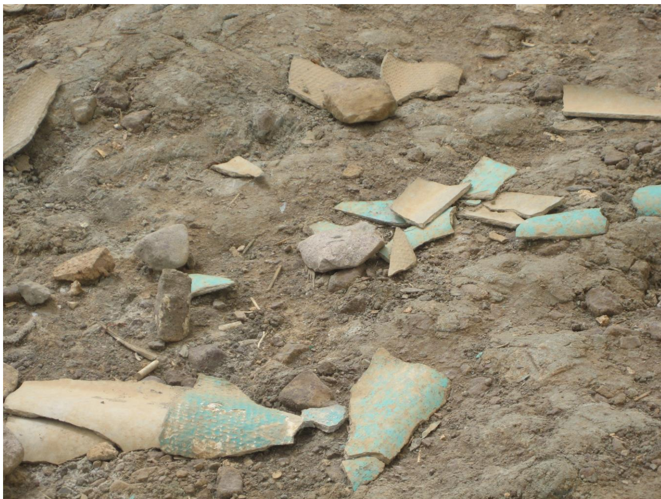
Slika 25. Primjer nebrige za okoliš - azbestni otpad kraj jezera Orumiyeh

1930.-ih godina jezero je nazvano Rezaiyeh po Šahu Rezi Pahlaviju, no naravno 1970.-ih godina, nakon Islamske Revolucije došlo je do promijene imena, ovaj puta u naziv pod kojim ga znamo i danas, Orumiyeh. Nazvano po glavnom gradu pokrajine, originalno značenje sirijske riječi Orumieh je grad vode .