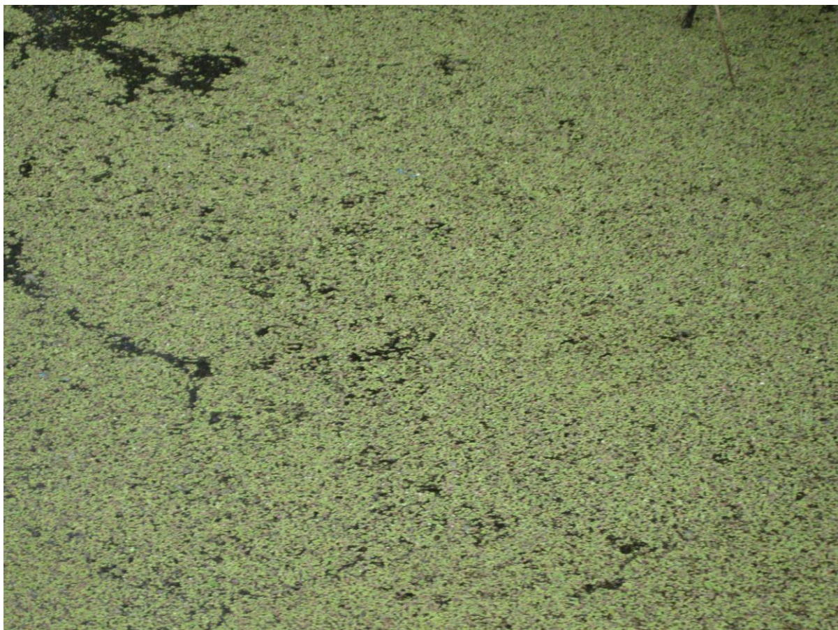
Slika 17. „Tepih“ od vrste Azolla filiculoides

Na gotovo cijelom području močvare također nalazimo vrstu Nelumbium (caspicum) maciferum kao i ostalu plutajuću i podvodnu vegetaciju. Tako je 1989. godine u Anzaliu zabilježena 31 vrsta makrofitske vegetacije. Neke od tih vrsta su: Nymphoides indica , Nymphaea alba , Utricularia vulgaris , Salvinia natans , Hydrocharis morsus-ranae , Hydrocotyle vulgaris , Lemna minor , Lemna trisulca , Lemna polyrhiza , Trapa natans , Limnanthemum verticillatum , Polygonum spp. , Myriophyllum verticillatum , Myriophyllum spicantum , Ceratophyllum submersum , Potamogeton pectinatus , Potamogeton crispus , Elodea nutalli , Ranunculus divaricatus , Sparganium beglectum , Cyperus longus , Sagittaria sagittaefolia i mnoge druge.