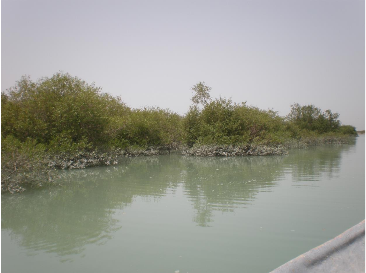
Slika 33. Mangrove šuma – vrsta Avicennia marina

Dominantnu vegetaciju plitkih obalnih voda čine crvene i smeđe alge razreda Rhodophyceae i Phaeophyceae. Također možemo vidjeti i veliki broj jedinki goleme želve Chelonia mydas kojima ova močvara predstavlja glavno mjesto hranjenja, dok južna obala otoka, područje pod nazivom Shibderaz, predstavlja mjesto lijeganja jaja, no ujedno se tamo mogu vidjeti i prekrasni koraljni grebeni.