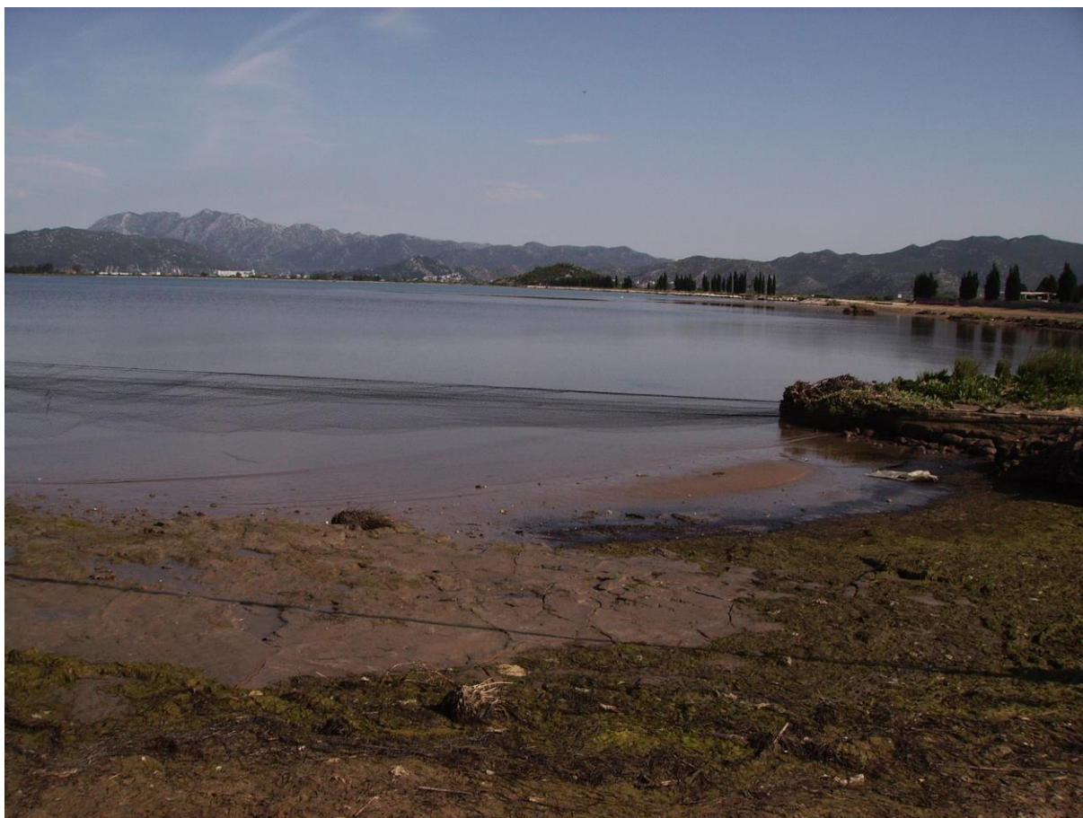
Slika 46. Močvarno stanište delta Neretve

Kao što je to slučaj s većinom ovakvih i sličnih problema na našim područjima, ni u slučaju delte Neretve ne poduzimaju se mjere zaštite pa je tamošnjim je ekološkim udrugama preostalo da očuvaju interese prirode i vrijednosti, što se na kraju krajeve i obvezala Hrvatska potpisujući Ramsarsku konvenciju.