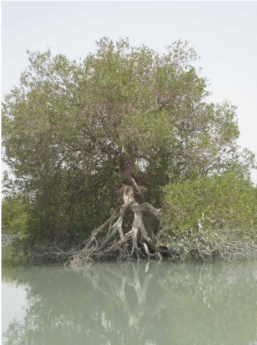
Slika 34. Vrsta Avicennia marina

Ovo močvarno stanište je u državnom vlasništvu i glavne aktivnosti koje se tamo provode su ribolov (poglavito škampi), sječa mangrove šume za dobivanje ugljena i ispaša deva, te turizam koje se u zadnje vrijeme sve više razvija.