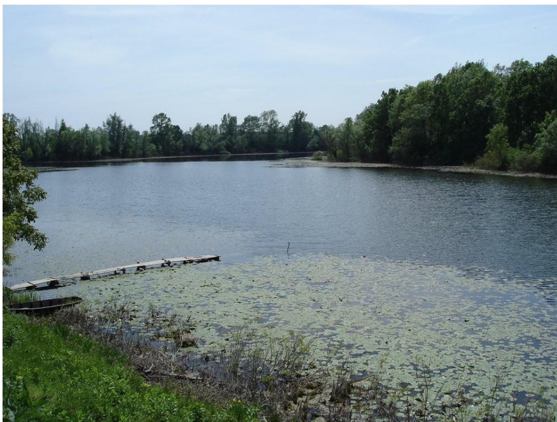
Slika 43. Močvarno stanište Lonjsko polje

Park prirode Lonjsko polje, Mokro polje uključujući Krapje đol, s površinom od 505,60 km 2 (50.560 ha), na Popis močvara od međunarodne važnosti uvršteno je 03. veljače 1993. godine. Lonjsko polje, koje se nalazi u središnjoj Hrvatskoj uz rijeku Savu u blizini grada Siska, predstavlja veliku vrijednost i zbog činjenice da u tom području nalazimo i poseban ornitološki rezervat Krapje Đol u kojemu se gnijezde žličarke, više vrsta čaplji i brojne druge ptice močvarice. Ovo područje je bogato poplavnim šumama hrasta lužnjaka koje predstavljaju vrijedna gnjezdilišta štekavca, orla kliktaša i crne rode, dok poplavni pašnjaci predstavljaju vrijednost u očuvanju tradicionalnog stočarstva a autohtonim pasminama turopoljske svinje i hrvatskoga posavskog konja.