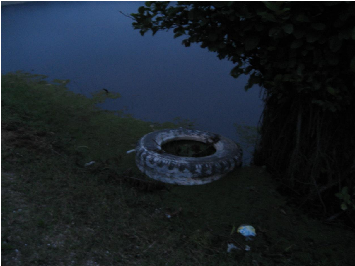
Slika 20. Otpad u močvarnom staništu Anzali

Obale močvare Anzali služe kao mjesto industrijskog i kućanskog otpada okolnog stanovništva, što je uzrokovalo značajno organsko onečišćenje a time i dovelo u pitanje preživljavanje mnogih biljnih i životinjskih vrsta, prvenstveno riba i ptica. Količina otpada koji završi na obalama močvare ili u samoj močvari je prosječno 66 t/dan. Trenutno se vode pregovori o izgradnji sportskog terena na poluotoku u blizini močvare, na što su brojne ekološke organizacije burno reagirale i za sada su pregovori stali. No najveće iznenađenje je bilo prije 4 godine kada su lokalne vlasti, uvidjevši sve veće povećanje prometa na području susjednog grada Rashta, odlučile sagraditi most za autocestu koji bi išao kroz istočni dio močvare. Pripreme za izgradnju su već bile počele, metalni stupovi su bili postavljeni usred močvare, kada je UNESCO zaprijetio da će prestati financirati daljnju zaštitu ovoga područja ukoliko se s radovima ne prestane. EPA (Environmental Protection Agency) je zaustavila ovaj projekt prije 4 godine dok se ne pronađe bolje rješenje za problem pojačanog prometa oko močvarnog staništa Anzali. No metalni se stupovi i dalje nalaze u vodi, ugrožavajući svakoga dana sve više biljni i životinjski svijet koji nalazimo na ovom vrijednom staništu.