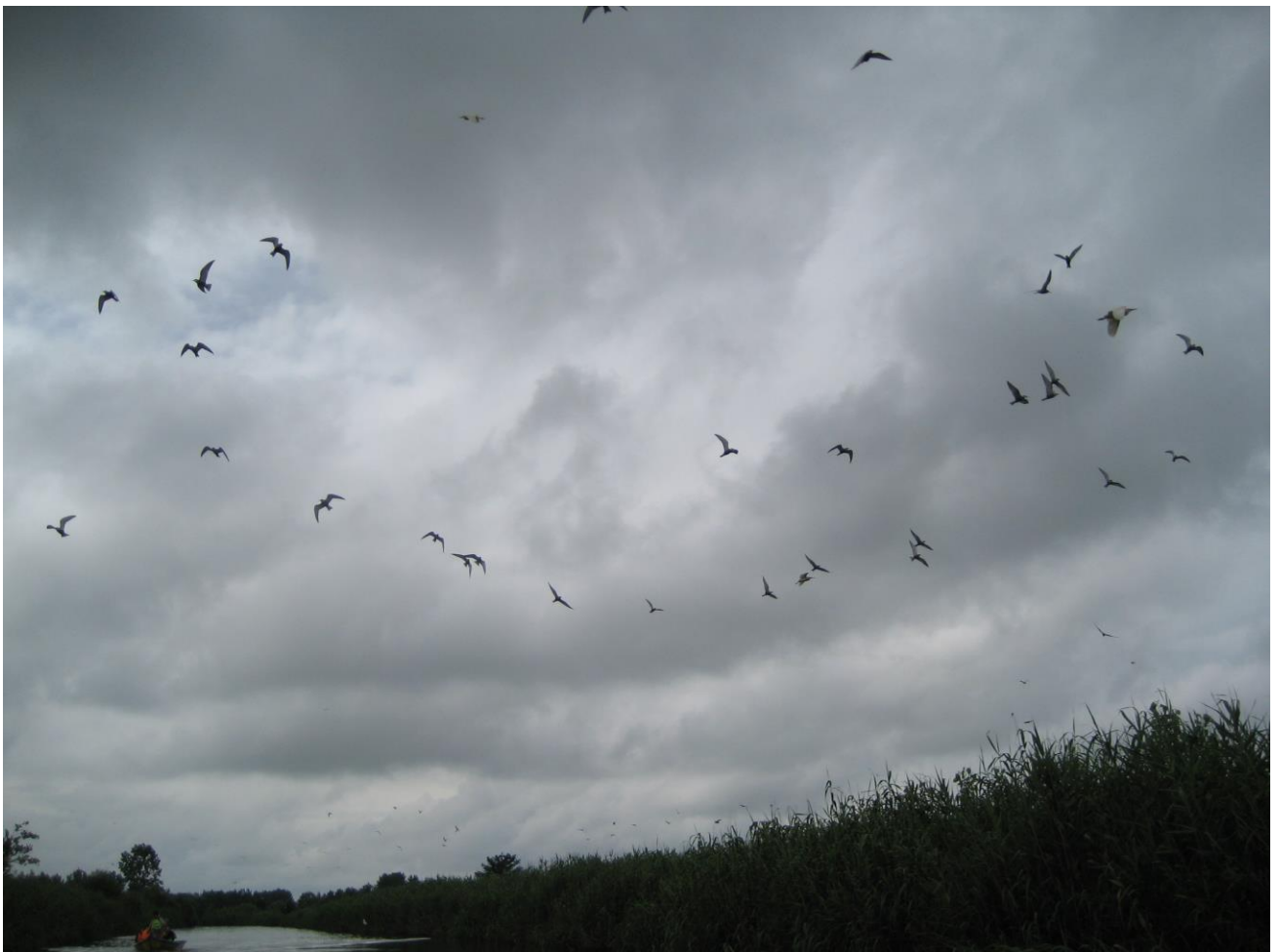
Slika 1. Prizor iz močvarnog staništa Anzali

Močvarna staništa su jedna od najvažnijih ekoloških sustava na svijetu koja nalazimo na svim kontinentima osim na Antartici i u svim klimatskim zonama – od tropa do tundre. Bitna su u biološkom, ekološkom, turističkom ali i ekonomskom smislu. Močvare nastale u starijim geološkim razdobljima proizvele su i sačuvale brojne organske ostatke koje danas imaju ulogu fosilnih goriva o kojima današnje društvo uvelike ovisi. Osim toga, močvare su danas postala staništa i utočišta brojnim ugroženim i zaštićenim biljnim i životinjskim vrstama, čime tim izuzetnim ekološkim sustavima svakako raste vrijednost i važnost.