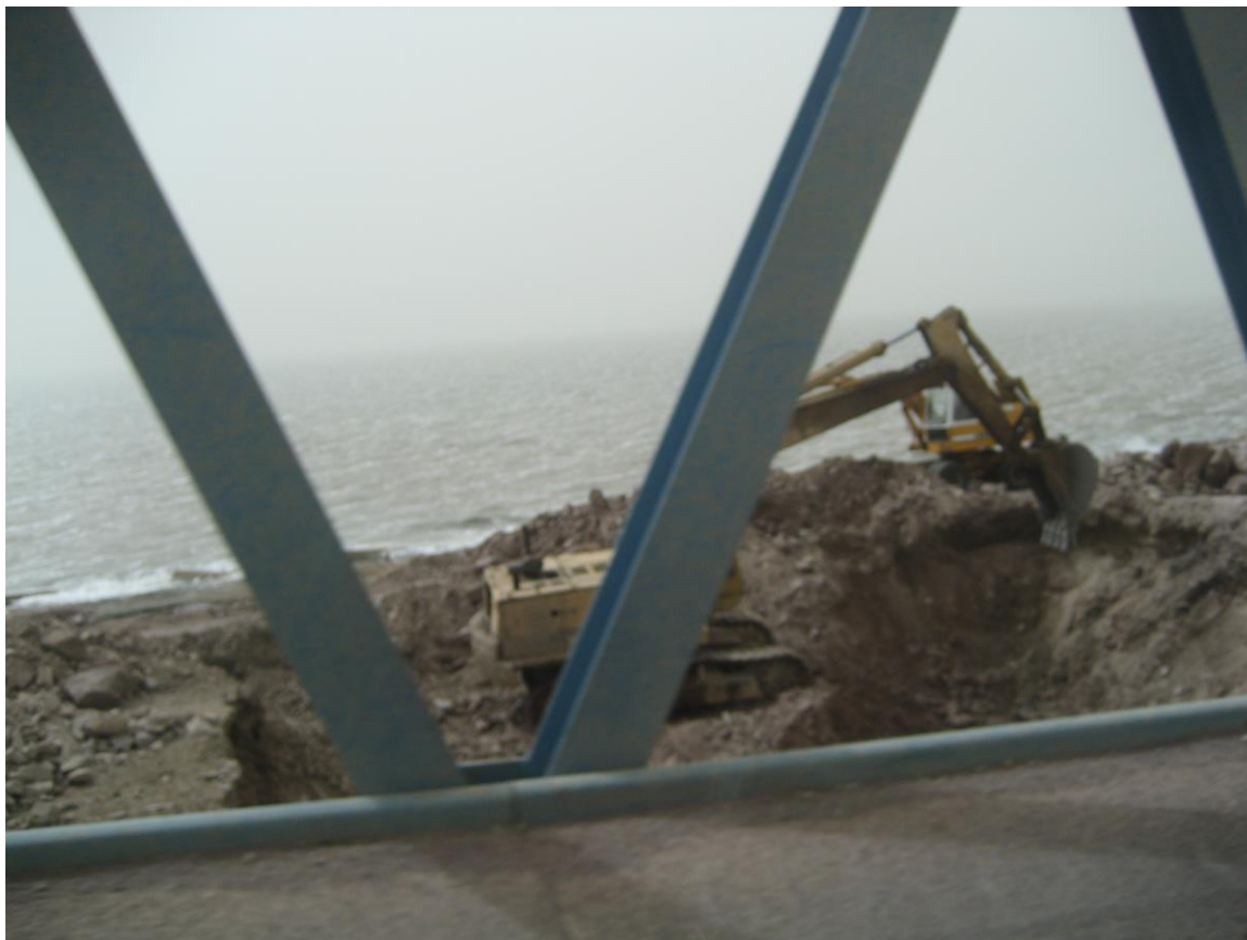
Slika 27. Željezni most preko jezera Orumiyeh

primjećen i novi problem. Zbog izrazito velikog saliniteta jezera, konstrukcija mosta propada zbog izražene korozije, unatoč antikorozivnim sredstvima. U tijeku je projekt renoviranja mosta, no problem korozije će se, sasvim sigurno, stalno javljati zbog izrazito ekstremnih uvjeta toga područja.