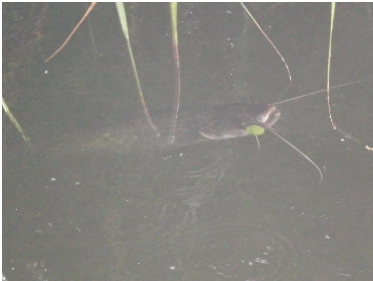
Slika 12. Vrsta Silurus glanis

Abramis brama orientalis , Rutilus rutilus caspicus , Perca fluviatilis i Neogobius melanostomus , Silurus glanis (Firouz 2005).