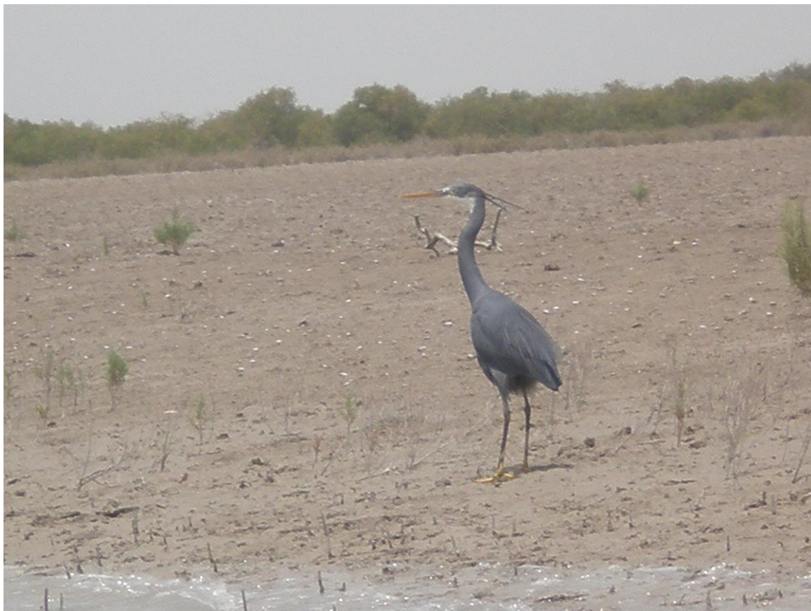
Slika 31. Vrsta Egretta gularis

nalaze i velike kolonije vrste porodice Ardeidae, kao i 20,000 drugih močvarnih ptica poput: Egretta gularis , Platalea leucorodia , Haematopus ostralegus , Dromas ardeola , Numenius arquata , Tringa cinerea , Larus ridibundus , Gelochelidon nilotica , Ardeola grayii , Ardea goliath , Butorides striatus , Dromas ardeola , Burhinus oedicephalus , Sterna saundersi , Gelochelidon nilotica , Mergus serrator , Haliaeetus albicilla , Circus aeruginosus kao i nekoliko vrsta jastreba.