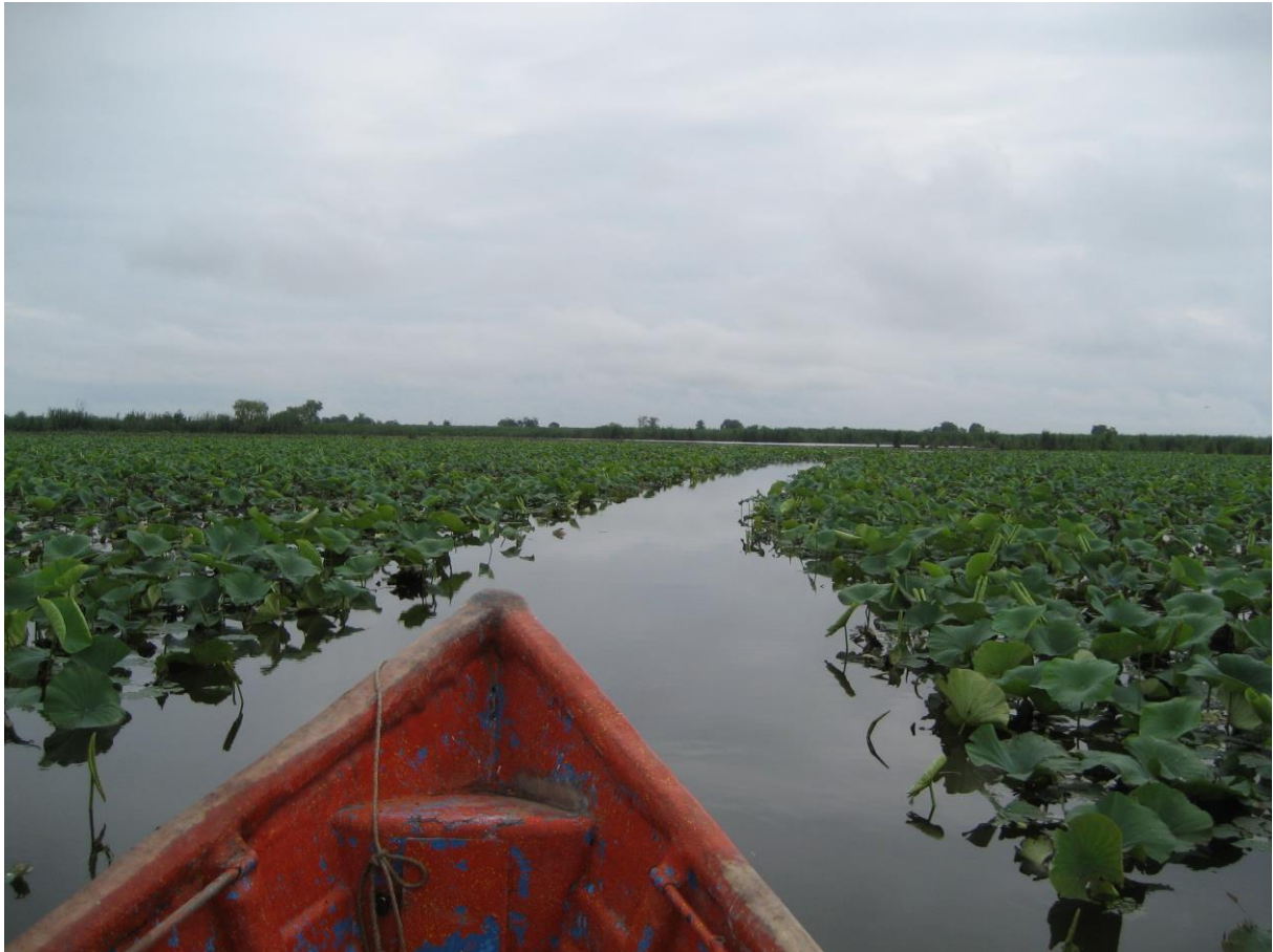
Slika 10. Anzali

Mnogim vrstama riba močvara služi kao mrijestilište a mnogim ugroženim vrstama ptica kao gnjezdilište i refugijalno područje u zimskim mjesecima. Do sada je primijećeno i zabilježeno 140 vrsta migratornih ptica, od kojih 63 vrste dolaze na ova područja radi gniježđenja, 64 vrste radi prezimljavanja, 13 vrsta koriste ovo stanište kao mjesto odmora na njihovom putu migracije. Također je primijećeno i 7 rijetkih vrsta.