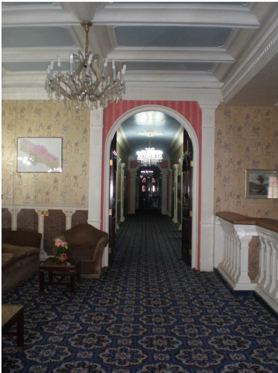
Slika 2. Hodnik ispred konferencijske dvorane u Grand Hotelu

Tekst Konvencije o močvarama od međunarodne važnosti naročito kao staništa ptica močvarica donešen je u Ramsaru, Iranu 2. veljače 1971. godine, dopunjen Protokolom 3. prosinca 1982. godine i Dopunama 28. svibnja 1987. godine. Sadrži 12 članaka s kojima se sve države pristupnice moraju složiti prije potpisivanja konvencije.