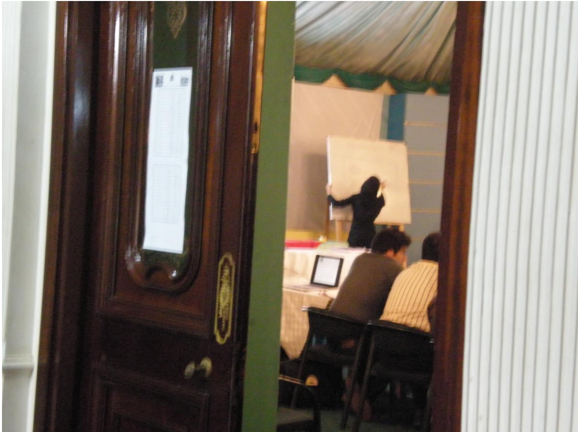
Slika 3. Dvorana u kojoj je potpisana Ramsarska Konvencija

Odmah na početku Konvencije, u članku 1. Definiraju se močvarna područja kao " područja močvara, bara, tresetišta ili voda, bilo prirodna ili umjetna, stalna ili privremena, sa vodom stajaćicom ili tekućicom, boćatom ili slanom, uključujući morsku vodu, čija dubina za oseke ne prelazi šest metara. "