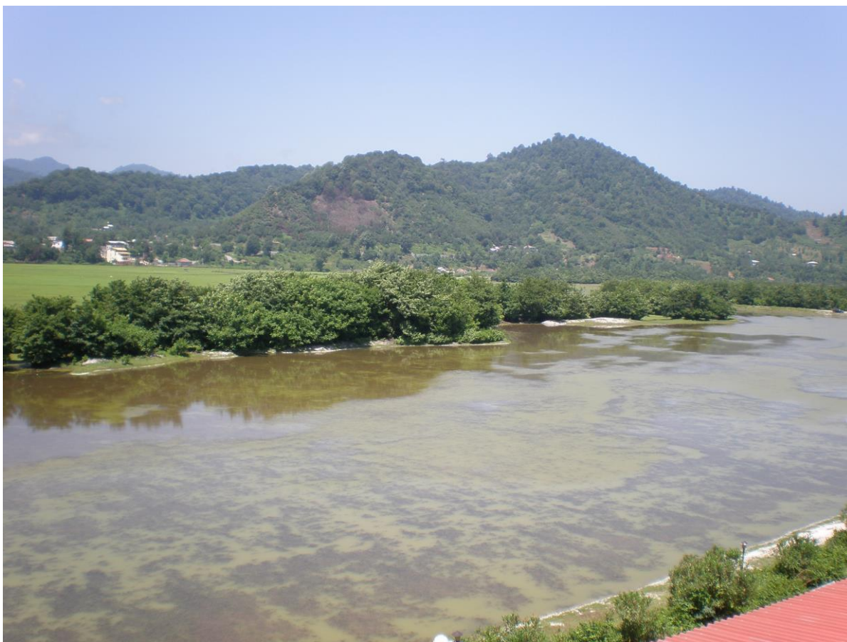
Slika 37. Močvarno stanište Estil

Tijekom terenskoga rada koji sam obavila istraživajući i skupljajući informacije za izradu ovog diplomskog rada, posjetila sam tri močvarna staništa koja se nalaze na Popisu močvara od međunarodne važnosti, no osim tih močvara posjetila sam i neke druge močvare koje, iako se ne nalaze još uvijek na Popisu, zasigurno su od velike važnosti za bioraznolikost.