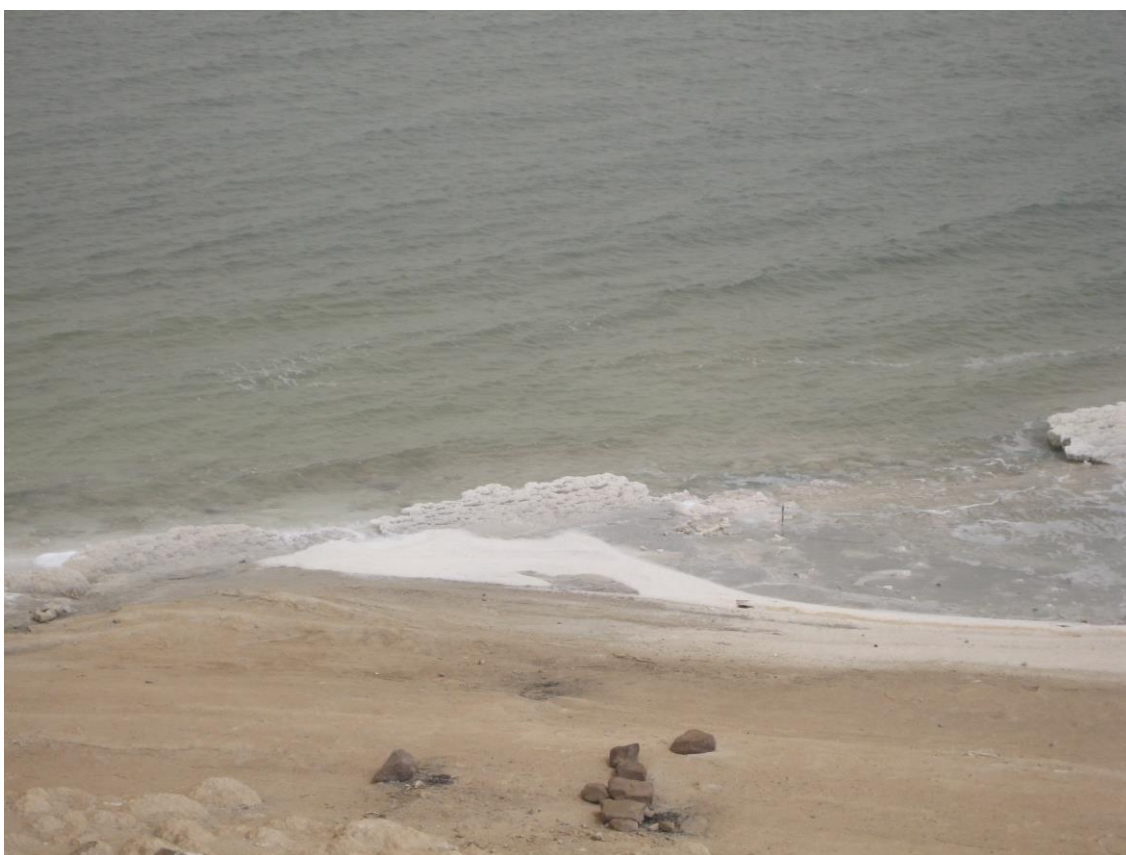
Slika 24. Jezero Orumiyeh – slojevi soli

Jezero Orumiyeh, na perzijskom ارومیه دریاچه, je slano jezero na sjeverozapadu Irana blizu granice s Turskom. Nalazi se između dvije provincije, Istočnog i Zapadnog Azerbejdžana. S površinom od 5.200 km 2 , jezero Orumiyeh se nalazi na prvom mjestu po veličini slanih jezera u Iranu, a na drugom mjestu na Zemlji, sa salinitetom od 200g/L. Najveća dubina je 16m, dužina mu je na najdužem dijelu 140 km a širina 55 km.