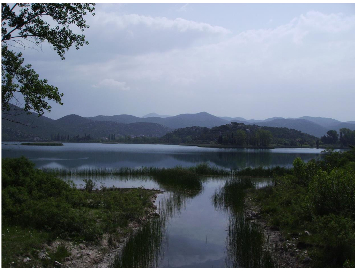
Slika 45. Močvarno stanište delta Neretve

Donji tok Neretve uključuje pet zaštićenih područja površine 16.2 km 2 (1620 ha): ornitološki rezervati Pod Gredom, Prud i Orepak, ornitološki i ihtiološki rezervat Doline Neretve te zaštićena područja Modro Oko i jezero Desne. Također Jezera Kuti i Parila su predložena kao ornitološki i ihtiološki rezervati a cijelo područje Doline Neretve predloženo je da bude dvanaesti Park prirode u Republici Hrvatskoj.