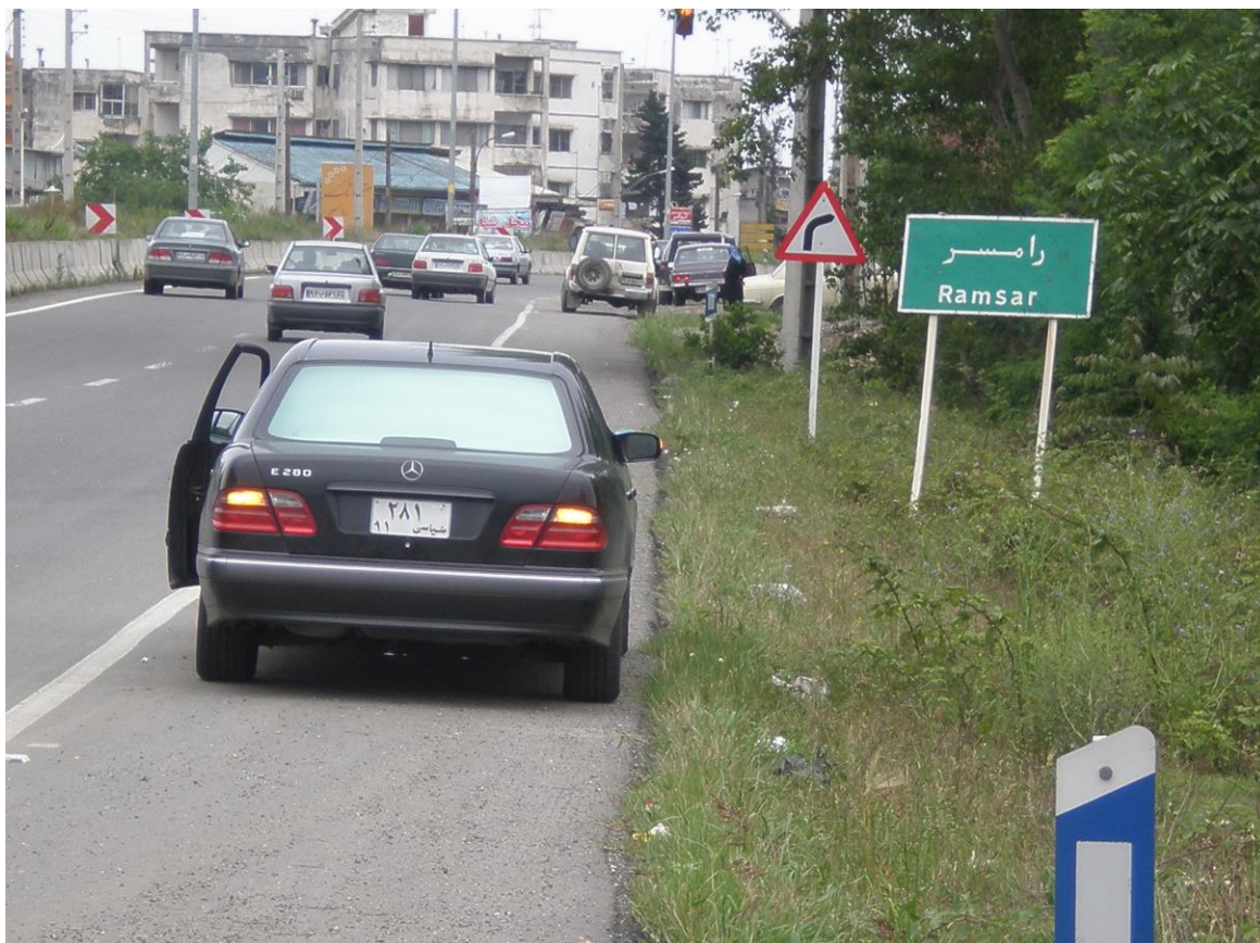
Slika 4. Stari dio Ramsara

Jedan od gradova koji se svakako isplati spomenuti je Ramsar – grad koji se nalazi u provinciji Mazandaran na obali Kaspijskog mora. Poznat je u Iranu ali i u cijelome svijetu zbog mnogo razloga. Jedinstven je zbog izuzetnog krajobraza koji uključuje šume, brežuljke i naravno obalu Kaspijskog mora. Udaljenost šumovitih brežuljaka i Kaspijskog mora je samo jedan kilometar. Takav prekrasan krajobraz omogućuje život raznovrsnoj flori i fauni i utočište je mnogim ugroženim životinjskim vrstama kao što su medvjedi, leopardi, koze, lisice, zečevi i vukovi. Također su zabilježena viđenja tigrova vrste Panther tigris virgata – kaspijski tigar, u šumama grada Ramsara. Obala Kaspijskog jezera bogata je palmama, stablima naranča, voćnjaka limuna i kivija i brojnim drugim biljnim vrstama.