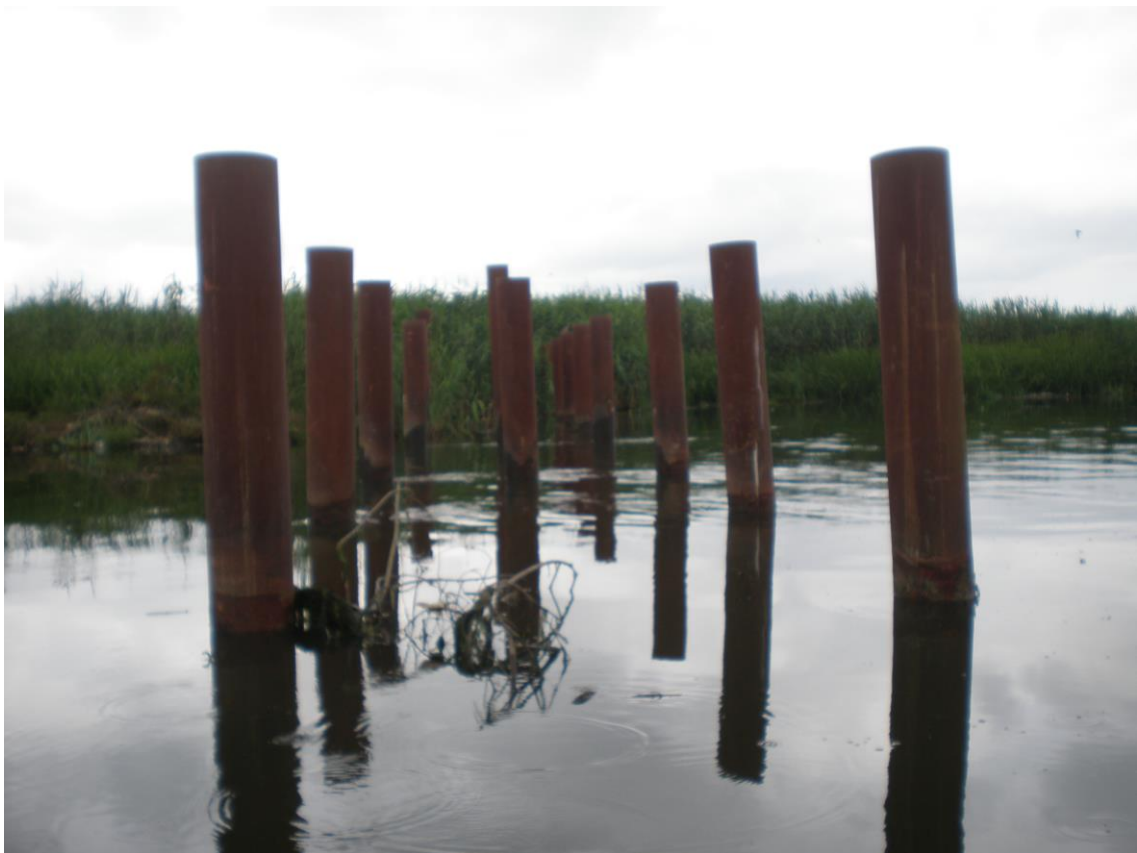
Slika 22. Početak gradnje mosta kroz močvaru