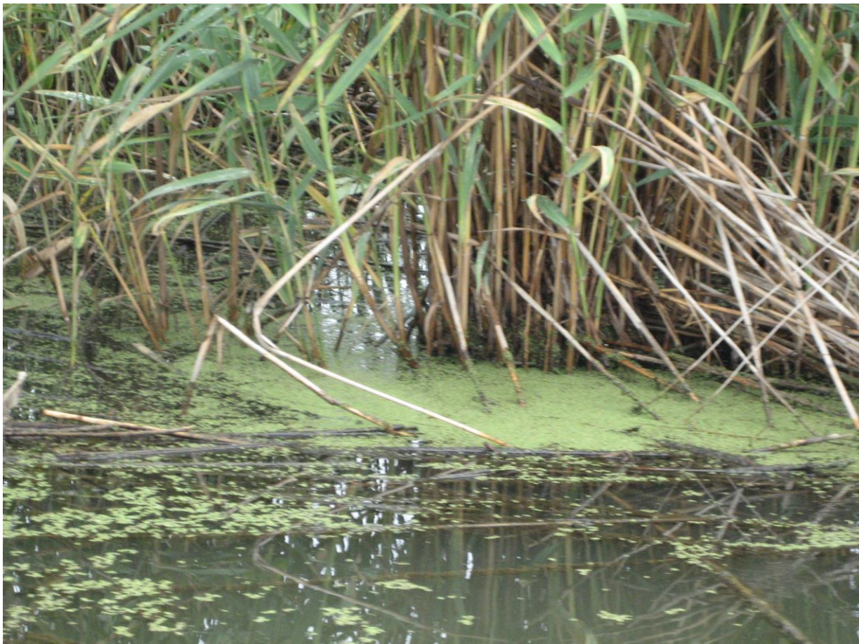
Slika 15. Vrste Phragmites australis i Azolla filiculoides

No porastom razine vode posljednjih desetak godina došlo je do promjene u brzini širenja vrste Phragmites australis . Naime, od 1978. godine je primijećen porast razine vode u Kaspijskom jezeru od 1.8m, što je za rezultat imalo i porast razine vode u močvare Anzali od 1 m. Time se povećao dotok slane vode tijekom ljetnih mjeseci kada je razina vode u Kaspijskom jezeru najviša a dotok slatke vode najmanji. Stručnjaci smatraju da će to povišenje razine vode i saliniteta utjecati da daljnje širenje ove vrste, no zasada još nisu zabilježene nikakve značajne promjene. Salinitet iranskog dijela Kaspijskog jezera iznosi 12 ppt, dok u ruskom dijelom salinitet je 3-5 ppt.