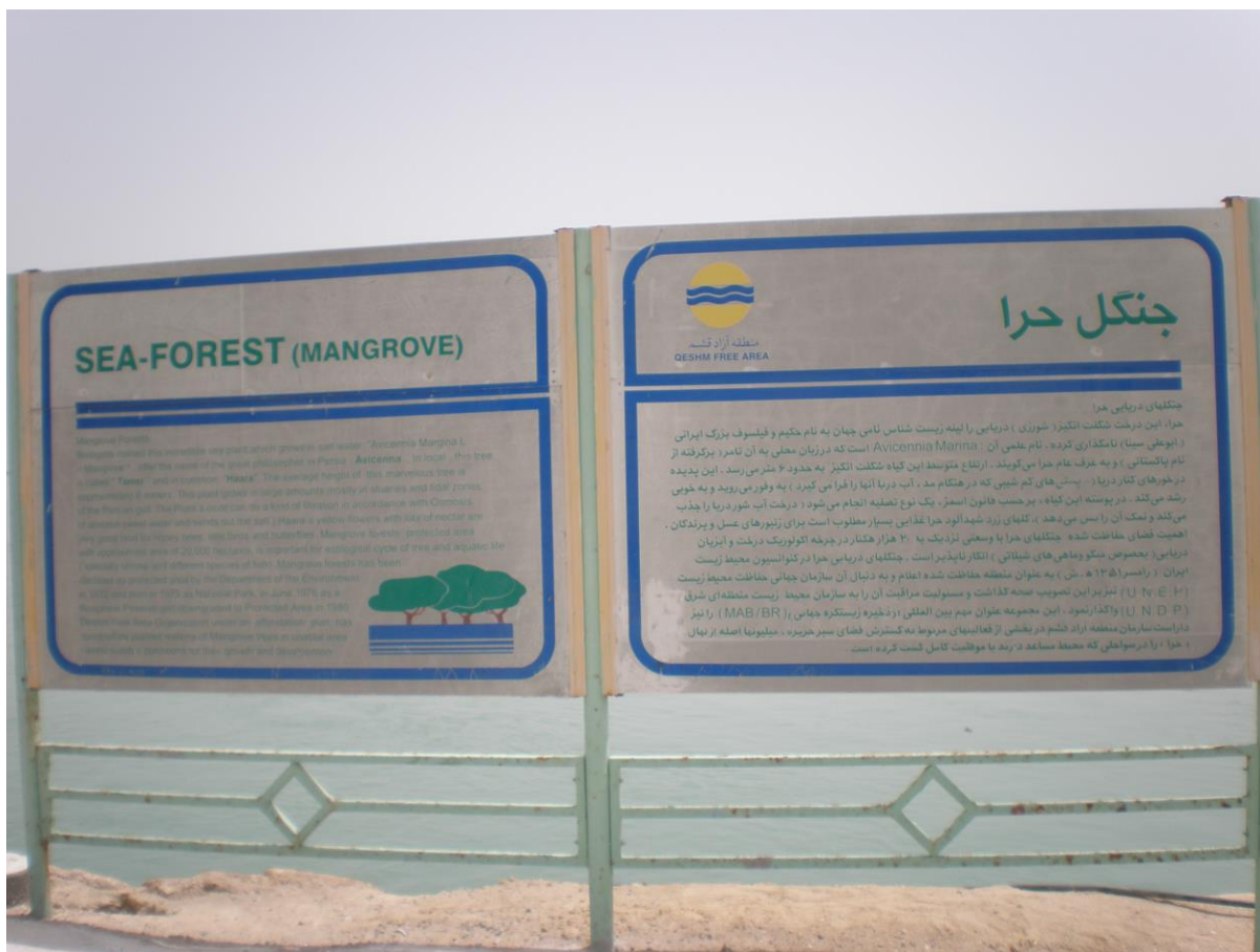
Slika 29. Tabla na ulazu u Khuran Straits park

Khuran Straits, močvarno stanište u južnom dijelu Perzijskog zaljeva, nalazi se u provinciji Bandar Abbas, u blizini otoka Qeshm. S površinom od 1000 km 2 (100.000 ha), na Popis močvara od međunarodne važnosti ovo močvarno stanište uvršteno je 23. lipnja 1975.