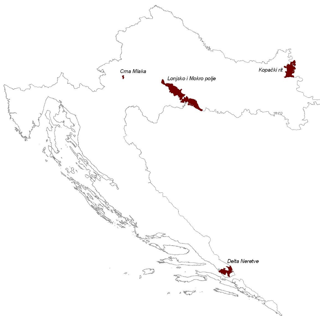
Slika 6. Močvarna staništa u Hrvatskoj zaštićena Ramsarskom Konvencijom

Time je poprilično očito da ne samo da Hrvatska čini sve što može da provodi načela Konvencije, nego je to i pozitivan znak njenoj politici s obzirom da Hrvatska još nije član Europske Unije.