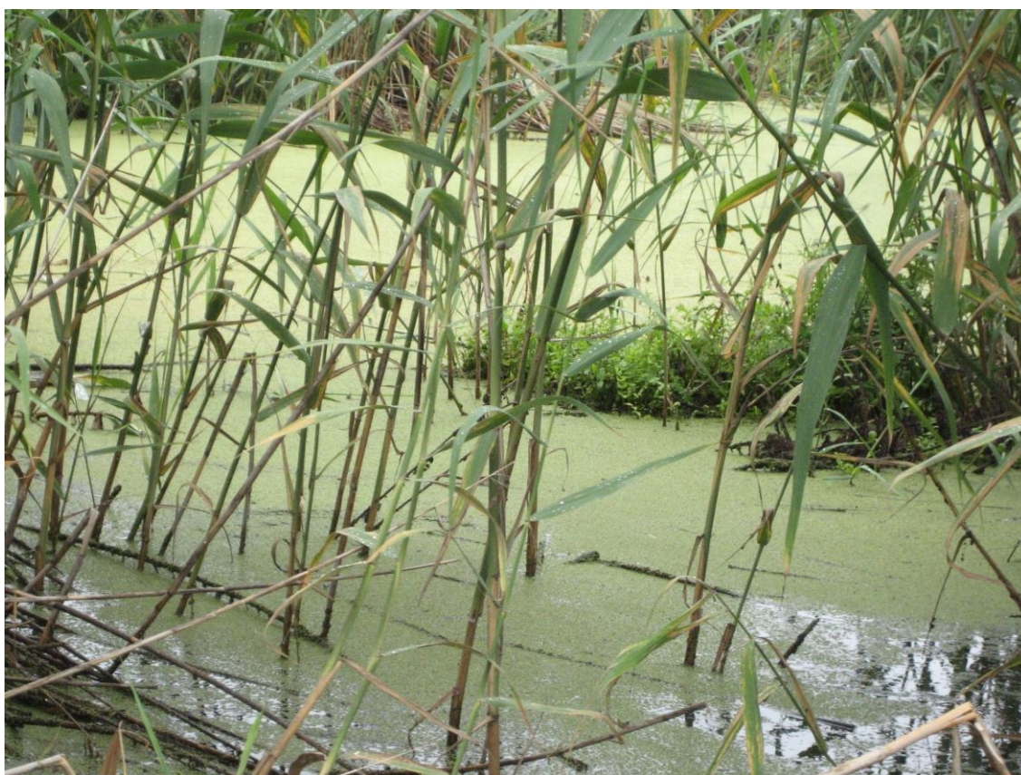
Slika 16. Vrste Azolla filiculoides i Phragmites australis

Ova vrsta vodene paprati je značajna po brzom širenju i do čak 2.5 t/ha u 24 sata kojem je pridonjela i velika količina nutrijenata bogatog močvarnog staništa. Zbog toga ona trenutno prekriva veći dio močvare, pa iako se još uvijek ne znaju posljedice unosa ove alohtone vrste, primjećuje se smanjenje brojnosti vrsta Trapa natans i Nelumbium maciferum koje predstavljaju glavi izvor hrane za mnoge močvarne ptice. Također se primjećuje pad u brojnosti određenih vrsta riba kao rezultat pojačane eutrofikacije uzrokovane ovom vrstom paprati. Naime, vrsta Azolla filiculoides prekriva znatan dio vodene površine, a njezinim odumiranjem i razgradnjom može doći do pojave anoksije te se povremeno osjeti jaki miris H 2 S. Ta smanjena količina otopljenog kisika potrebnog za život riba, uzrokuje zanimljivo ponašanje jegulja ovoga područja. Naime, zbog nedostatka kisika u vodi, može se primijetiti povremeno iskakanje jedinki ove vrste ribe iz vode, što koriste močvarne ptice hvataju i iskoriste kao hranu. No makar se radi o invazivnoj i vjerojatno štetnoj vrsti, pozitivna je činjenica da se koristi kao stočna hrana.