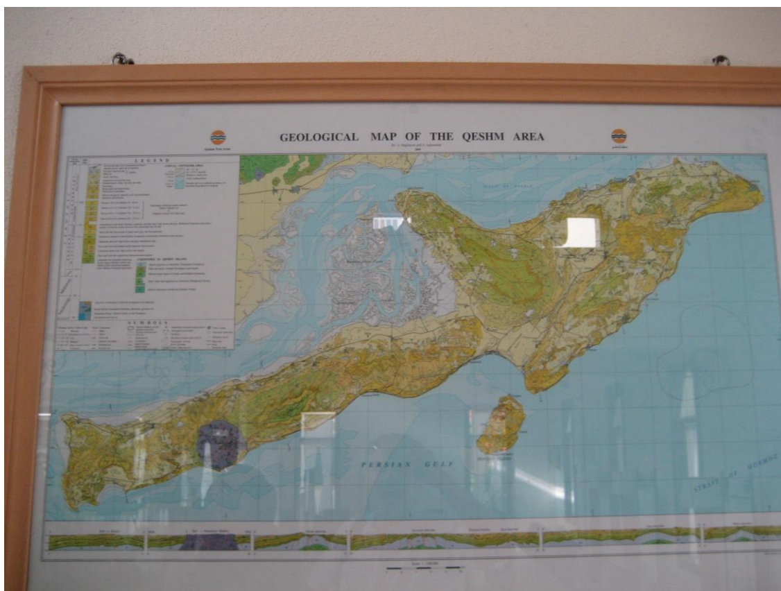
Slika 35. Geološka karta otoka Qeshma

No i na ovim područjima, kao i u ostatku Irana, javljaju se problemi nezakonitih aktivnosti, kao što su prekomjerna sječa mangrove šume u svrhu dobivanja ugljena i prekomjerna ispaša deva čime se ugrožava bioraznolikost i opstanak ove močvare. Osim navedenih problema, zabilježeno je i sve veće onečišćenje zbog blizine luke Bandar Abbas i rastućih turističkih aktivnosti (Darvishsefat 2006).