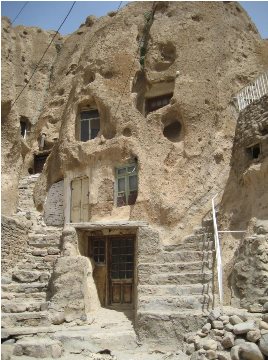
Slika 26. Tradicionalno selo Kandohan na putu za jezero Orumiyeh – kuće u stijeni

Kao i u mnogim drugim slučajevima, jasno je da nažalost iranske vlade, prije i nakon Islamske revolucije nisu bili svjesni ljepote koju iranska močvarna staništa sadrže. Primjer toga može se vidjeti u činjenici da je 1970.-ih godina pokrenut projekt za izgradnju autoceste preko jezera. Radovi su počeli i do Islamske Revolucije 1979. godine izgrađen je 15 km dug most, no kada je državu potresla Revolucija, radovi su stali. Projekt je ožvijen 2000. godine i završen je u studenom 2008. godine, čime je dodano 1.5 km mosta koje je ostalo nedovršeno nakon Revolucije. Most danas povezuje gradove Tabriz i Orumiyeh, razdvajajući jezero na dva dijela – sjeverni i južni dio. Dok je taj projekt donio pozitivne promjene u turizmu, omogućujući bolju dostupnost prirodnim ljepotama jezera, s druge strane zabilježeni su brojni negativni učinci na okoliš zbog sve većeg prometa preko jezera. Također danas je