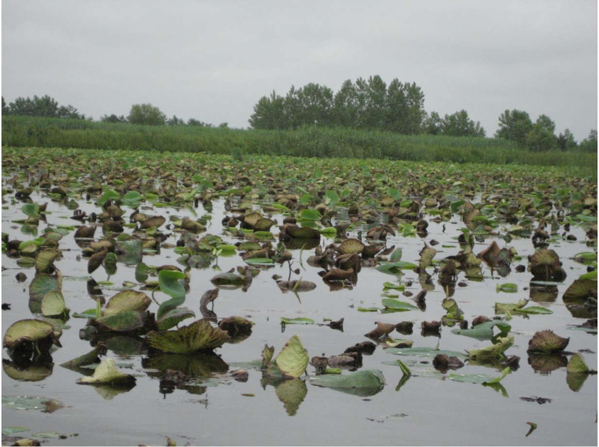
Slika 13. Močvarno stanište Anzali – vrsta Nelumbium maciferum (simbol Irana)

Porast razine vode u Kaspijskom jezeru u zadnjih 10 godina je uzrokovao značaj poras razine vode u močvari Anzali i okolnim područjima, a time su se promijenile određene ekološke karakteristike ovoga područja i spriječila se provedba određenih rehabilitacijskih programa za neke ugrožene vrste koji su se trebali provesti posljednjih godina.