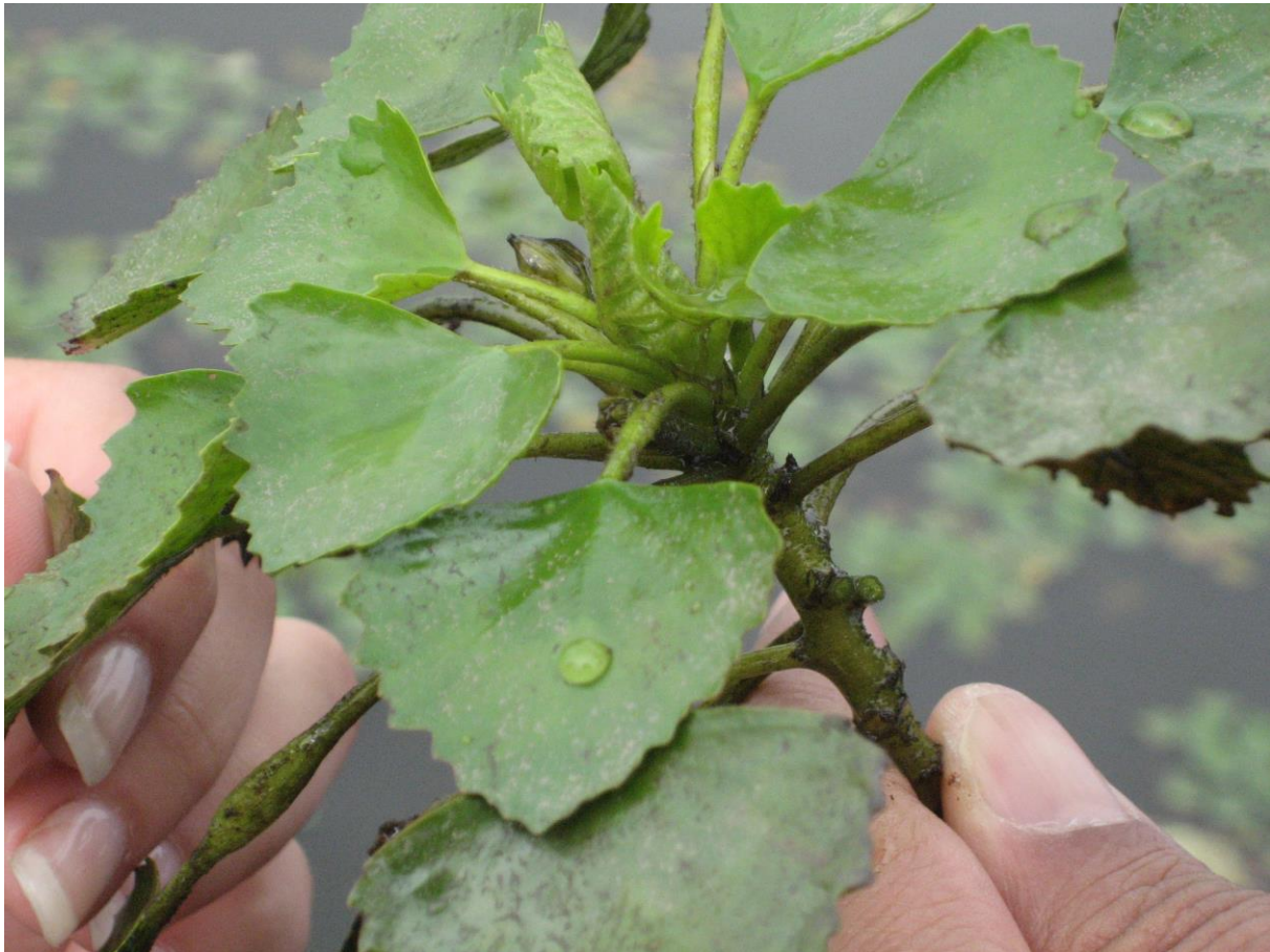
Slika 18. Vrsta Trapa natans

Na višim terenima i duž riječnih nasipa nalazimo vrste Alnus glutinosus i Salix sp. Na sjeveru granicu čine, kao što je već spomenuto, pješčani prudovi s travnjacima i karakterističnom vegetacijom, dok na jugu granicu čine kultivirana polja riže i područja šume.