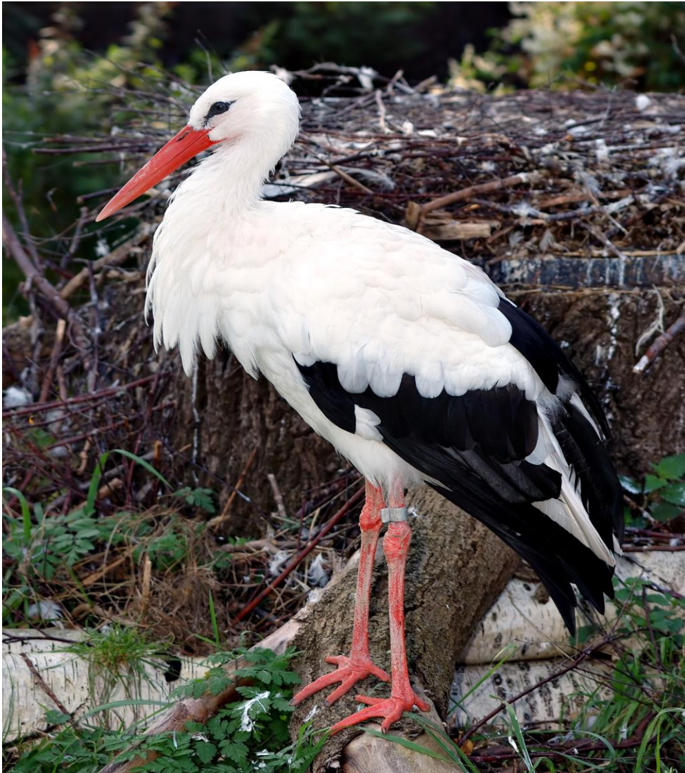
Slika 44. Vrsta Ciconia ciconia