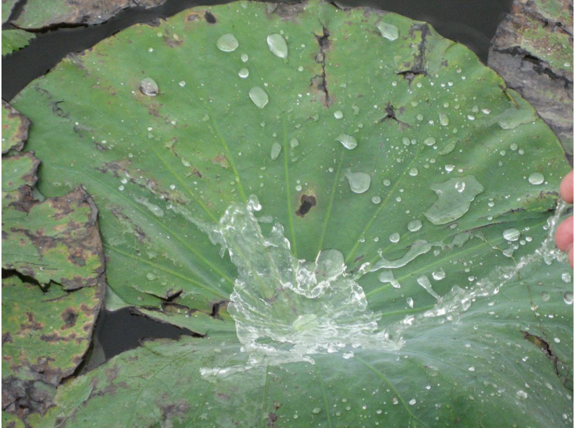
Slika 14. Vrsta Nelumbium maciferum

Dominantna vegetacija koja se proteže cijelim kompleksom Anzali močvare je svakako trska, Phragmites australis koja na pojedinim mjestima može narasti i do 6m u visinu. Ova vrsta se počela intenzivno širiti 1960.-ih godina zbog tadašnjeg pada razine vode u Kaspijskom jezeru i ubrzane eutrofikacije što je i rezultat pojačanog dotoka kanalizacije iz susjednih područja, hranjivih soli i ostalog organskog materijala. Do 1980.-ih godina gotovo cijeli istočni i središnji dio močvarnog staništa je bio pokriven trskom. Situacija je postala toliko ozbiljna i zabrinjavajuća da su se 1970.-ih godina uključili i DOE (Department of Environment) koji i danas upravljaju ekološkim menadžmentom ovoga staništa, kako bi došli do rješenja kojim bi kontrolirali daljnje širenje ove vrste.