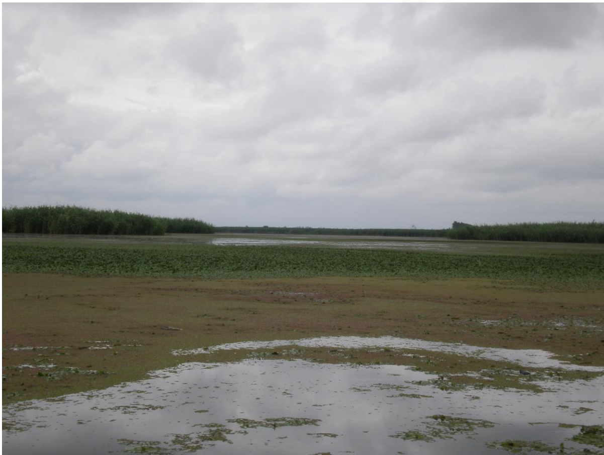
Slika 11. Močvarno stanište Anzali – vrste Azolla filiculoides i Nelumbium maciferum

Neke od tih vrsta su Porphyrio porphyrio , Chlidonias hybridus , Phalacrocorax pygmaeus , Pelecanus onocrotalus , Pelecanus crispus , Anser erythropus , Oxyura leucocephala , Halieetus albicilla , Aquila heliaca , Anas crecca , Fulica atra , Anas querquedula , Aquila clanga , Falco peregrinus , Falco cherrug , Falco columbarius , Falco naumanni , Asio flammeus , Circus aeruginosus , te šest vrsta iz porodice Ardeidae i mnoge druge vrste močvarnih ptica. Razlog tako velikog broja vrsta migratornih ptica na ovom području je ekološki vrlo bitna činjenica da se močvarno stanište Anzali nalazi na križanju dvaju migratornih puteva; Afričko-Euroazijski put i Azijsko-Pacifički migratorni put ptica.