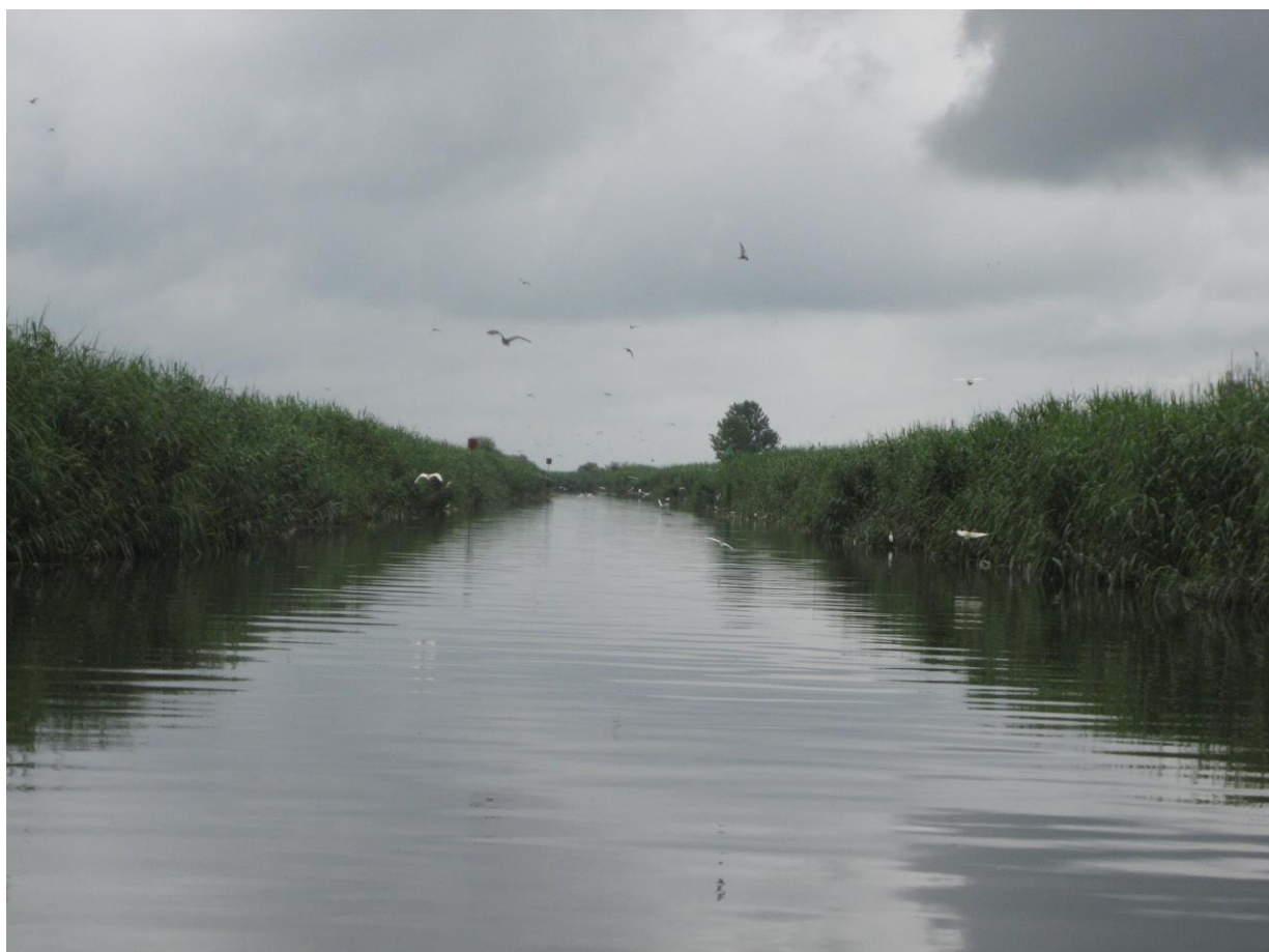
Slika 9. Močvarno stanište Anzali-jedan od kanala

Močvarno stanište Anzali, انزلی بندر, je veliki kompleks slatke vode u provinciji Gilan, na sezonsko poplavljenim jugozapadnim ravnicama obale Kaspijskog jezera, u blizini tisućugodišnjeg grada i luke Bandar-e-Anzali ili kako je bio poznat prije Islamske Revolucije, Bandar-e-Pahlavi. Sa vijećnicom koja je prva sagrađena u Iranu upravo u ovoj luci, grad, kao i samo ime ima bogatu povijest. Ime Anzali potječe od Arapa koji su kao vojnici prolazili ovim dijelom Irana na putu njihovih osvajanja. Riječ anzal , tj. njegova izvedenca na arapskom znači stop , što je zapovjednik tadašnje arapske vojske rekao svojim vojnicima kada su stigli brodovima u ovu luku. Tisuću godina nakon toga, ime Anzali nije promijenjeno.