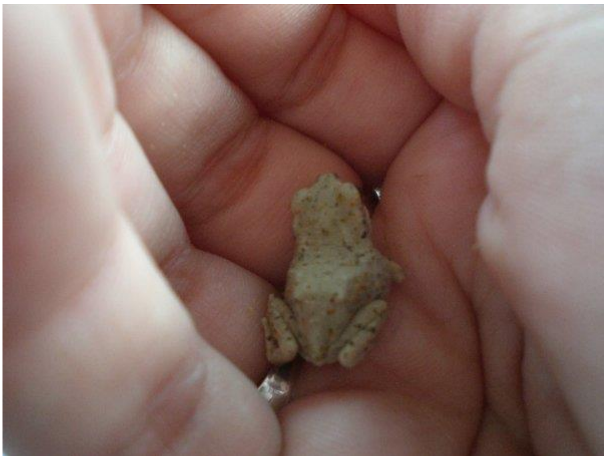
Slika 36. Jedini vodozemac na otoku

Što se tiče faune, osim navedenih vrsta močvarnih ptica koje prezimljavaju na ovim područjima i mnogih vrsta riba kojima ova močvara predstavlja područje mrijesta, česte su i mnoge vrste sisavaca, gmazova od kojih i neke vrste otrovnih vodenih zmija i razne vrste člankonožaca.