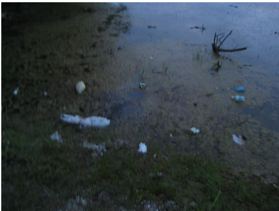
Slika 19. Otpad u močvarnom staništu Anzali

Godine 1970., sa željom da se pojača zaštita ugroženih močvarnih ptica u Anzali-ju, DOE (Department of Environment) je proglasilo rezervatom i utočištem za biljni i životinjski svijet dio močvare pod nazivom Selke Ab-bandan, veličine 3.6km 2 (360ha) (Darvishsefat 2006). Također je ovo iznimno bogato i vrijedno močvarno stanište svjetska organizacija Birdlife International prepoznala kao važno stanište za ptice (Important Bird Area). No, dok su te internacionalne organizacije prepoznale veliku vrijednost ovoga močvarnog staništa kako za Iran, tako i za cijeli svijet, nažalost stanovnici ove države ne primjećuju koje bogatstvo imaju u svome okružju.