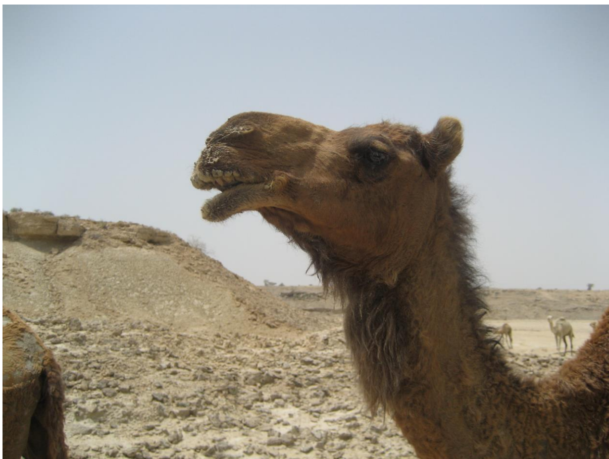
Slika 30. Vrsta Camelus dromedarius

Avicennia marina koji rastu u ovim područjima Irana su impresivni; sa visinom od 3 do 8 m čine najviše primjerke ove vrste u svijetu upravo zbog karakteristične klime koja prevladava na ovome otoku. To je vrsta koja se nalazi u slanoj dubokoj vodi, pod utjecajem visoke plime i kao takva je prilagođena životu u stresnim uvjetima, pogotovo građom korijena koje je zračno i nalazi se izvan vode. Još jedna prilagodba koju ima ova vrsta i bitna je za život u ovim ekstremnim uvjetima je i mogućnost filtracije, tj. kora ima sposobnost apsorbirati slatku vodu dok slana voda eliminira. Vrsta ima svjetlo zelene listove i grane, stvara prekrasne žute cvjetove i sredinom srpnja do kolovoza donosi slatke plodove slične bademima. Sjemenke padaju u vodu nakon čega ih struje nose u mirnija područja mora gdje se zakopaju u morsko tlo i rastu. Veliki, uski i ovalni listovi vrste Avicennia marina kojima se hrane deve imaju vrlo veliku nutritivnu vrijednost, poput ječma i lucerne.