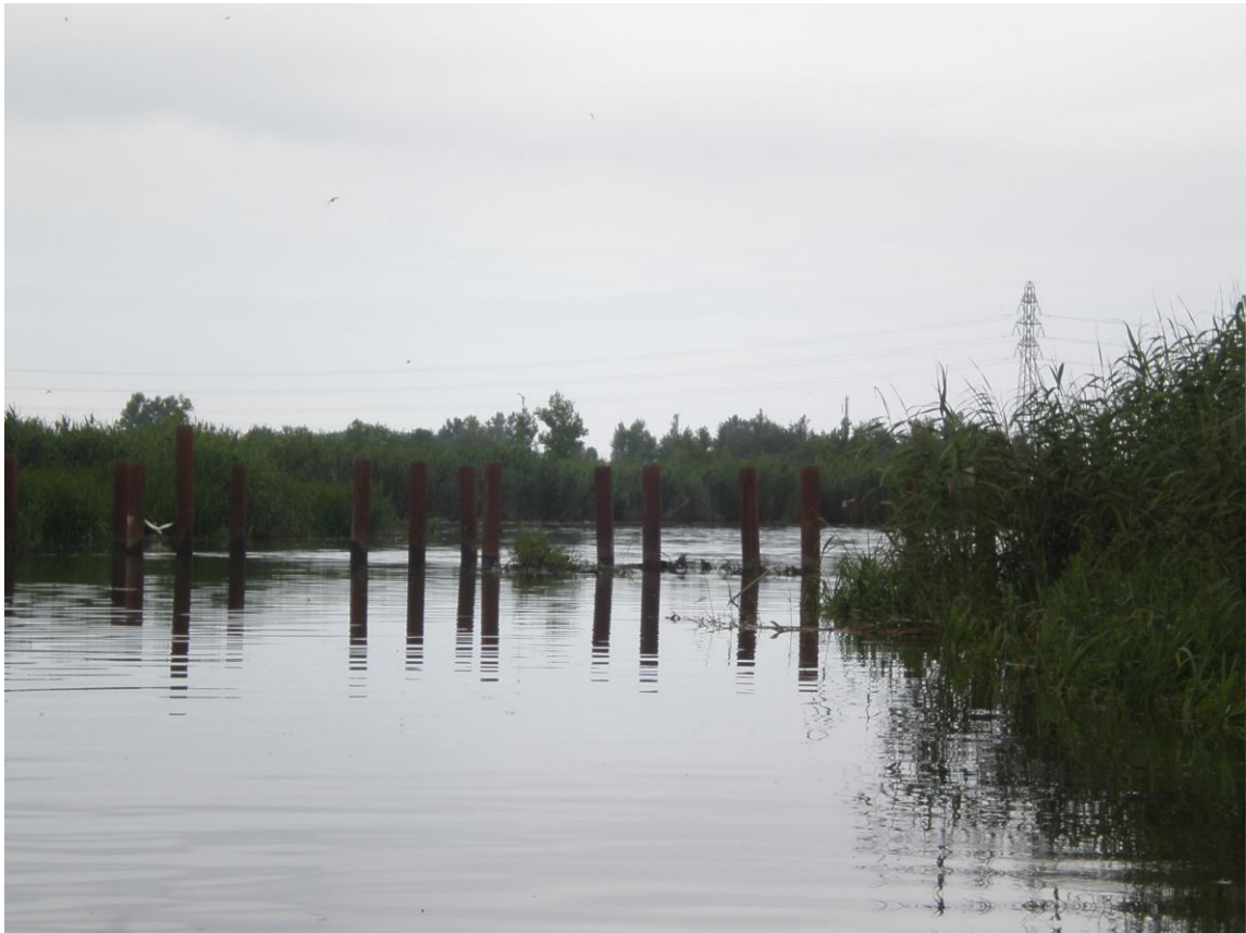
Slika 21. Stupovi kao svjedočanstvo (neuspjelog) pokušaja izgradnje mosta preko Anzalija