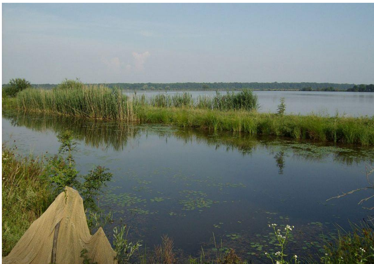
Slika 47. Močvarno stanište Crna Mlaka

S površinom od 6,25 km 2 (625 ha), ovaj ornitološki rezervat i 15 umjetnih ribnjaka površine 700 ha, nalaze se na neprekidno poplavljenom tlu i kao takvo stanište prepoznato je u svijetu i upisano na Popis močvara od međunarodne važnosti 03. veljače 1993. godine. Na ovim fluvijalno-močvarnim nizinama se pretežno nalaze šume i močvarni travnjaci. Gotovo svi riječni tokovi s okolnog gorja natapaju središnji dio zavale – Crnu Mlaku.