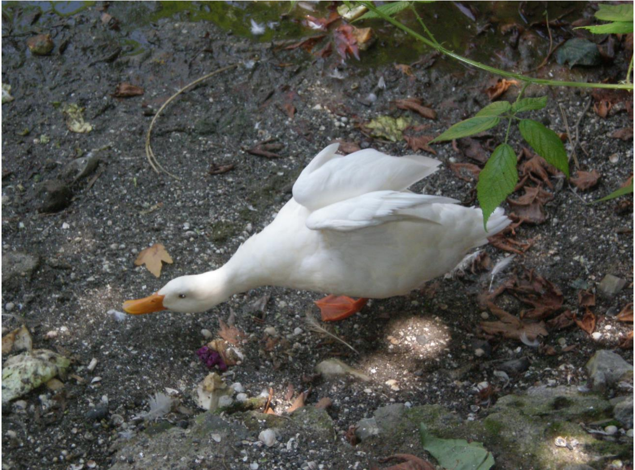
Slika 40. Vrsta Anas platyrhynchos domestica

Ovu provinciju obilježavaju rižina polja, a također je poznata u cijelom Iranu po proizvodnji jako kvalitetnoga meda.