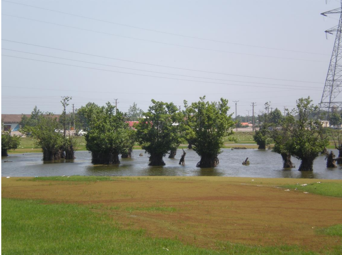
Slika 38. Močvarno stanište Estil

Močvara Estil, bitno stanište za migratorne ptice, nalazi se na delti Volge pa je prisutno i onečišćenje kao i na ostalim područjima Irana gdje se ulijevaju velike rijeke (Darvishsefat 2006).