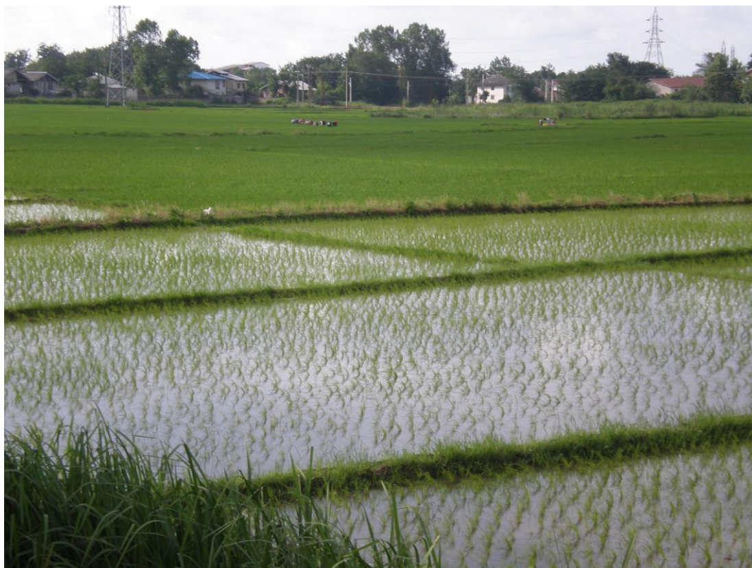
Slika 23. Polje riže na putu Rasht –Anzali

svila. Prolazeći provincijom Gilan, može se primjetiti velika upotreba češnjaka kod lokalnog stanovništva. Na pitanje da li postoji neki posebni razlog tako velike konzumacije češnjaka, dobili smo odgovor da se ovom vrstom iz porodice lukova ublažava i liječi reumu koja je česta kod lokalnog stanovništva zbog njihovog načina života. Naime, jedan od glavnih načina preživljavanja u ovom dijelu Irana je svakako uzgoj riže, za što su potrebni sati stajanja u vodi, a s time dolazi i reumatske tegobe.