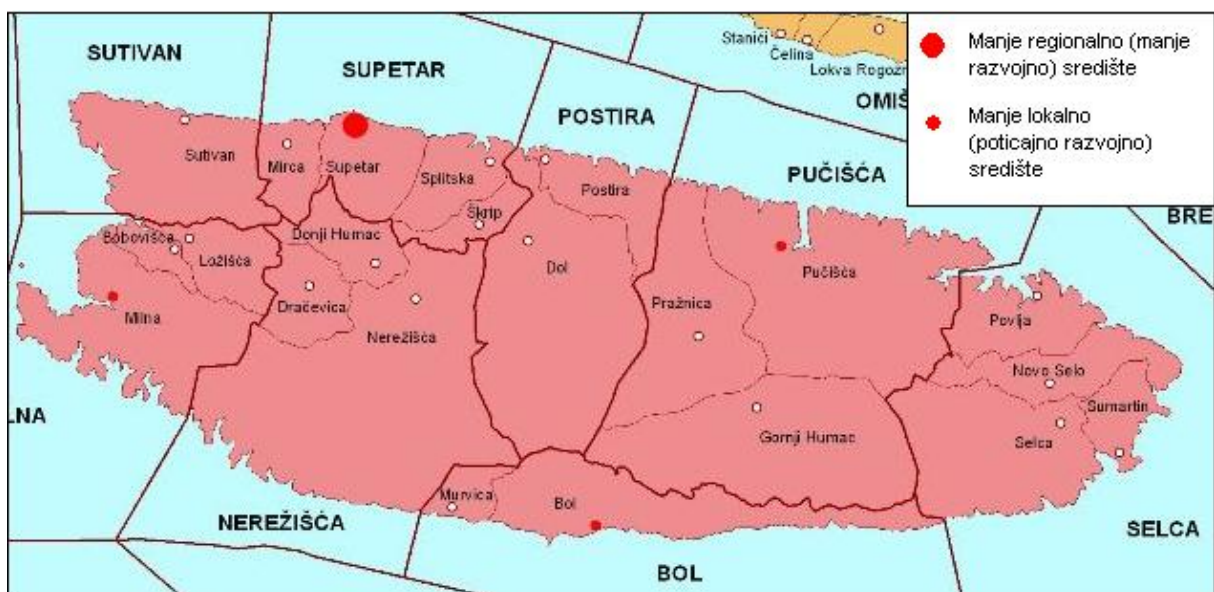
Sl. 2. Centralna naselja otoka Brača

Prema Prostornom planu uređenja Splitsko-dalmatinske županije, očekivano najveći razvojni značaj za otok Brač po svojim funkcijama ima grad Supetar koji je svrstan čak u manje regionalno središte, a ostala naselja svrstana u skupinu manjih lokalnih središta su Bol, Milna i Pučišća (poticajna razvojna središta). Prostorno su ta središta raspoređena tako da pokrivaju područja udaljenija od Supetra. Može se reći da je taj prikaz u skladu sa analizom centralnih naselja otoka Brača, s time da Milna trenutno nema dovoljno centralnih funkcija da bude poticajno razvojno središte.