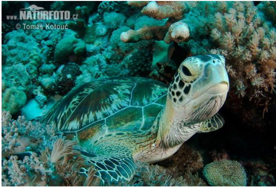
Slika 3. Golema želva.