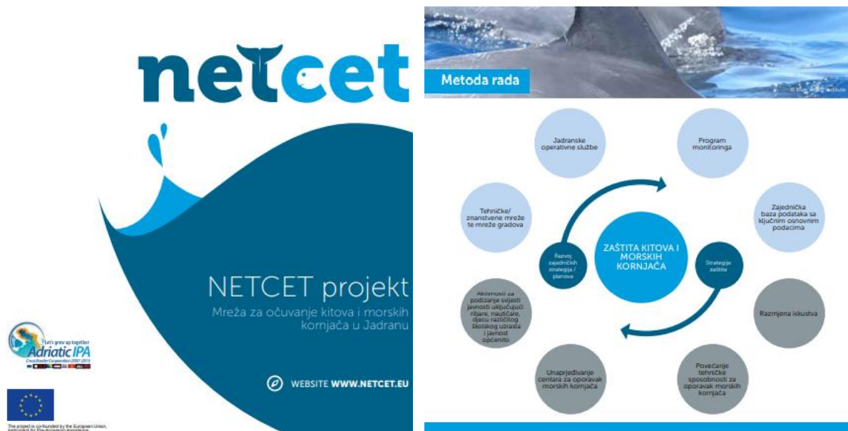
Slika 6. Program NETCET projekta.