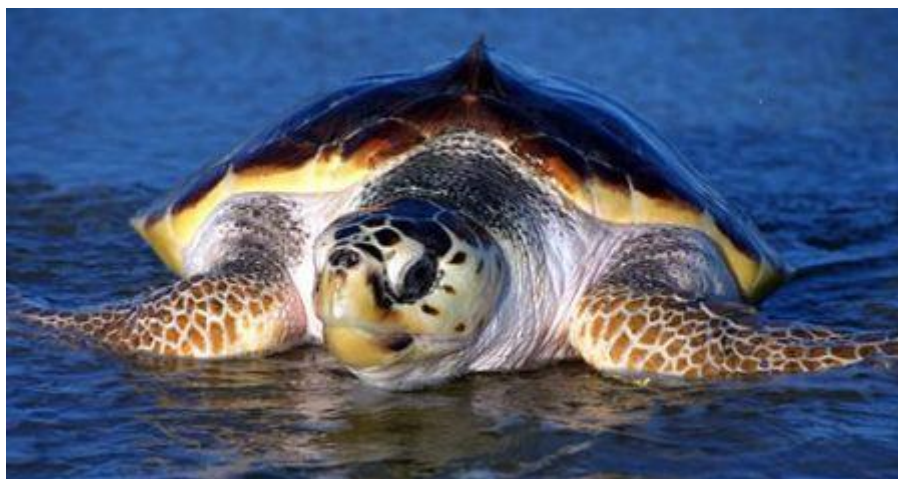
Slika 2. Glavata želva.

Glavata želva je duga oko 1 metar što ju čini najmanjom od morskih kornjači koje možemo vidjeti u Jadranskom moru. Leđna strana tijela joj je smeđe do smečkasto-crvenkaste boje, a trbušna strana je svjetlije, žućkaste boje (Sl. 2.). Za razliku od sedmopruge usminjače, ova vrsta je vrlo česta u Jadranskom moru. Iako je područje razmnožavanja ove populacije glavatih želvi Grčka, nije isključena mogućnost da u rjeđim slučajevima mogu leći jaja na plažama dalmatinskih otoka. Za ubijenu jedinku ove vrste kazna je 35 tisuća kuna ( http://kornjace.com/modules/publisher/item.php?itemid=25 ).