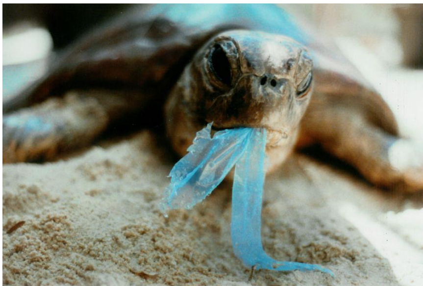
Slika 5. Morska kornjača koja je progutala plastičnu vrećicu.

U usporedbi s ostalim morima na kojima su rađena istraživanja, pojava otpada u tijelu glavatih želvi na području Jadranskog mora slična je onoj u srednjem sjevernom dijelu Tihog oceana, a osjetno niža u susjednim područjima, tj. zapadnom i središnjem dijelu Sredozemnog mora. Također, otprilike iste količine otpada su pronađene i u drugoj vrsti morskih kornjača sedmoprugim usminjačama ( Dermochelys coriacea V.). Osim što nije bilo razlike u količini, vrsti i obliku progutanog otpada između dvije vrste, nije bilo razlike ni između muških i ženskih jedinki jedne vrste, glavate želve ( Caretta caretta L.), odnosno, nije uočeno da fizičke karakteristike poput dužine i težine utječu na unos određenih tipova otpada (Lazar i Gračan, 2011.).