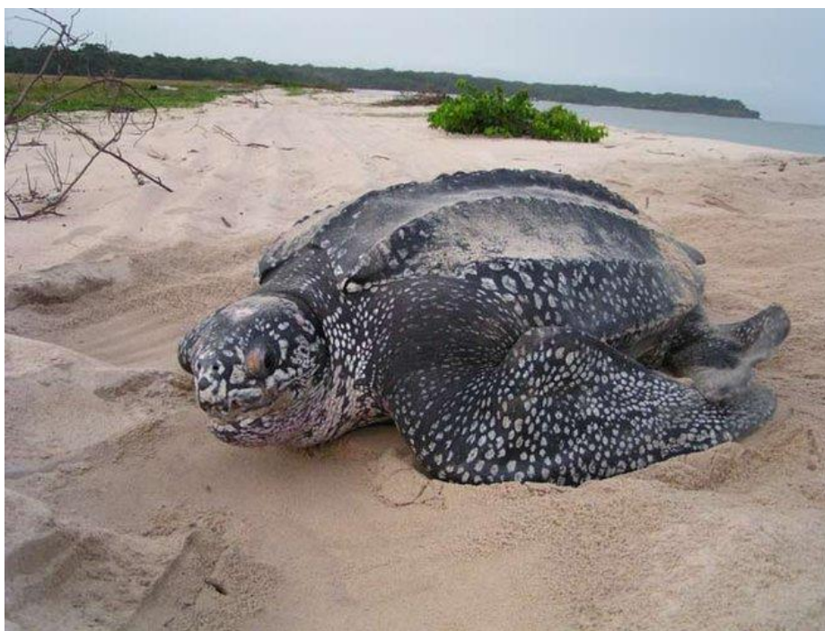
Slika 1. Sedmopruga usminjača.

Od tri vrste morskih kornjača koje nalazimo u Jadranu ova je najveća. Osim što može narasti i do dva metra dužine, odrasle jedinke teže oko 600 kilograma te su čak pronađene jedinke koje su težile 750 kg. Sedmopruga usminjača je kornjača tamnosmeđe boje sa svijetlim pjegama (Sl. 1.), a što se tiče oklopa ona je iznimka u svom rodu. Naime, dok ostale usminjače imaju tvrdi oklop, ove imaju kožnati. Iako preferira toplija mora rasprostranjena je po cijelom svijetu, a šansa da je ljudi opaze u Jadranskom moru je zapravo vrlo mala. Omnivor je, što znači da jede i biljke i životinje, a omiljena hrana su joj meduze i salpe. Zbog njene zaštićenosti određena je kazna za njeno ubijanje u iznosu od 40 tisuća kuna ( http://kornjace.com/modules/publisher/item.php?itemid=25 ).