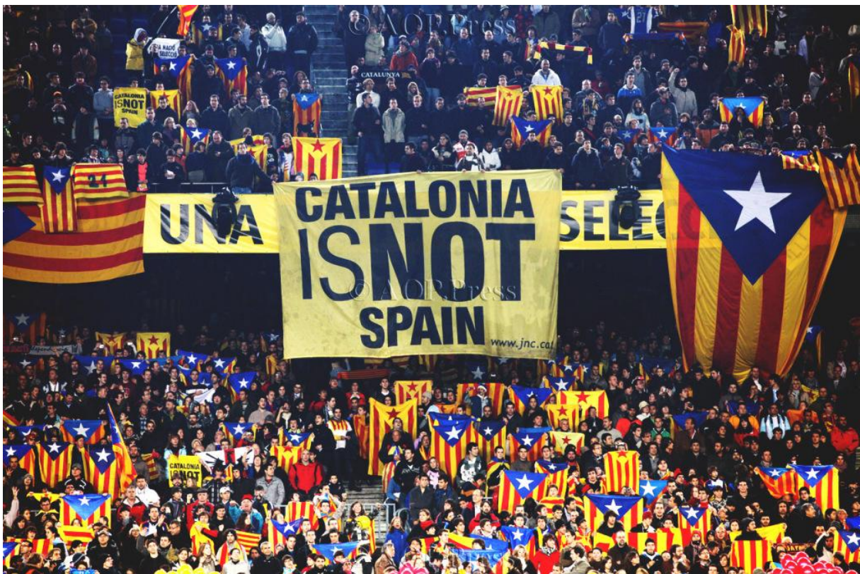
Sl.4. Prizor ispunjenog Camp Noua katalonskim zastavama i s natpisom na engleski: “Katalonija nije Španjolska”

personaliziraju kroz Franca i njegov teror koji im je nanio toliko nepravde i zla. Osim toga, Franco je bio veliki financijer i promotor madridskog Reala. Ista je stvar kada Barcelona gostuje u glavnome gradu, na Realovom stadionu Santiago Bernabeu. U vrućoj madridskoj atmosferi, navijači Reala Madrida, a osobito istaknuti nacionalisti i osobe desne političke orijentacije, nose i dižu španjolske zastave, simbole i dresove.