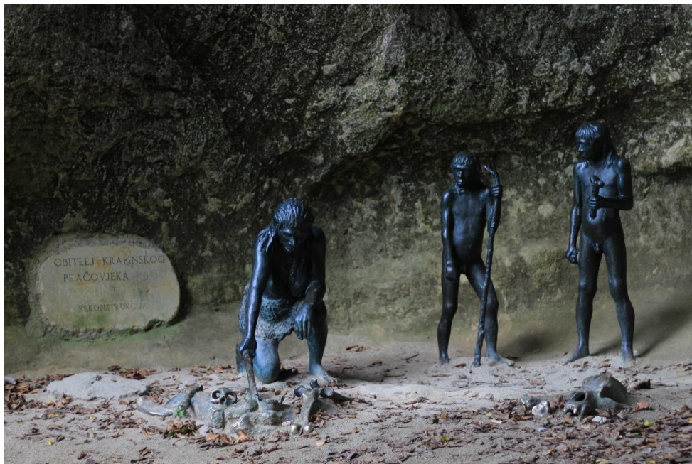
Slika 4. Polušpilja na Hušnjakovom brijegu

Neandertalci su iskorištavali sve pogodnosti koje im je špilja nudila, od sigurnosti, pa do blizine i vode i šume. Živjeli su u manjim skupinama te su također imali podjelu rada, gdje je muškarac bio odgovoran za prehranu i lov, obranu i izradu oruđa, a žene su održavale vatru, vodile brigu o djeci, skupljale plodove i pripremale hranu. Visoki postotak zaliječenih ozljeda i patoloških promjena na kostima neandertalaca govori nam kako njihov život nije bio lagan. Na lubanji Krapina D zamijećena je zacijeljena ozljeda na predjelu lambdoidalnog šava koja ukazuje na to da je osoba bila u nesvijesti danima ili čak tjednima (Janković, 2004). Također je u Krapini nađen i zacijeljen prijelom kosti. To nam pokazuje da u neandertalci vodili skrb o bolesnima i nemoćnima kako bi se što prije oporavili. Unatoč svim teškoćama oni su često doživljavali i tridesete ili rane četrdesete godine (Karavanić, 2004).