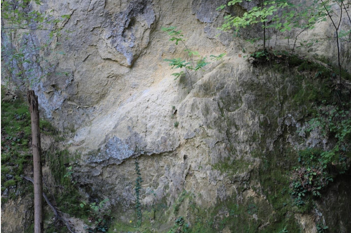
Slika 2. Miocenski pješčenjaci koji izgrađuju polušpilju na Hušnjakovom brijegu

Upravo tektonska izdizanja dijelova terena, denudacija, erozija i različita čvrstoća stijena uvijetovali su oblikovanje brežuljkastoga krajolika Krapine te nastajanje doline rijeke Krapine (Hećimović i Šimunić, 2006).