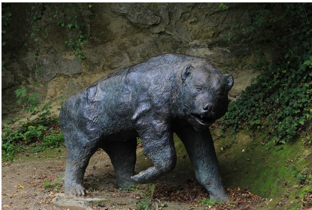
Slika 5. Špiljski medvjed