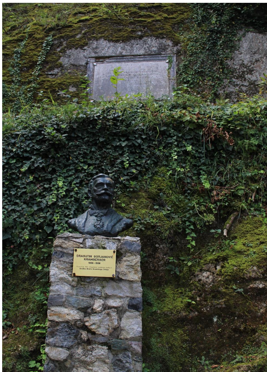
Slika 1. Skulptura Dragutina Gorjanovića-Krambergera u Krapini

posebice zbirka kutnjaka ili molara, koja je bila najveća zbirka fosilnih zubi te vrste ( http://www.hpm.hr/ ).