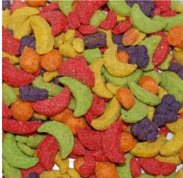
Slika 2: Ekstrudirana hrana u različitim bojama i veličinama