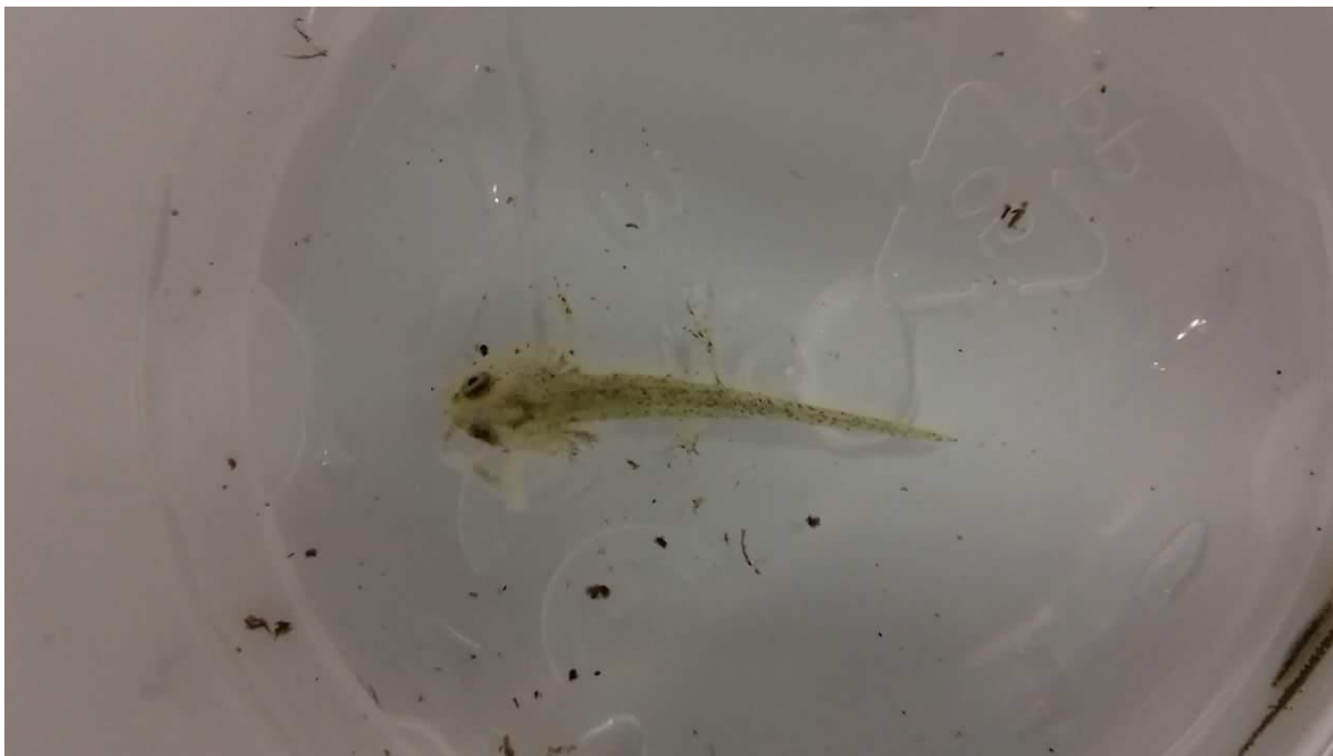
Slika 6.a (gornja) ličinka u kasnijem stadiju razvoja, zabilježen kanibalizam, ostaci manje ličinke ispred nje i 6.b (donja) ličinka u kasnijem stadiju razvoja, uočljive stražnje noge