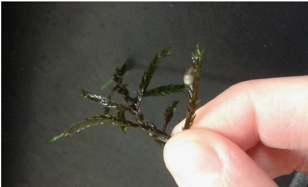
Slika 5. Jaje (bez ljuske) odloženo na travi.