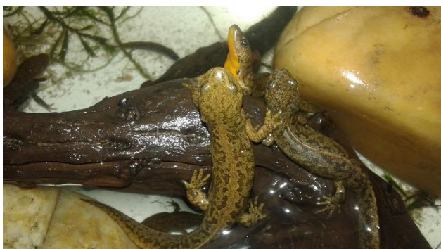
Slika 3.a (gornja) Ichthyosaura alpestris , ženka i 3.b (donja) tri ženke „odmaraju“ na grani