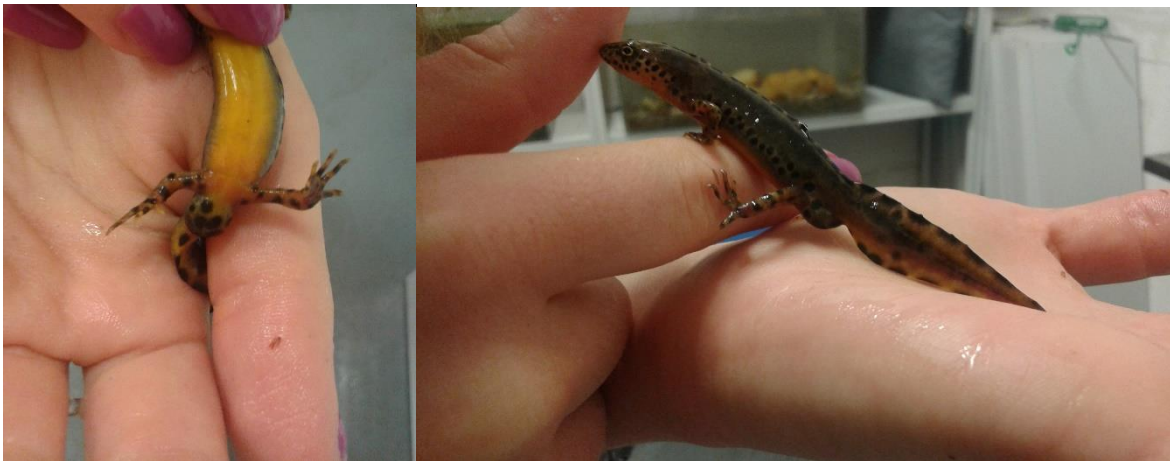
Slika 2. Ichthyosaura alpestris , fizičke karakteristike mužjaka; 2.a (lijevo) zaokružena kloaka i 2.b (desno) kresta u nastanku

ovisno o prehrani (url 6). Dok su na trbuhu točke veoma rijetke, vrat ovisno o podvrstama, može biti jednostavno obojen, točkast ili samo sa točkastom ogrlicom. Albino vodenjaci također postoje, jako su neobični sa svojim crvenim šarenicama, ali su i jako osjetljivi i nježni. Ralični (nepčani zubi) u dva reda posteriorno široko divergiraju, a konvergiraju anteriorno. Duljina repa je aproksimativno jednaka ili malo kraća od ukupne duljine tijela s glavom. Kod odraslih vodenjaka koža je glatka u akvatičkoj, a granulirana u kopненоj (terestričkoj) fazi. Postoje određene razlike u duljini repa i tijela između mužjaka i ženki (ženke su nešto veće), u duljini prednjih i stražnjih nogu, relativnoj duljini glave itd..