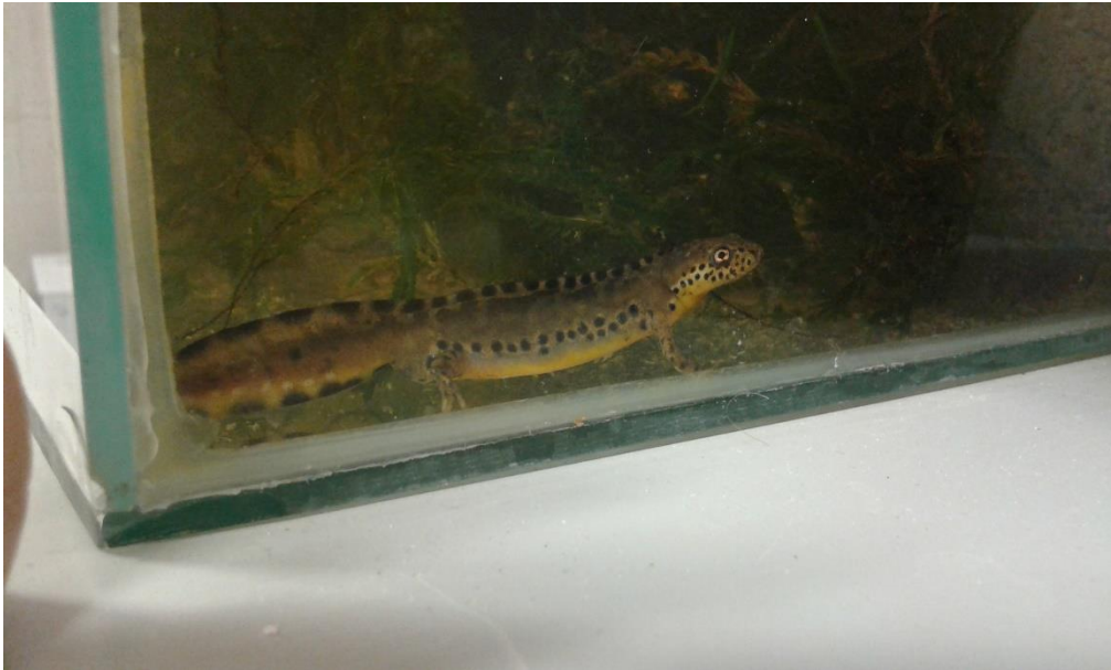
Slika 1. Ichthyosaura alpestris , mužjak

veluchiensis , inexpectatus , lacusnigri i cyreni . Vrste su rijetke u Mađarskoj i Bugarskoj, ugrožene u Austriji i Danskoj, a ranjive u Španjolskoj (url 4).