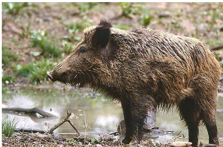
Slika 1. Divlja svinja (preuzeto s UniProt 2015)

Prema trenutno važećem Zakonu o lovu (1994) i Pravilniku o lovostaji (1999), divlje svinje pripadaju u skupinu lovostajem zaštićene divljači. Za vepove i nazimad nema ograničenja lova tijekom godine, dok je za krmače i prasad propisana lovostaja u razdoblju od 5. siječnja do 1. lipnja (Konjević 2005). Divlja svinja je vrlo prilagodljiva i otporna vrsta, te se smatra da upravo zbog te karakteristike uspjela zadržati veliku brojnost i rasprostranjenost. Može napredovati u uvjetima promijenjenog staništa i lova, što nije slučaj za većinu druge divljači (IUCN 2015).