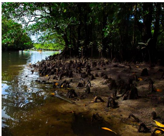
Slika 3. Bruguiera spp. koljenasto zračno korijenje